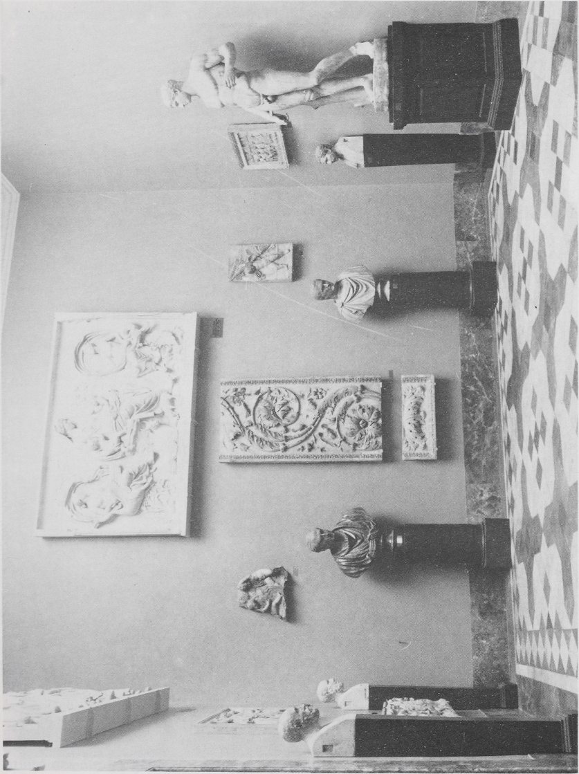
Abb. 3 Firenze, Uffizien, Sala archeologica, heutiger Zustand (Gabinetto fotografico 352981)