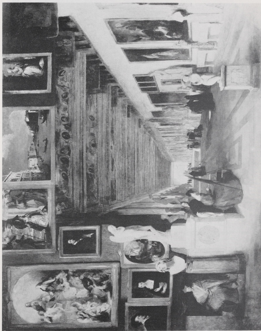
Abb. 4 Florenz, Uffizien, westliche Teil (Ordnung der Arbeiten nach Entenri) aus Giornale del Pittore , Ant. 18. H. Zeichnung von Filiberto Rossi (Gabinetto fotografico 153316)