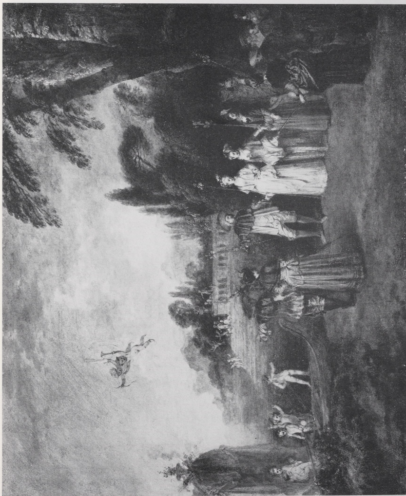
Abb. 4 Antoine Watteau, Einschiffung nach Cythera . Öl/Leinwand, 43,1 × 53,3, um 1709. Frankfurt, Städtisches Kunstinstitut