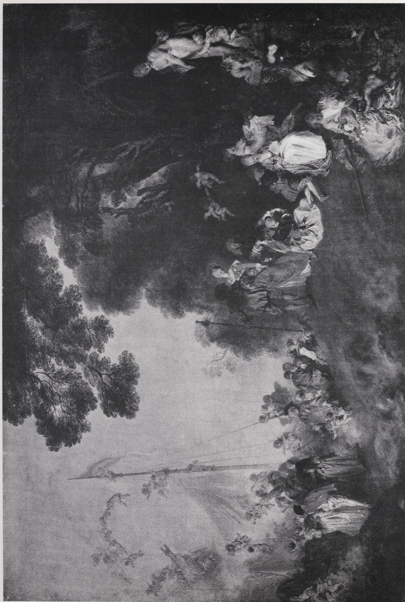
Abb. 1 Antoine Watteau, Einschiffung nach Cythera. Berlin, Schloß Charlottenburg