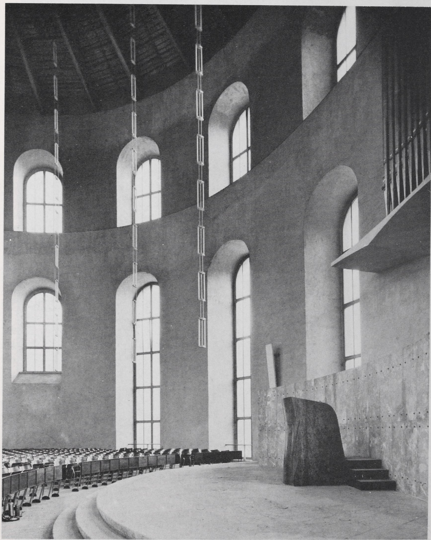
Abb. 2 Frankfurt, Paulskirche, nach dem Wiederaufbau