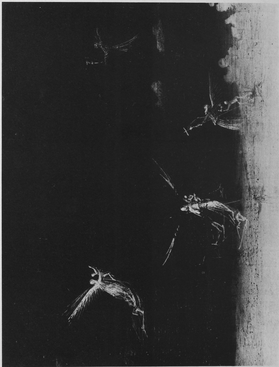
Abb. 4 Enguerrand Quarton, Couronnement de la Vierge (détail). Villeneuve-les-Avignon, Musée de l'hospice