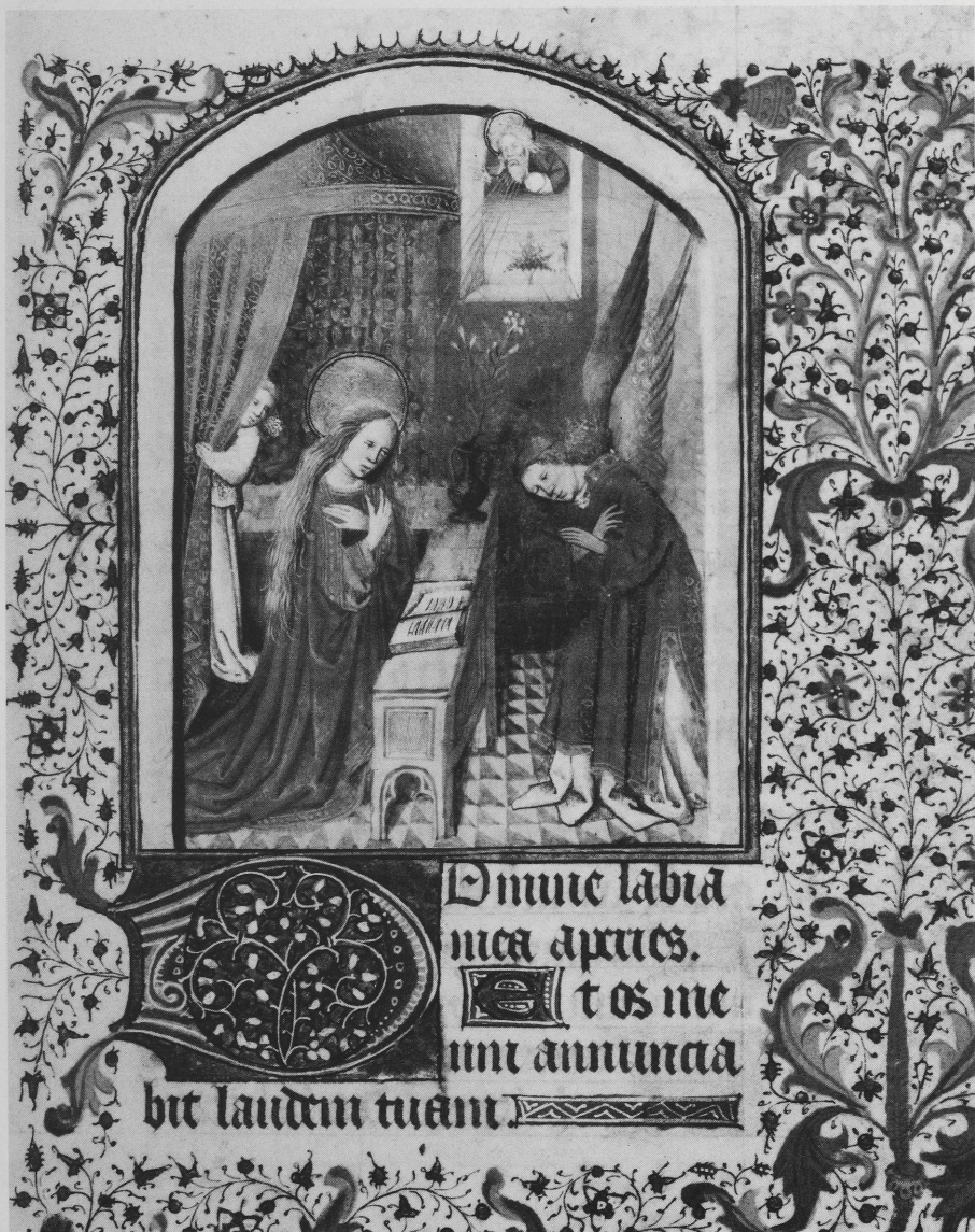
Abb. 3 Annonciation. Heures à l'usage d'Amiens. Baltimore, Walters Art Gallery, W. 262 (musée)