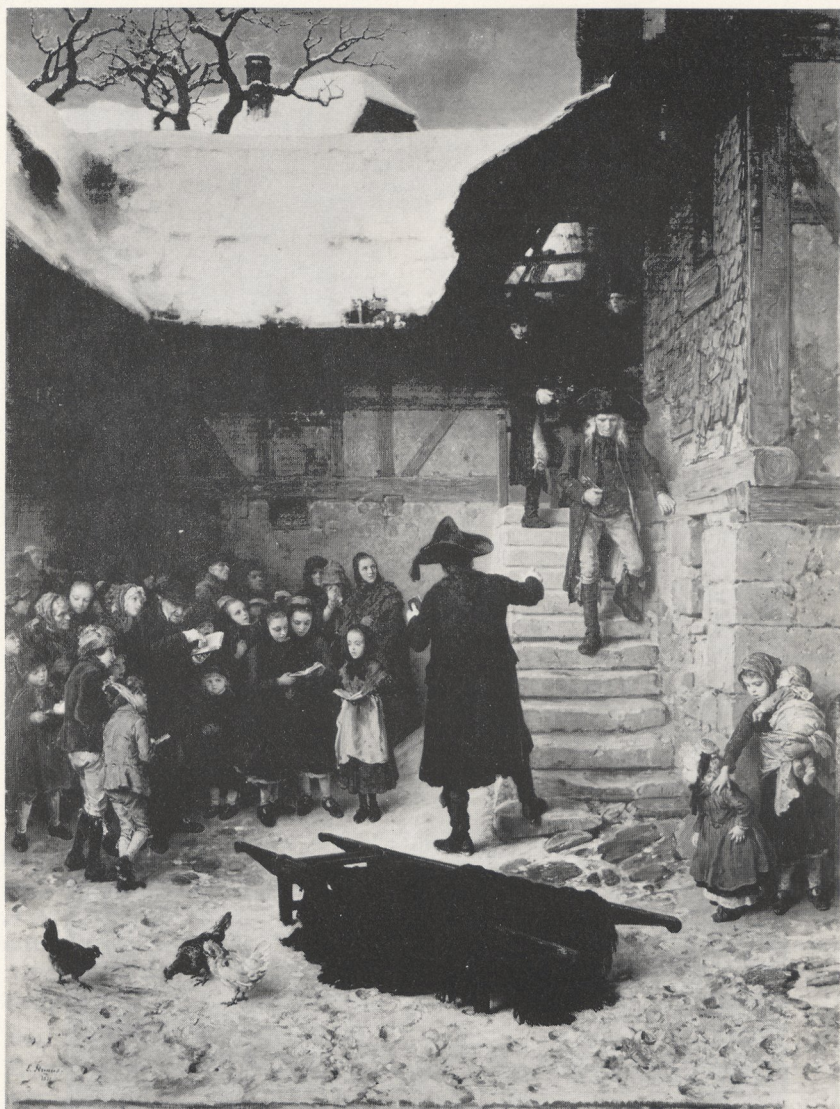
Abb. 3 Ludwig Knaus: Leichenbegängnis in der Schwalm; 1871. Marburg/ Lahn, Marburger Universitätsmuseum für Kunst- und Kulturgeschichte