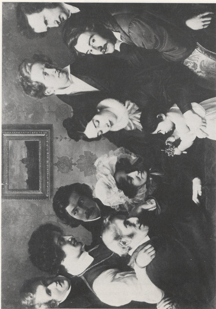
Abb. 1 Carl Ferdinand Sohn: Die Familie Bendemann und ihre Freunde; ca. 1832. Krefeld, Kaiser Wilhelm Museum