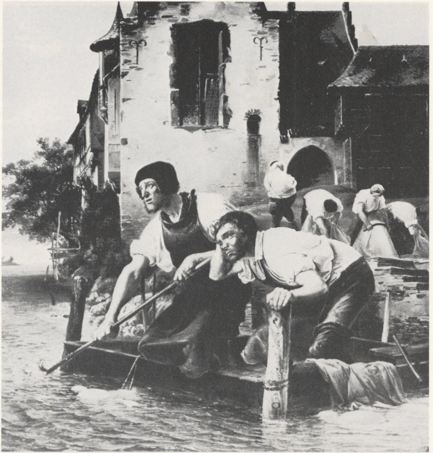
Abb. 2 Adolf Schroedter: Die trauernden Lohgerber ; 1832. Frankfurt/M., Städt. Galerie im Städelschen Kunstinstitut