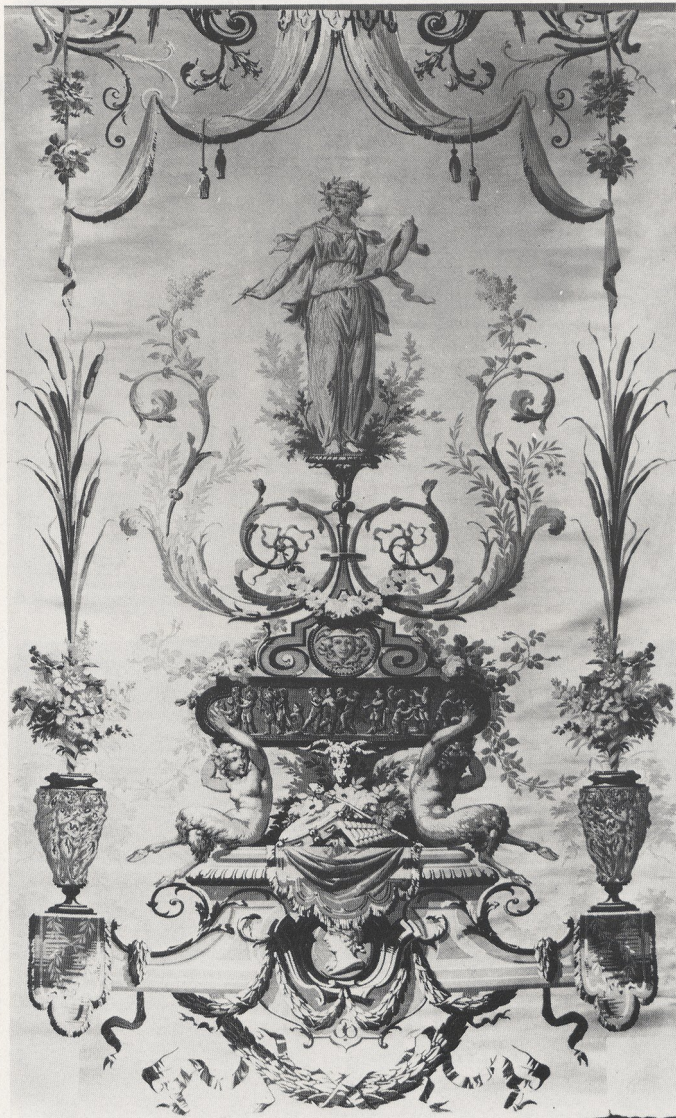
Abb. 1 Seidengewebe, Lampas, Lyon 1866. Krefeld, Textil- museum, Stiftung Bayer AG (Slg. Geheimrat Duisberg)