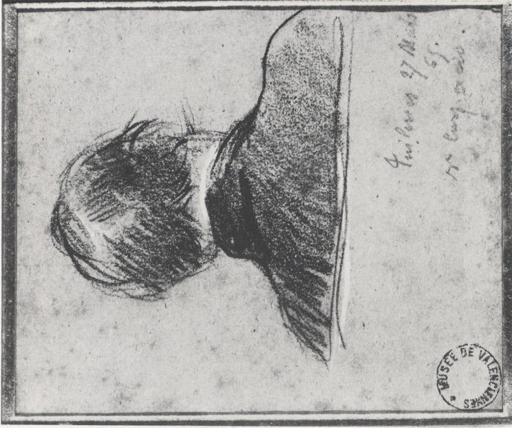
Abb. 2b J.-B. Carpeaux: Studie zur Rückansicht der Büste Napoleons III. Schwarze und weiße Kreide auf grauem Papier. Valenciennes, Musée des Beaux-Arts