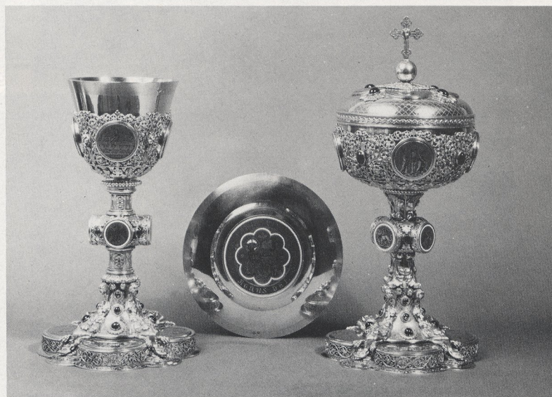
Abb. 4a + b P. Poussielgue-Rusand: Tablett mit Meßpollen; Ciborium, Kelch und Patene. Paris 1862. Silber, vergoldet, getrieben, gegossen, montiert, graviert, Grubenschmelz, Edelsteine. Köln, Kunstgewerbemuseum der Stadt, Leihgabe der Overstolzengesellschaft