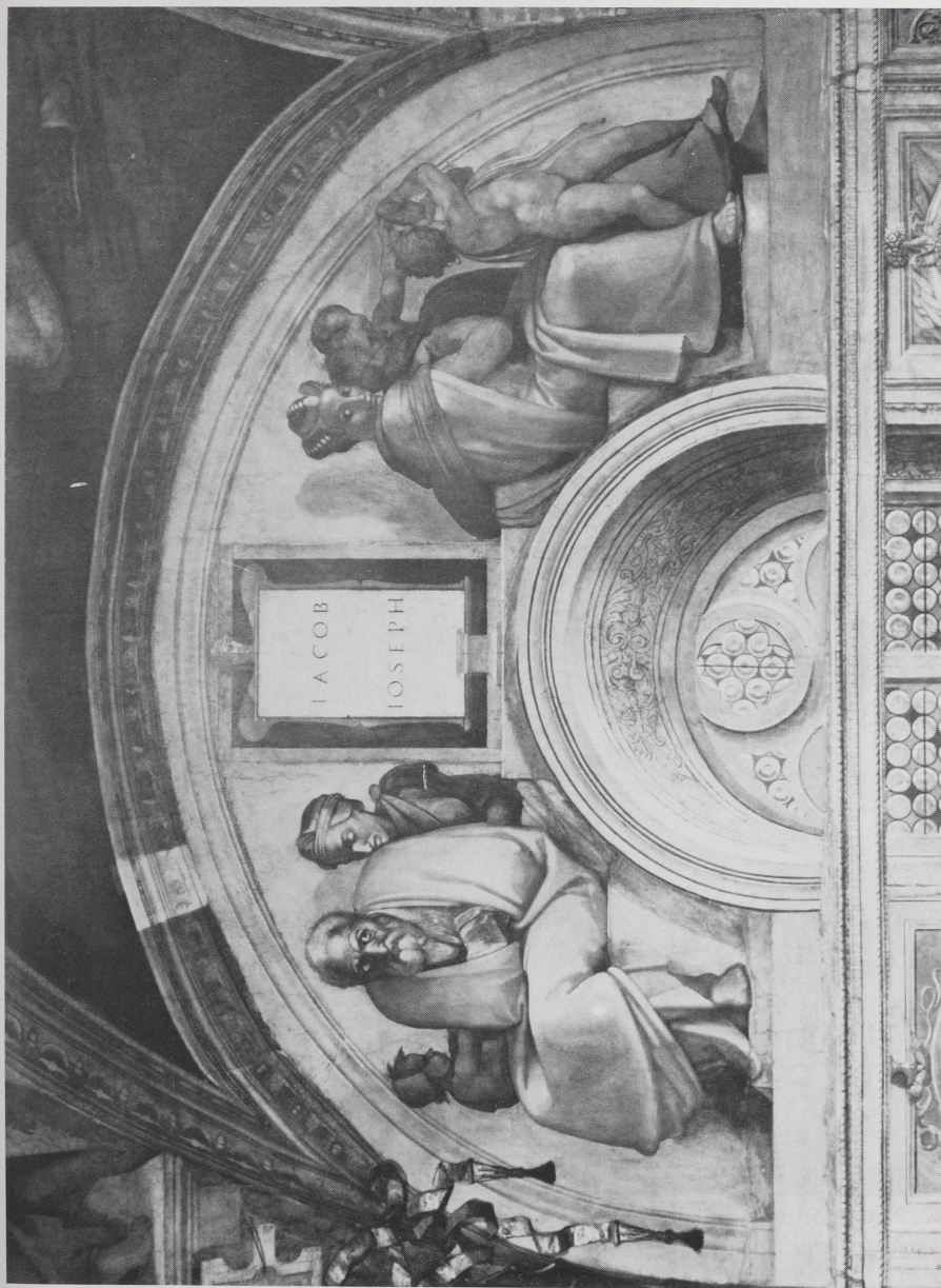
Abb. 1 Rom, Sixtinische Kapelle. Lünette mit JACOB — JOSEPH nach der Reinigung