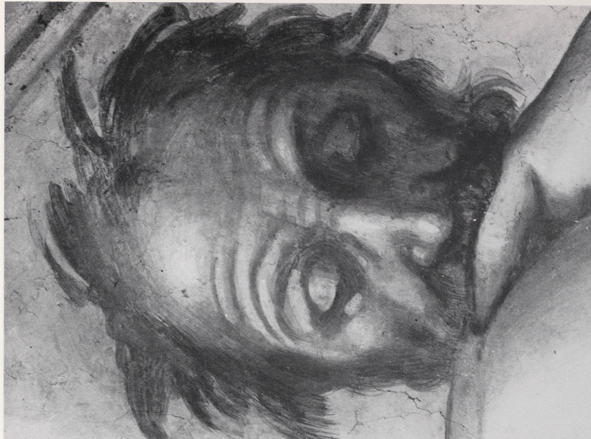
Abb. 4b Rom, Sixtinische Kapelle. Detail der Länette mit AZOR – SADOc nach der Reinigung