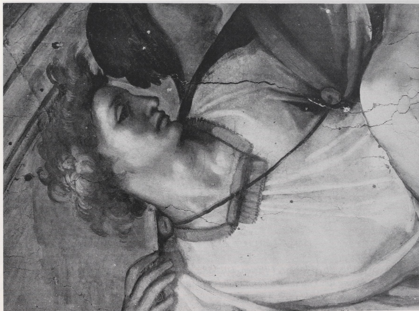
Abb. 4a Rom, Sixtinische Kapelle. Detail der Länette mit ELEAZAR – MATHAN nach der Reinigung und vor der Rettusche