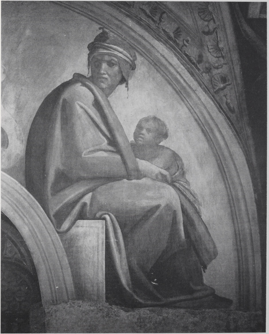
Abb. 2 Rom, Sixtinische Kapelle. Lünette mit ZOROBABEL — ABIUD — ELIACHIM nach der Reinigung: rechte Gruppe