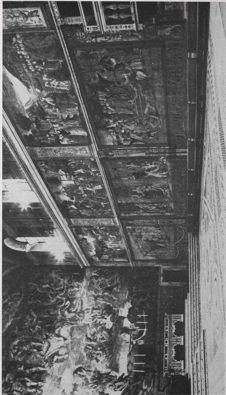
Abb. 2 Rom, Vatikanischer Palast, Sixtinische Kapelle, März 1983