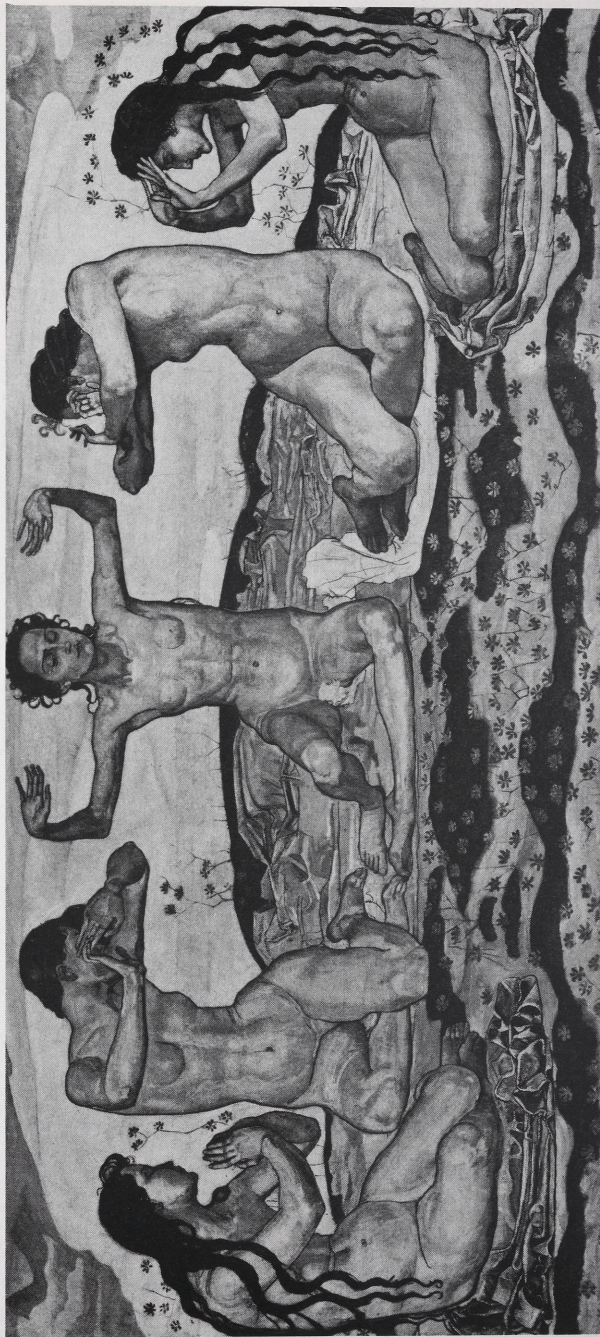
Abb. 4 Ferdinand Hodler, Der Tag (Erste Fassung, 1900, nicht ausgestellt). Bern, Kunstmuseum