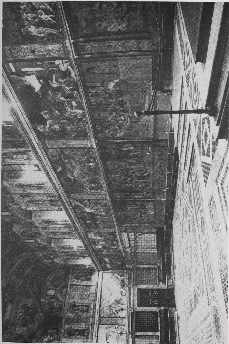
Abb. 3 Rom, Vatikanischer Palast, Sixtinische Kapelle, März 1983