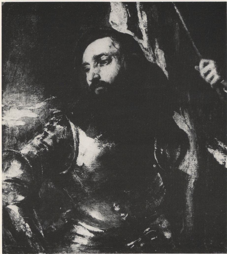
Abb. 1 William Etty, Der Fahnenträger aus Tizians „Pesaro-Madonna“, 1823. Öl auf Lwd., 29 × 25 cm. City of York Art Gallery