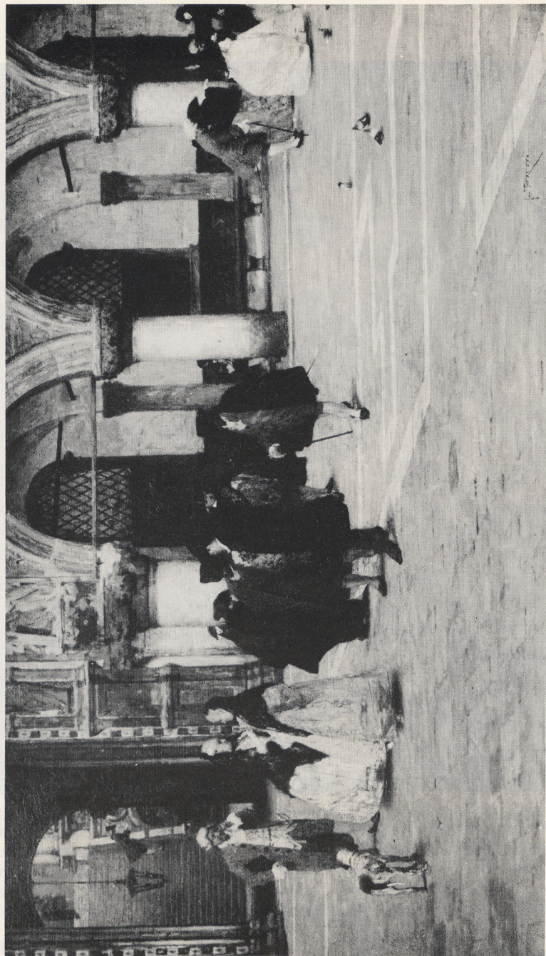
Abb. 2 Giacomo Favretto, Passeggiata in Piazzetta , 1884. Öl auf Lwd., 74 × 128 cm. Venedig, Museo d'arte moderna