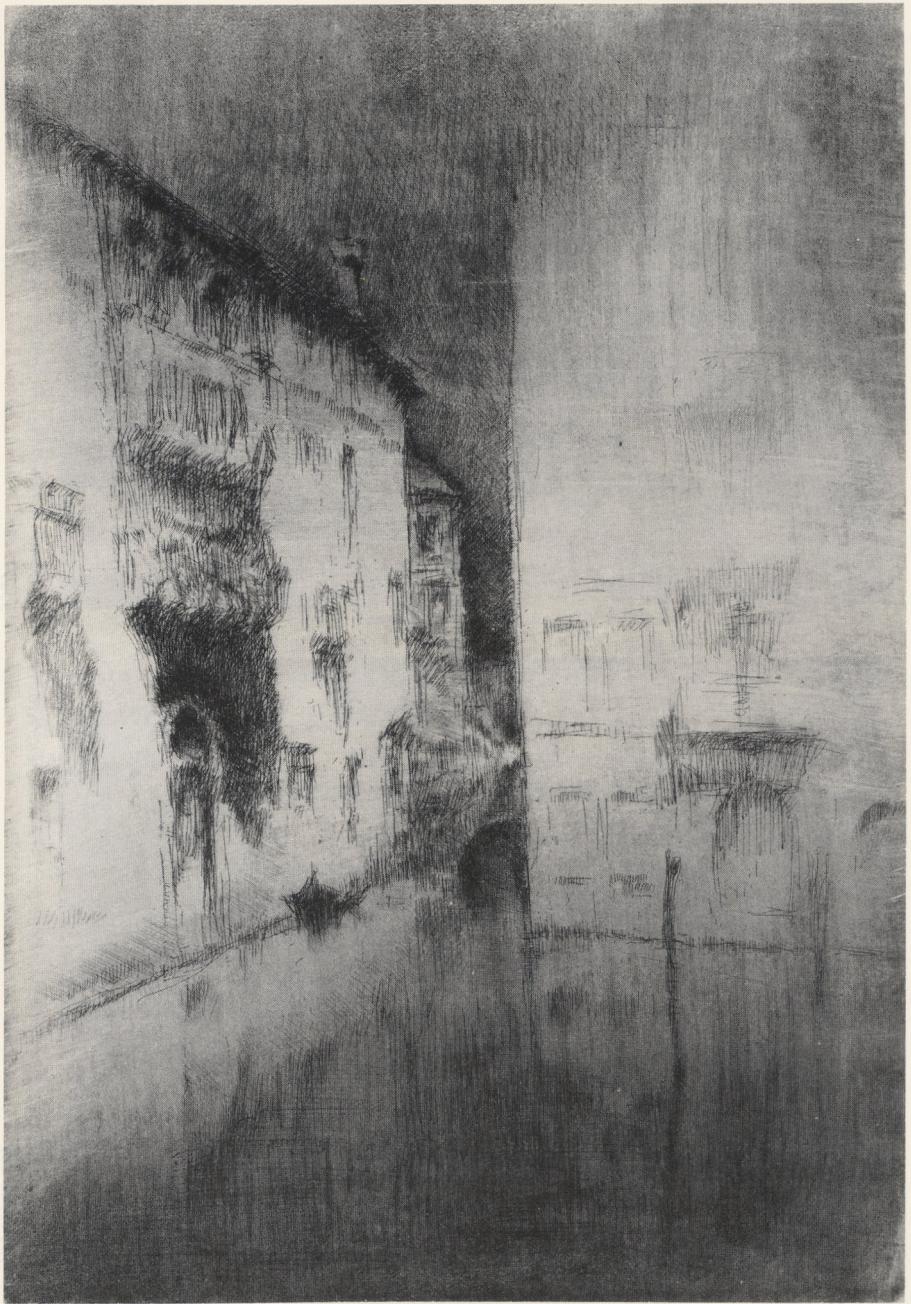
Abb. 3 James McNeill Whistler, Nocturno , 1880. Radierung und Kaltnadel, 30 × 20 cm (Brit. Mus.)