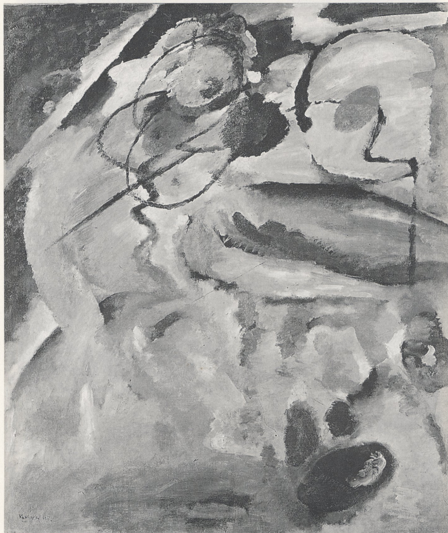
Abb. 1 Wassily Kandinsky, Bild mit Kreis, 1911. Tbilisi, Kunstmuseum der Grusinischen Republik, Inv. Nr. J-305