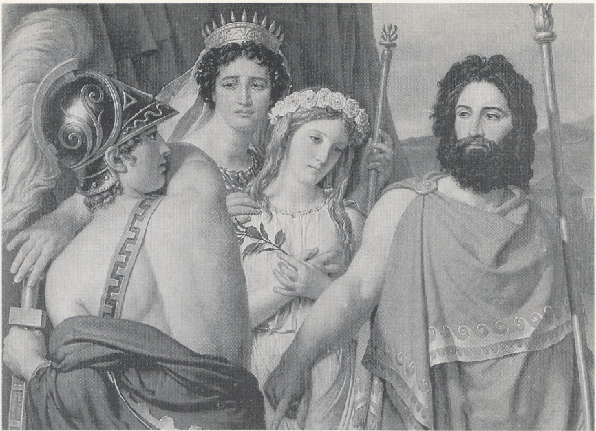
Abb. 4a Jacques Louis David, Der Zorn des Achilles , 1819. Fort Worth, Kimbell Art Museum (Kat. David, Paris 1989, S. 529)