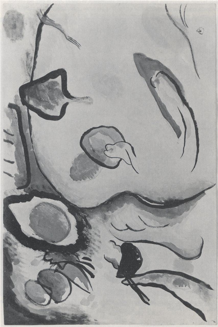
Abb. 2 Wassily Kandinsky, Aquarellskizze zu „Improvisation 25“, 1912. New York, Guggenheim Museum (Museum)