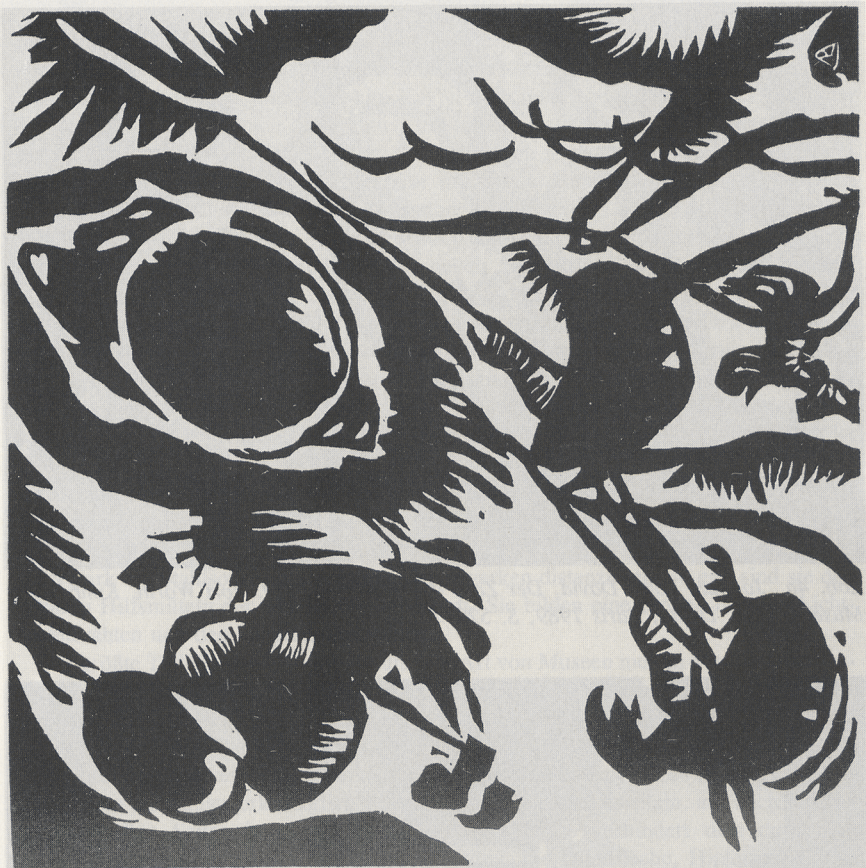
Abb. 3 Wassily Kandinsky, „Motiv aus Improvisation 25“, Holzschnitt, 1911. München, Lenbachhaus (Museum)