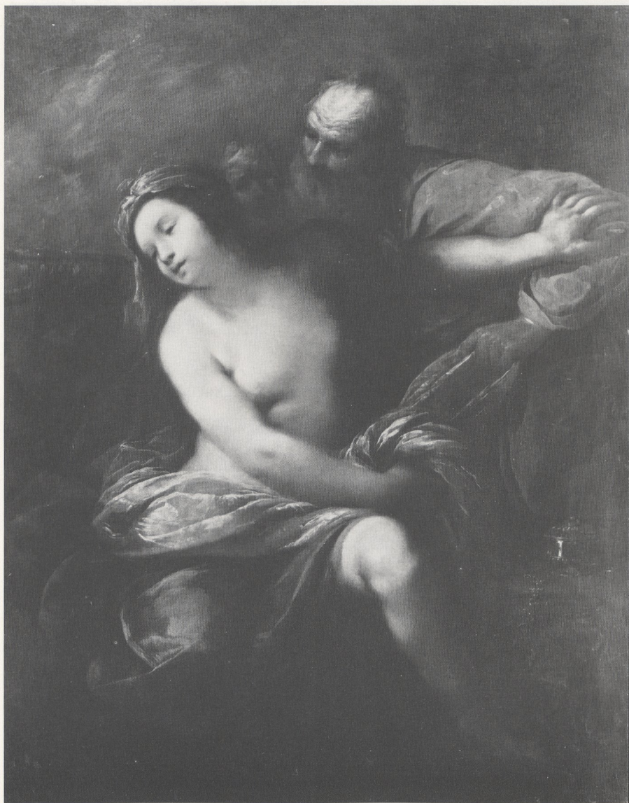
Abb. 4 Sebastiano Mazzoni: Susanna und die beiden Alten. Englischer Privatbesitz