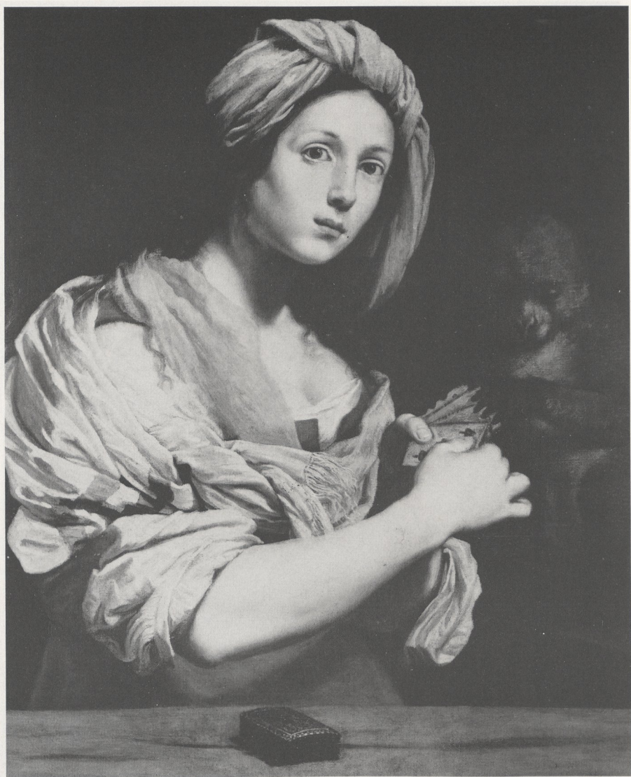
Abb. 1 Lorenzo Lippi: Allegorie des Glücks. Belfast, Ulster Museum