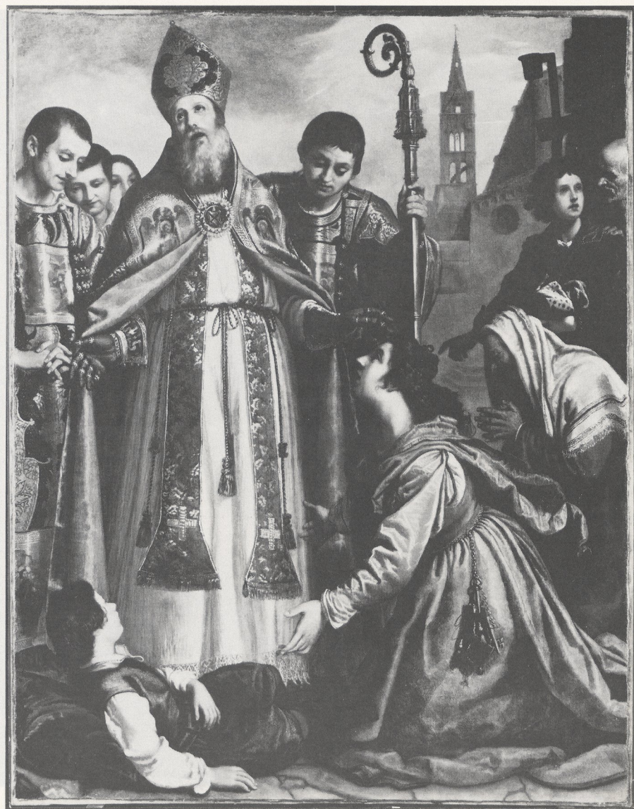
Abb. 2 Giovanni Biliverti: Der heilige Zenobius erweckt einen toten Knaben. London, National Gallery