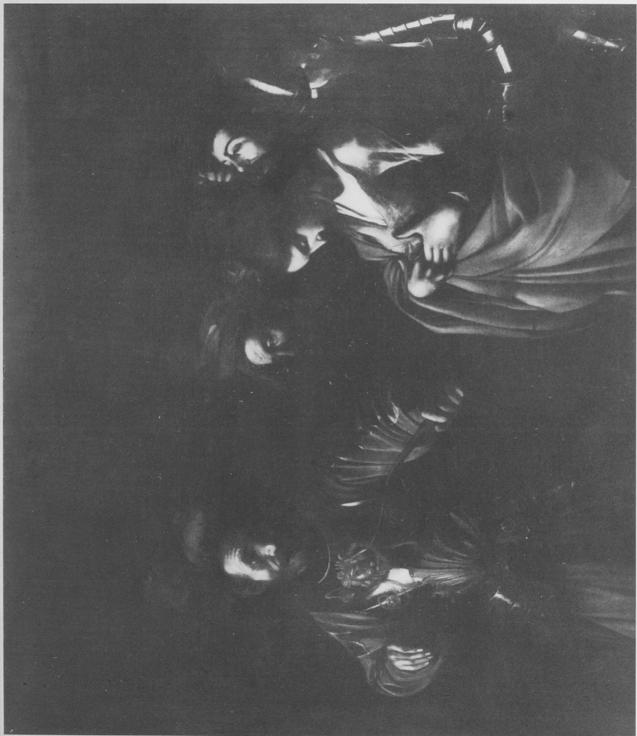
Abb. 1 Caravaggio, The Martyrdom of St. Ursula. Naples, Banca Commerciale