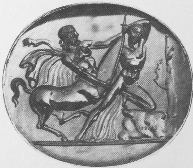
Abb. 4 Steinschnitte wohl aus der Sammlung des Stanislas Ponia- towski (Italien, fr. 19. Jh.): London, British Museum, Hull Grundy Gift, Kat. 836-838 (Katalog S. 210 f.)