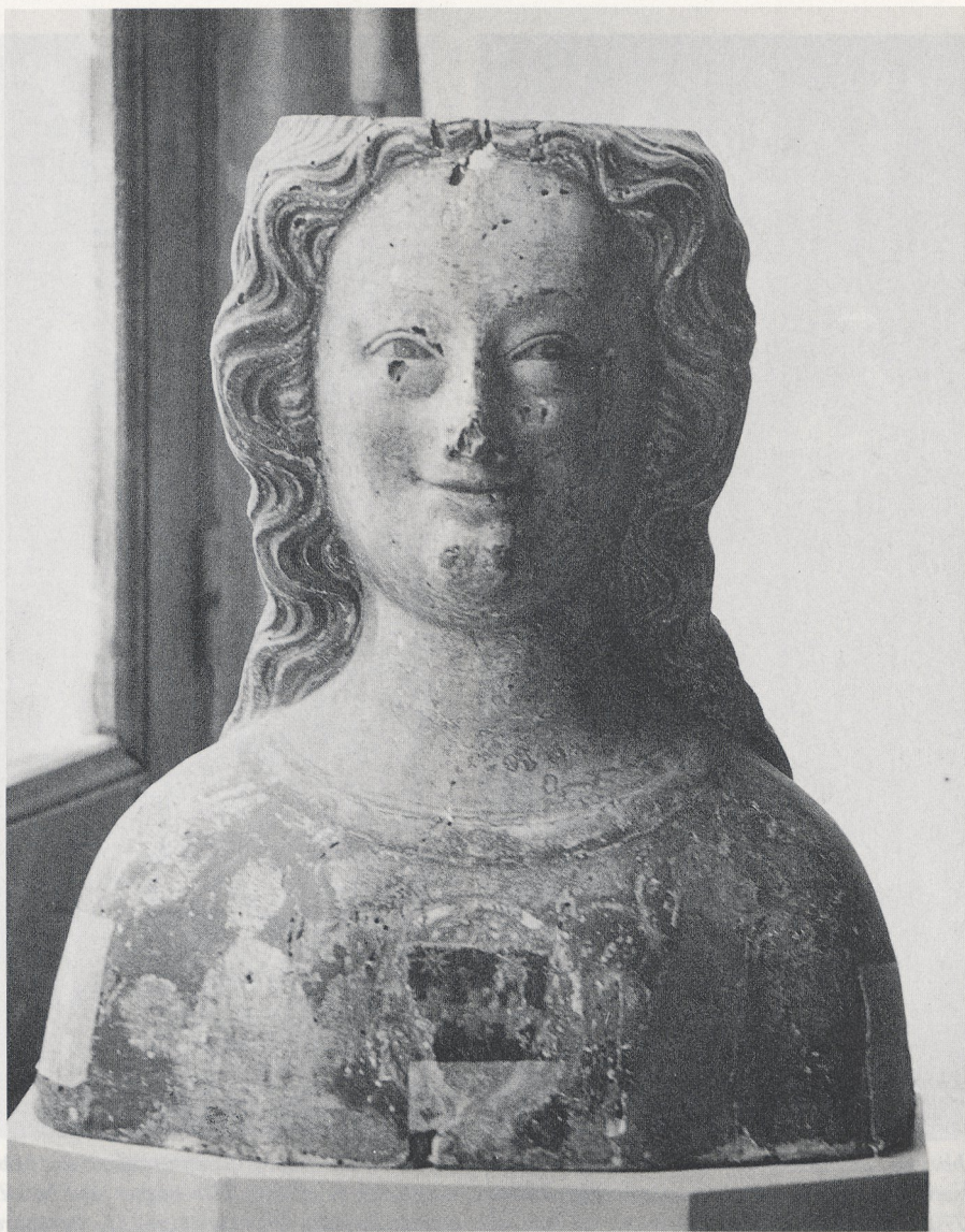
Abb. 6 Reliquienbüste aus S. Agostino. Trapani, Museo Pepoli