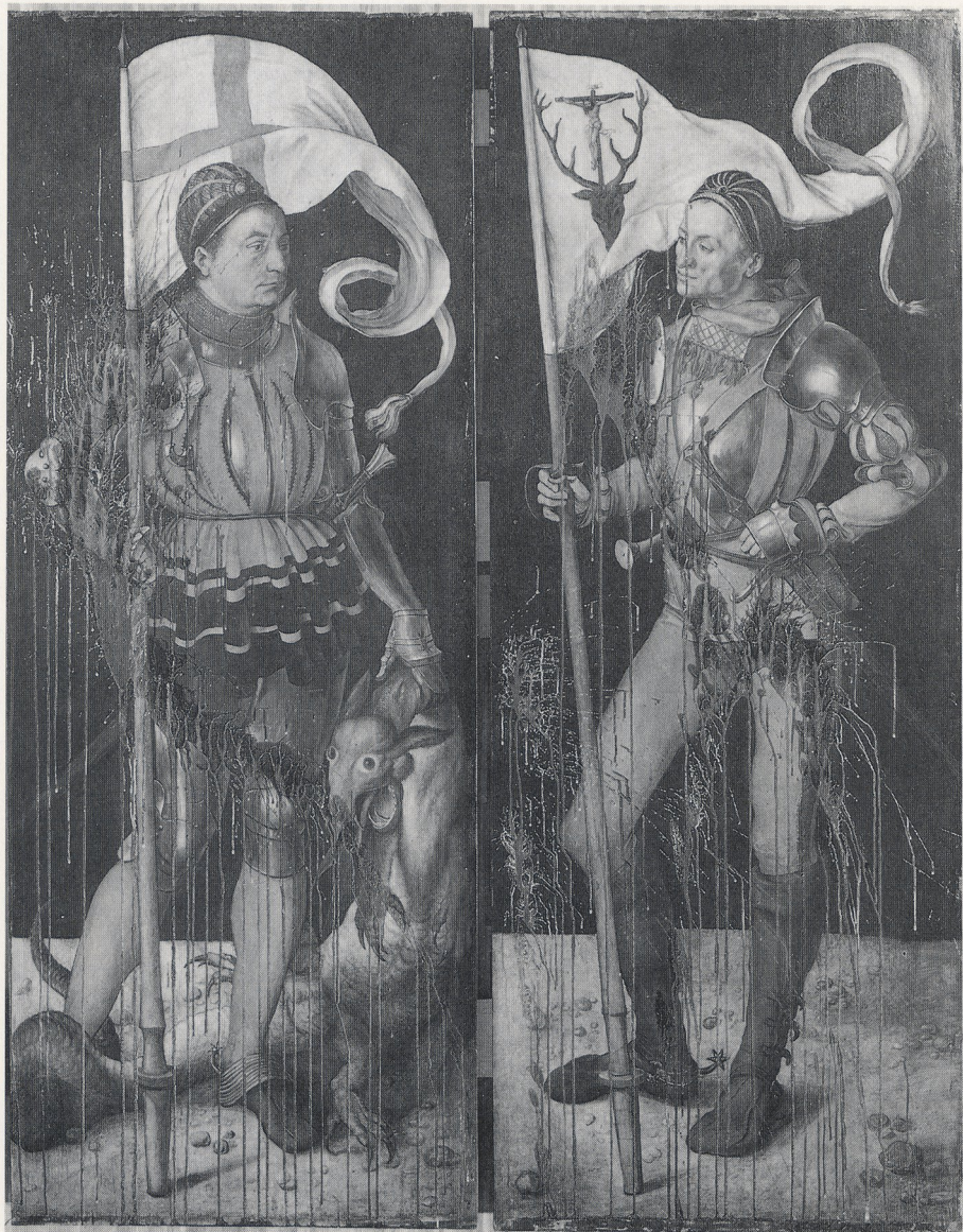
Abb. 2 und 3 Albrecht Dürer, Paumgartner-Altar. Zustand nach der Beschädigung vom 21. 4. 1988 (Museum)

gang, sind die technischen Angaben unvollkommener (ohne Zeichnung der Füße, deren Re- liefen; Lampenabstrahlung wird nicht genügend abgedeckt, sind Dampfang und Lokalisierung)