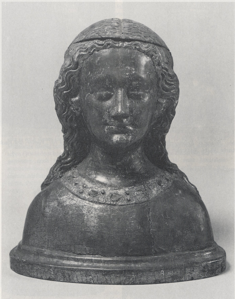
Abb. 7 Reliquienbüste. Köln, Schnütgen-Museum, Inv. Nr. A 103

Abb. 7 und 8 Rückansicht der Reliquienbüste in Torgau, links, und im Schnütgen-Museum, Köln, rechts