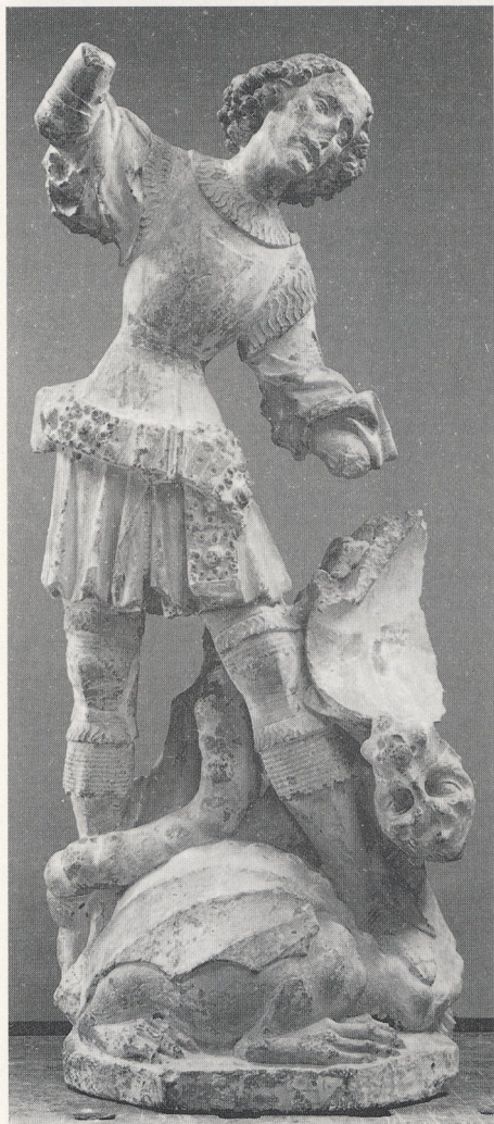
Abb. 5a Hl. Georg aus Großlobming. Wien, Österr. Galerie