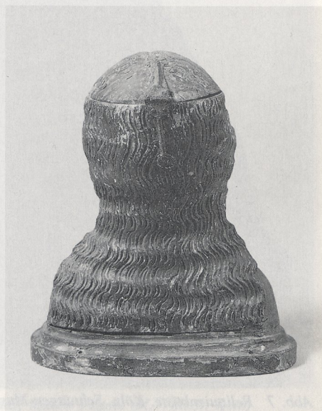
Abb. 8c und d Rückansicht der Reliquienbüsten in Trapani, links, und im Schnütgen-Museum, A 103, rechts