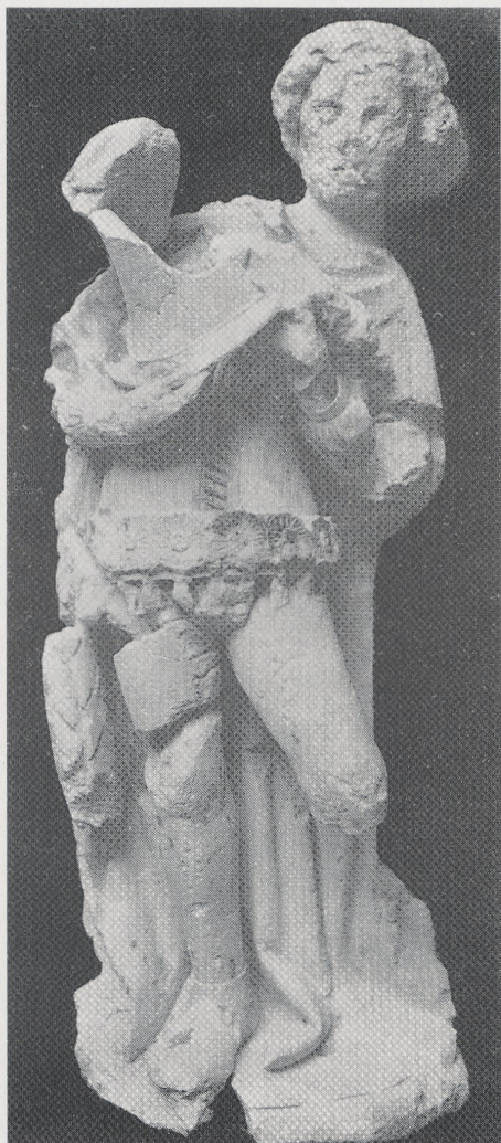
Abb. 4b „Sergent d'armes". Budapest, Historisches Museum (nach M. V. Schwarz, Höf. Skulptur im 14. Jh., Worms 1986, Abb. 162)

Abb. 2 und 3 Albrecht Dürer, Paumgartner-Altar. Zustand nach der Beschädigung vom 21. 4. 1988 (Museum)