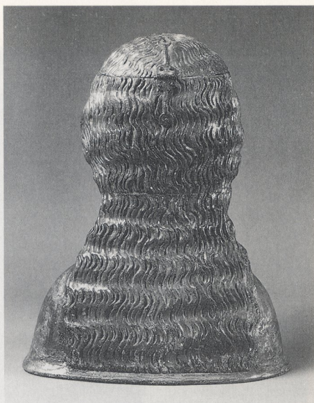
Abb. 8a und b Reliquienbüste. Köln, Schnütgen-Museum, Inv. Nr. A 101, Vorder- und Rückansicht