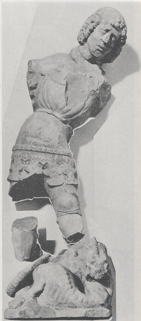
Abb. 5b Hl. Georg, Skulpturenfund der Münsterplattform (1986). Gereinigter und konservierter Zustand (Fotomontage)