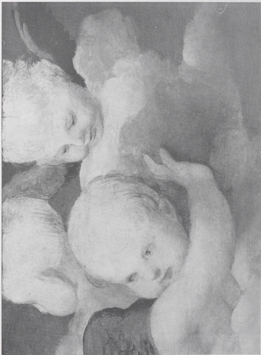
Abb. 2/3 Raphael, Die Hl. Familie aus dem Hause Canigiani. Die freigelegten Puttengruppen nach der Restaurierung