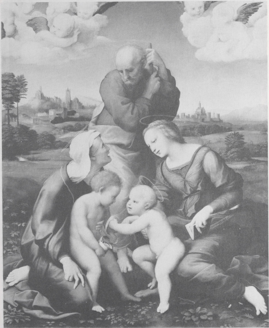
Abb. 1 Raphael, Die Hl. Familie aus dem Hause Canigiani. Zustand nach der Restaurierung. München, Alte Pinakothek