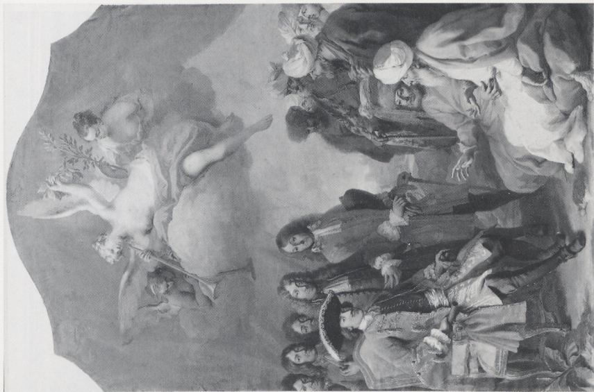
Abb. 10 a und b Jacopo Amigoni, Kurfürst Max Emanuel empfängt eine türkische Gesandtschaft, Skizze und Ausführung. München, Bayer. Staatsgemäldesammlungen (Inv. Nr. 2982 und 2584) (Museum)