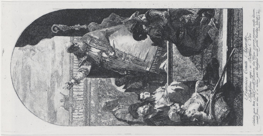
Abb. 5a Domenico Tiepolo after Giambattista Tiepolo, St. Patrick. Etching, 514 : 251 mm. First state. R. 106. 1746.