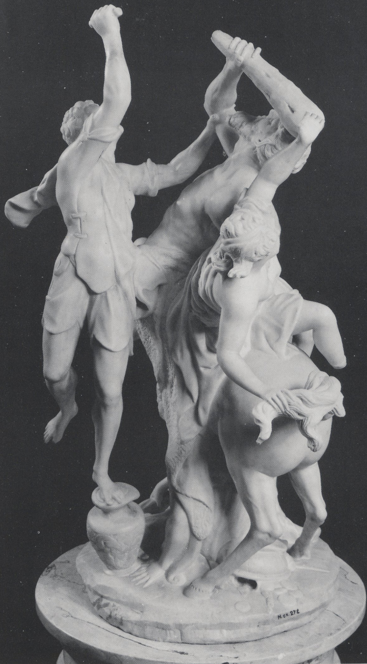
Abb. 1 Francesco Bertos, Kampf der Lapithen und Kentauren. Vor 1722. Marmor, H. 72 cm. St. Petersburg, Ermitage