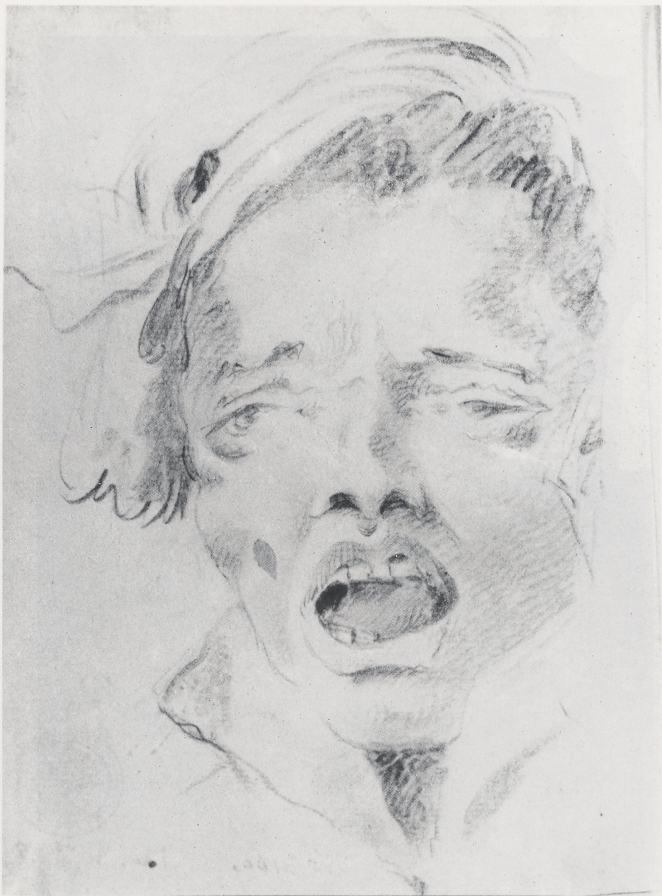
Abb. 9 Domenico Tiepolo, Head of a young man. Black and red chalk and wash. 153 : 111 mm. National Museum Warsaw, Inv. 190771 (Museum)