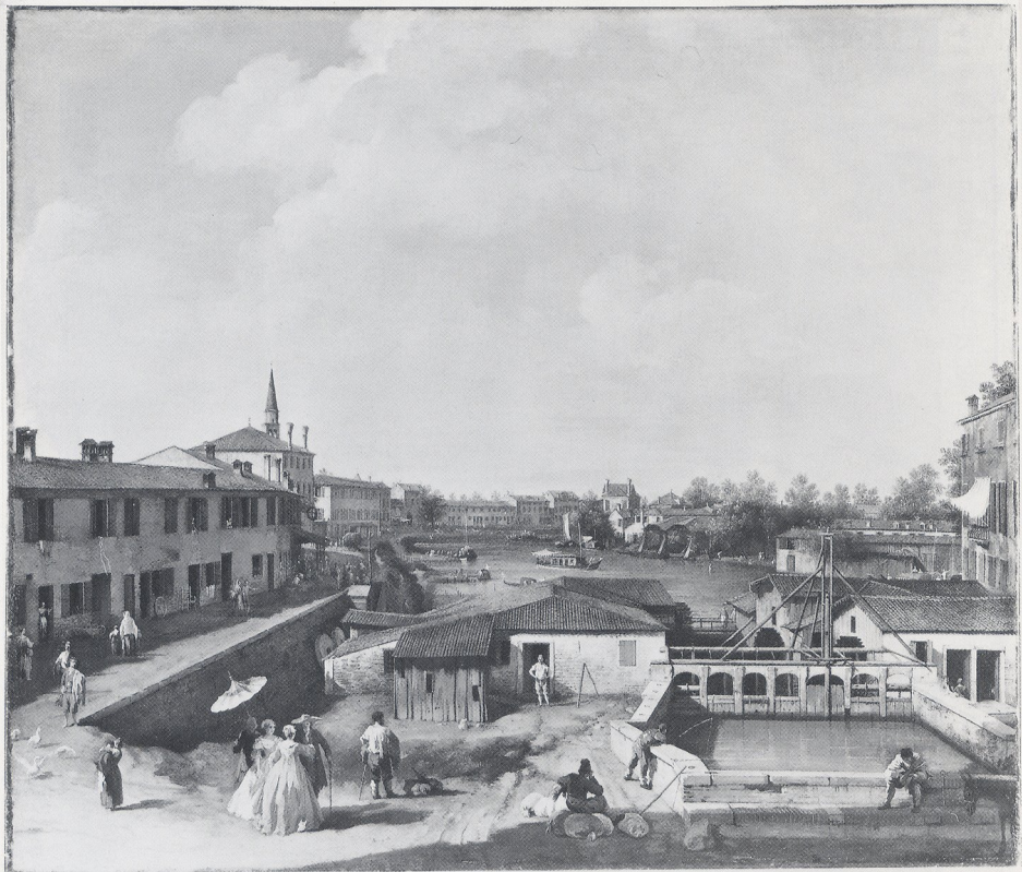
Abb. 12 Canaletto, Die Mühlen von Dolo an der Brenta. Stuttgart, Staatsgalerie (Museum)