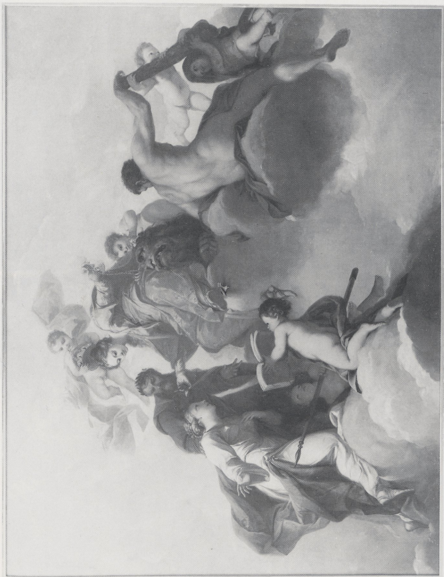
Abb. 11 Antonio Bellucci, Allegorie des wissenschaftlichen Mäzenatentums des Hauses Pfalz-Neuburg. München, Bayer. Staatsgemäldesammlungen (Inv. Nr. 4580) (Museum)