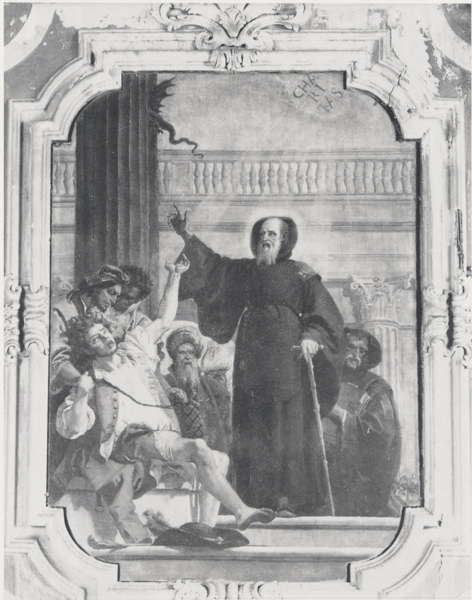
Abb. 7 Domenico Tiepolo, St. Francis of Paola curing a possessed man . Oil on canvas, 330 : 210 cm. 1748. Church of S. Francesco di Paola, Venice