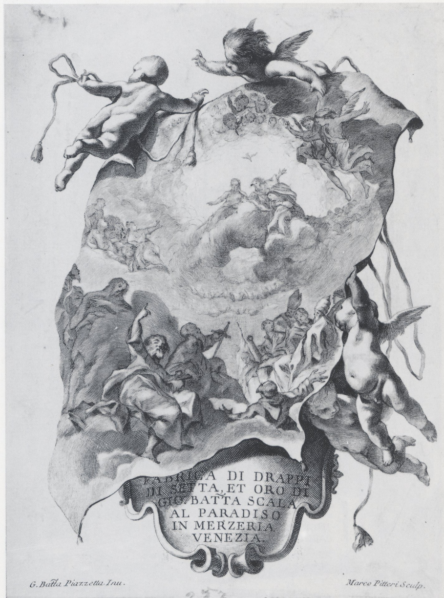
Abb. 16 Marco Pitteri, Werbegraphik für den Händler Giovanni Battista Scala, nach einer Zeichnung von Piazzetta (Venedig, Museo Correr)