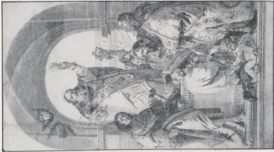
Abb. 5b Attributed to Domenico Tiepolo, SS. Augustine, Louis of France, Magno, and John the Evangelist. Black chalk. 495 : 269 mm. Staatliche Graphische Sammlung, Munich (Museum)