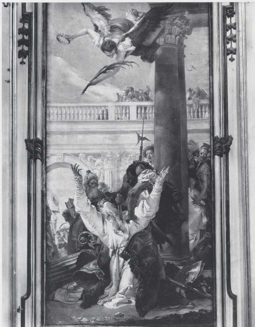
Abb. 8 Giambattista Tiepolo, Martyrdom of St. John, Bishop of Bergamo . Oil on canvas, 600 : 250 cm. 1745. Duomo, Bergamo