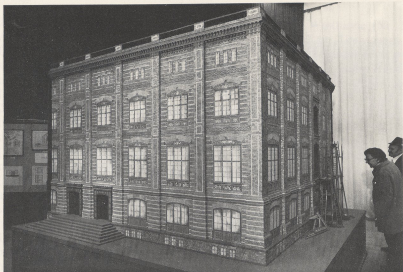
Abb. 2a Berlin, Bauakademie, Teilmodell im Maßstab 1:10, Kat. IV 059. Martin-Gropius-Bau