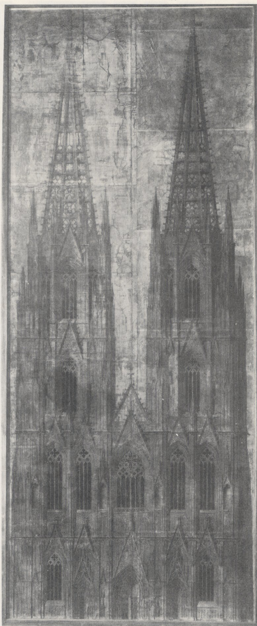
Abb. 4 Karl Friedrich Schinkel, Entwurf zur Vollendung der Westtürme des Kölner Domes, Feder schwarz. Berlin (DDR), Schinkel-Museum, B. 58