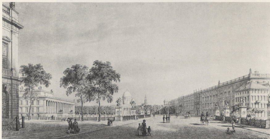
Abb. 3b Karl Friedrich Schinkel, Ansicht des Lustgartens in Berlin, Federzeichnung 1823. Berlin (DDR), Kupferstichkabinett und Sammlung der Zeichnungen