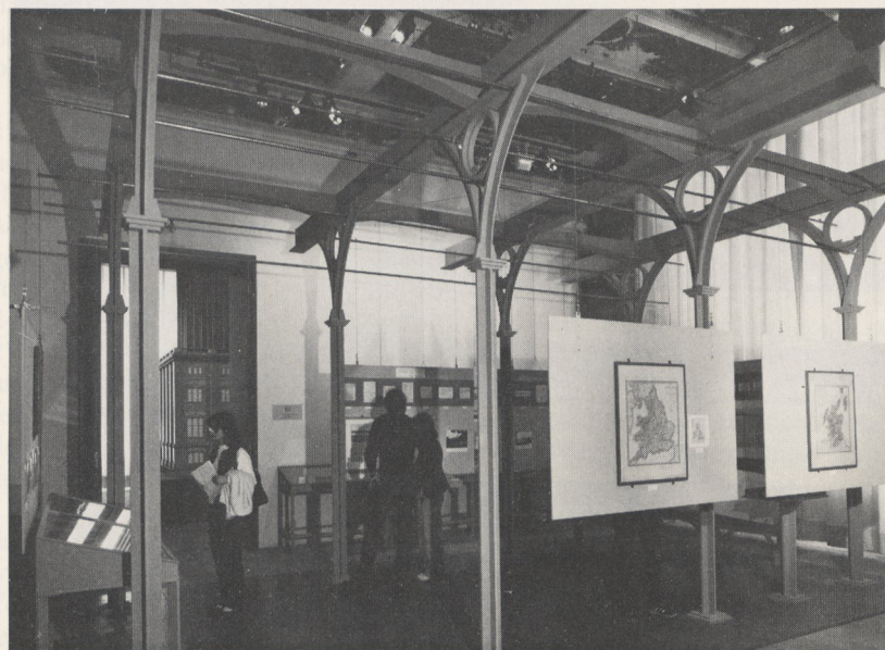
Abb. 2b Eisenkonstruktion der Tuchfabrik von Strout, Modell nach Skizzenblatt Schinkels von der Reise nach England 1826. Martin-Gropius-Bau