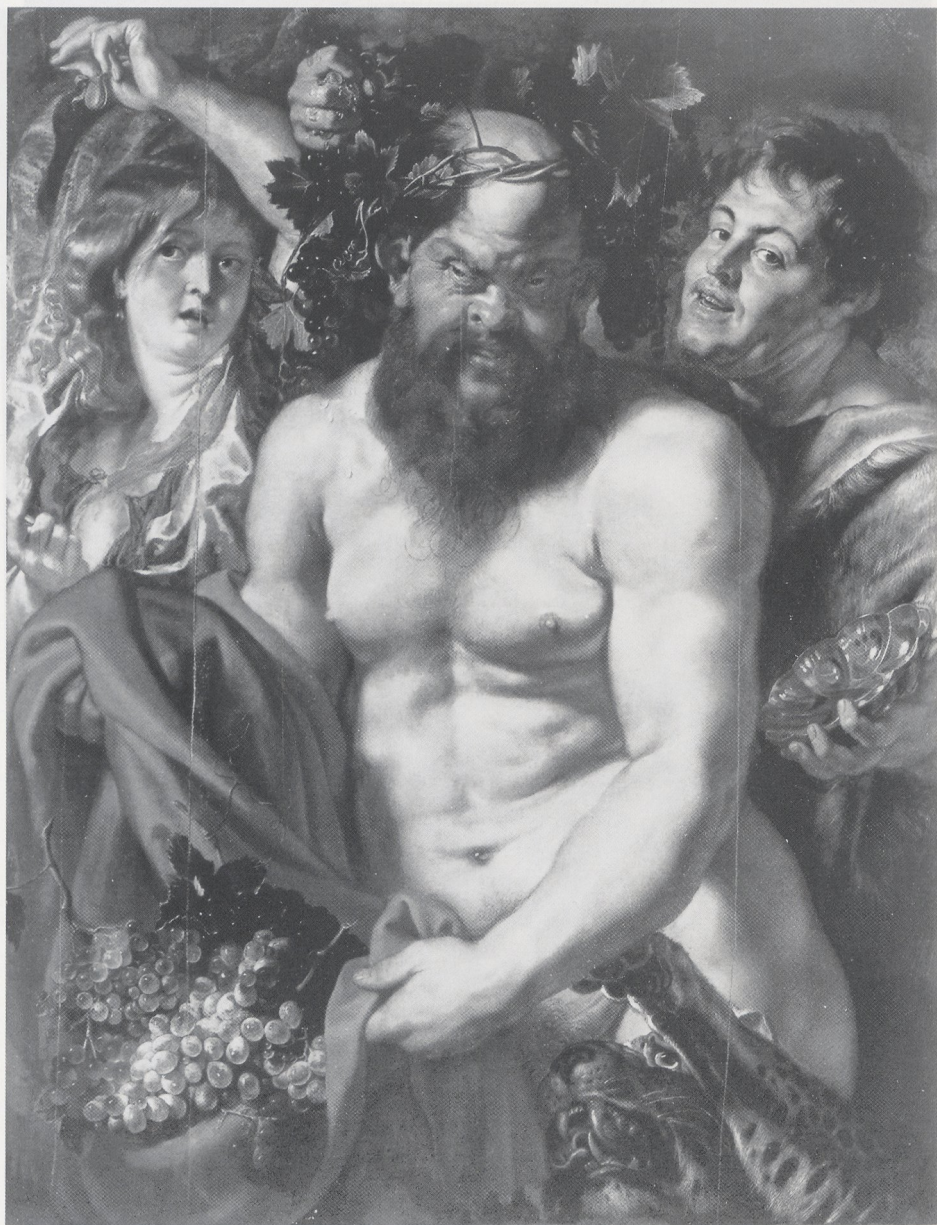
Abb. 6 Rubenswerkstatt (mit Beteiligung von Jordaens?), Silenzzug. Genua, Sammlung Durazzo-Pallavicino