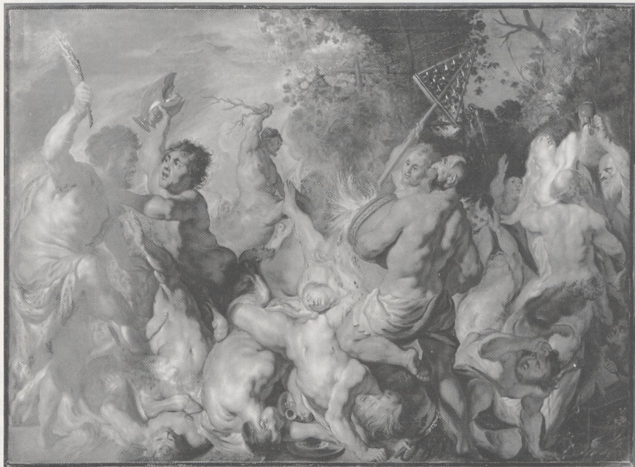
Abb. 7a Jacob Jordaens, Kampf der Lapithen und Kentauren . Cambridge, Fitzwilliam Museum (Museum)