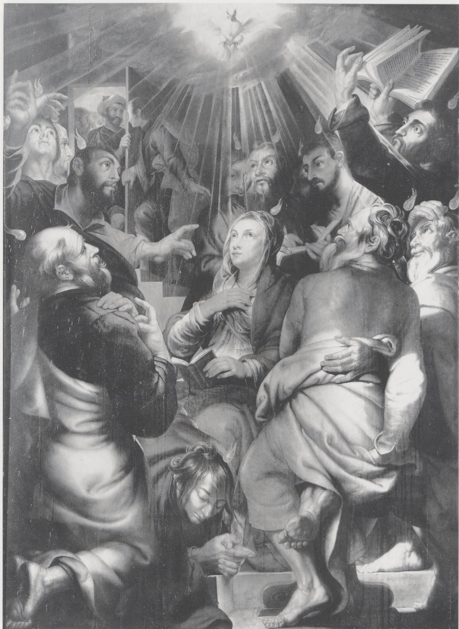
Abb. 5 Matthijs Voet, Das Pfingstwunder. Antwerpen, Paulskirche (ACL 205882.B.)