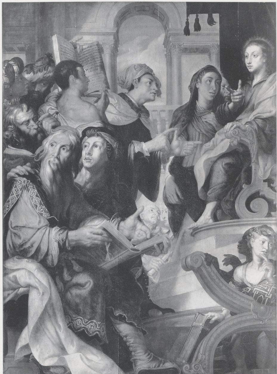
Abb. 4 Matthijs Voet, Christus unter den Schriftgelehrten. Antwerpen, Paulskirche