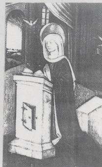
Abb. 1 ehem. Chur, Kathedrale: Gemälde des Kryptenaltars, um 1440/50 (Denkmalpflege Chur)

Abb. 2 ehem. Chur, Kathedrale: Laurentiusaltar, 1543 (Denkmalpflege Chur)