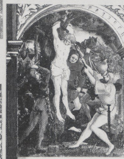
Abb. 3 ehem. Chur, Kathedrale: Laurentiusaltar, 1545 (Denkmalpflege Chur)