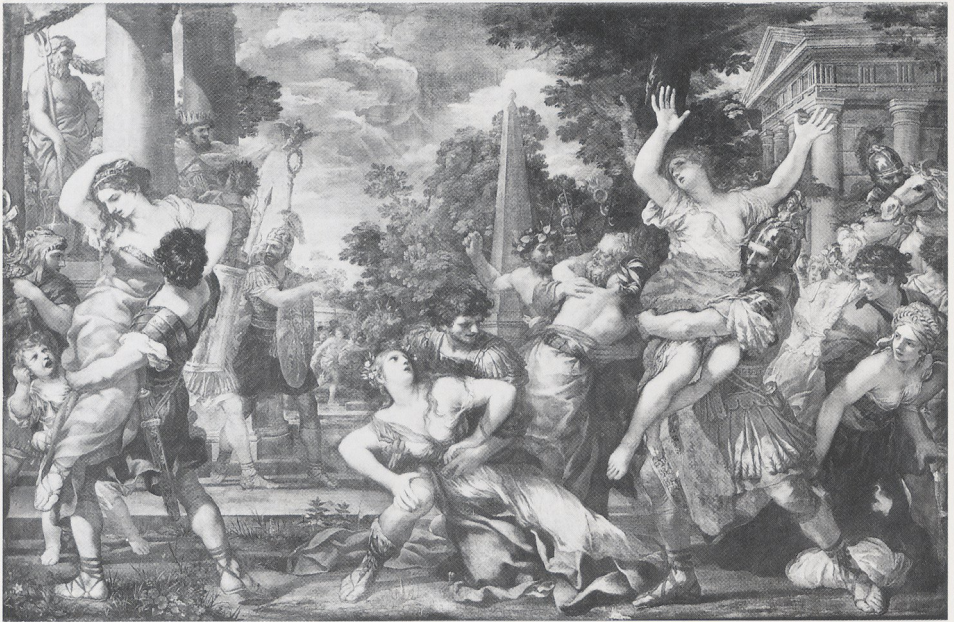
Abb. 4a Pietro da Cortona, Raub der Sabinerinnen. Rom, Pinacoteca Capitolina