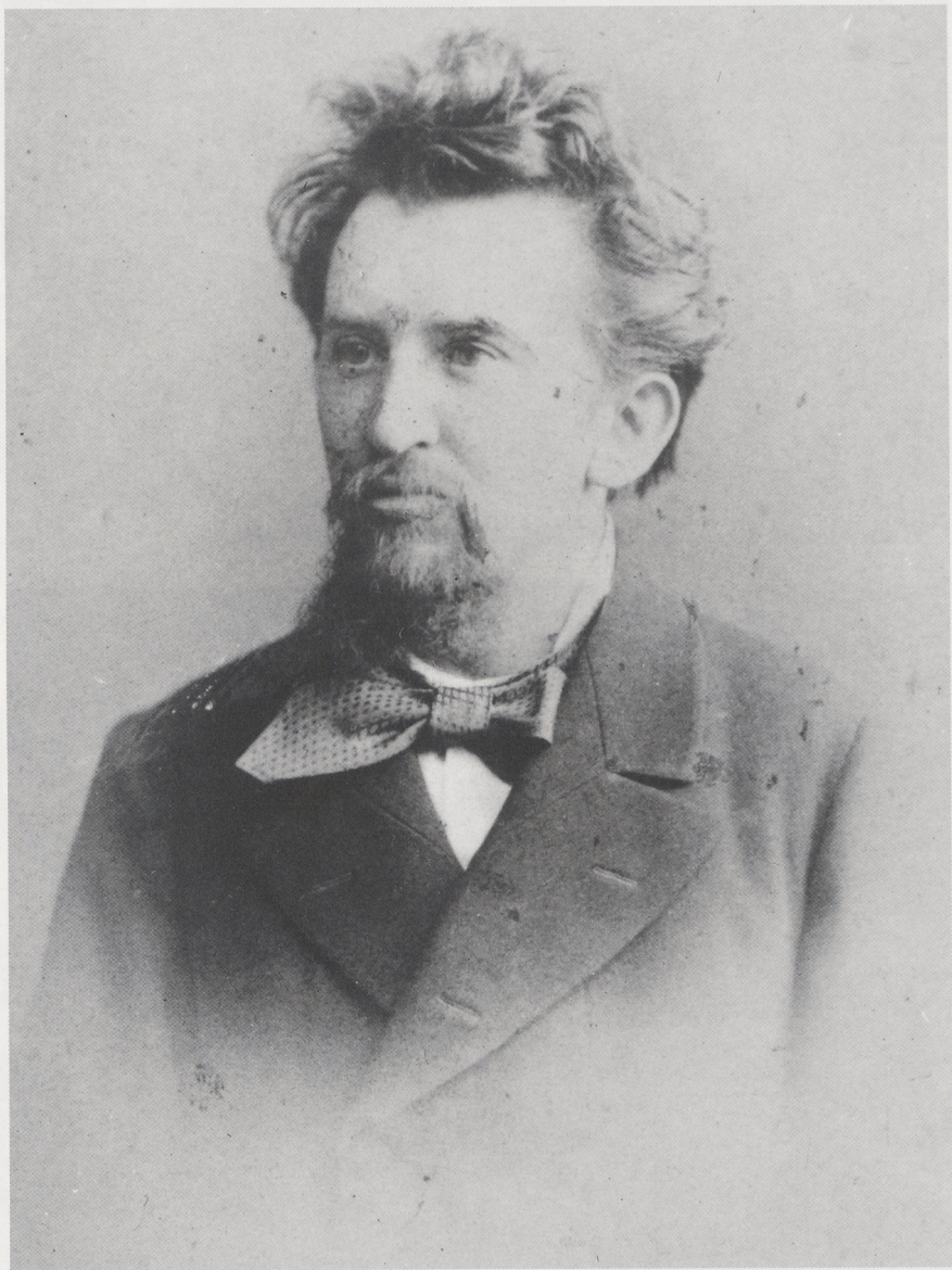
Abb. 1 Hubert Janitschek, Photographie, 1880er Jahre