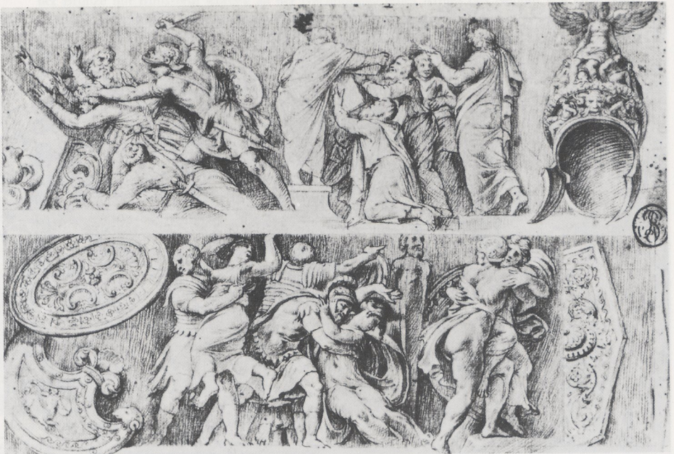
Abb. 3b Galestruzzi (?) nach Polidoro. Paris, Louvre, Cabinet des Dessins, Inv. 6170