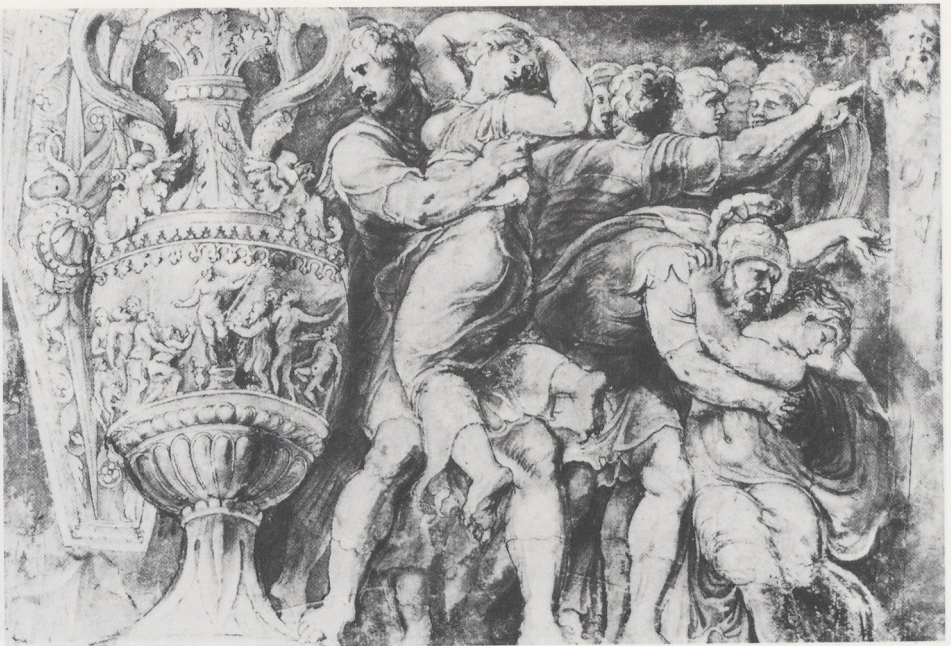
Abb. 3a Rubens nach Polidoro. London, Christie's 30. 11. 1965 (193)