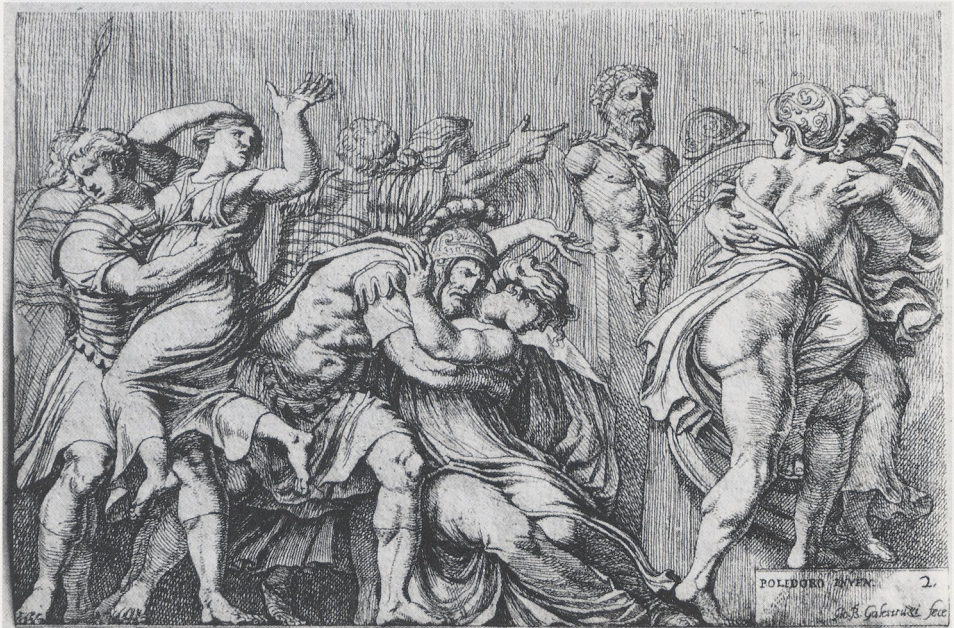
Abb. 4b Galestruzzi nach Polidoros verlorenem Fries am Palazzo Milesi (Bartsch XXI,53,4)