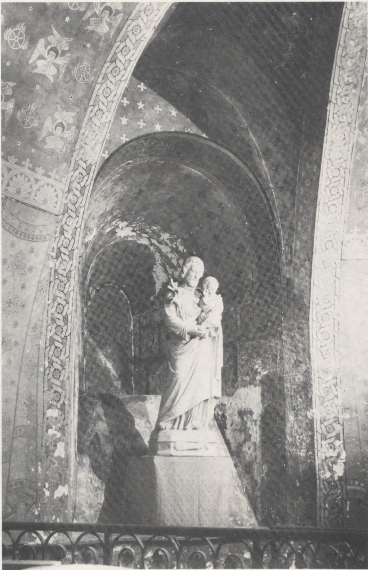
Abb. 3 Chartres, Kathedrale Notre-Dame, Krypta. Nördliche vorgotische Radialkapelle. Das vorromanische Fenster (Aufn.: Schlink)