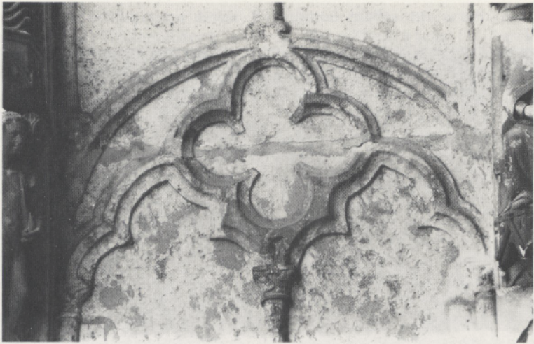
Abb. 2a Chartres, Kathedrale Notre-Dame, Nordquerhausvorhalle. Maßwerkverkleidung der Tonnenwölbung vor dem Mittelportal