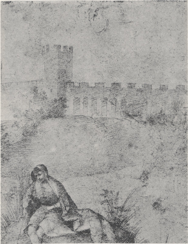
Abb. 1 Giorgione: Sitzende männliche Figur in einer Landschaft mit Stadtmauer (Ausschnitt) . Rotterdam, Museum Boymans-van-Beuningen