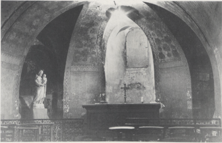
Abb. 2b Chartres, Kathedrale Notre-Dame, Krypta. Nördliche vorgotische Radialkapelle. Links das vorromanische Fenster