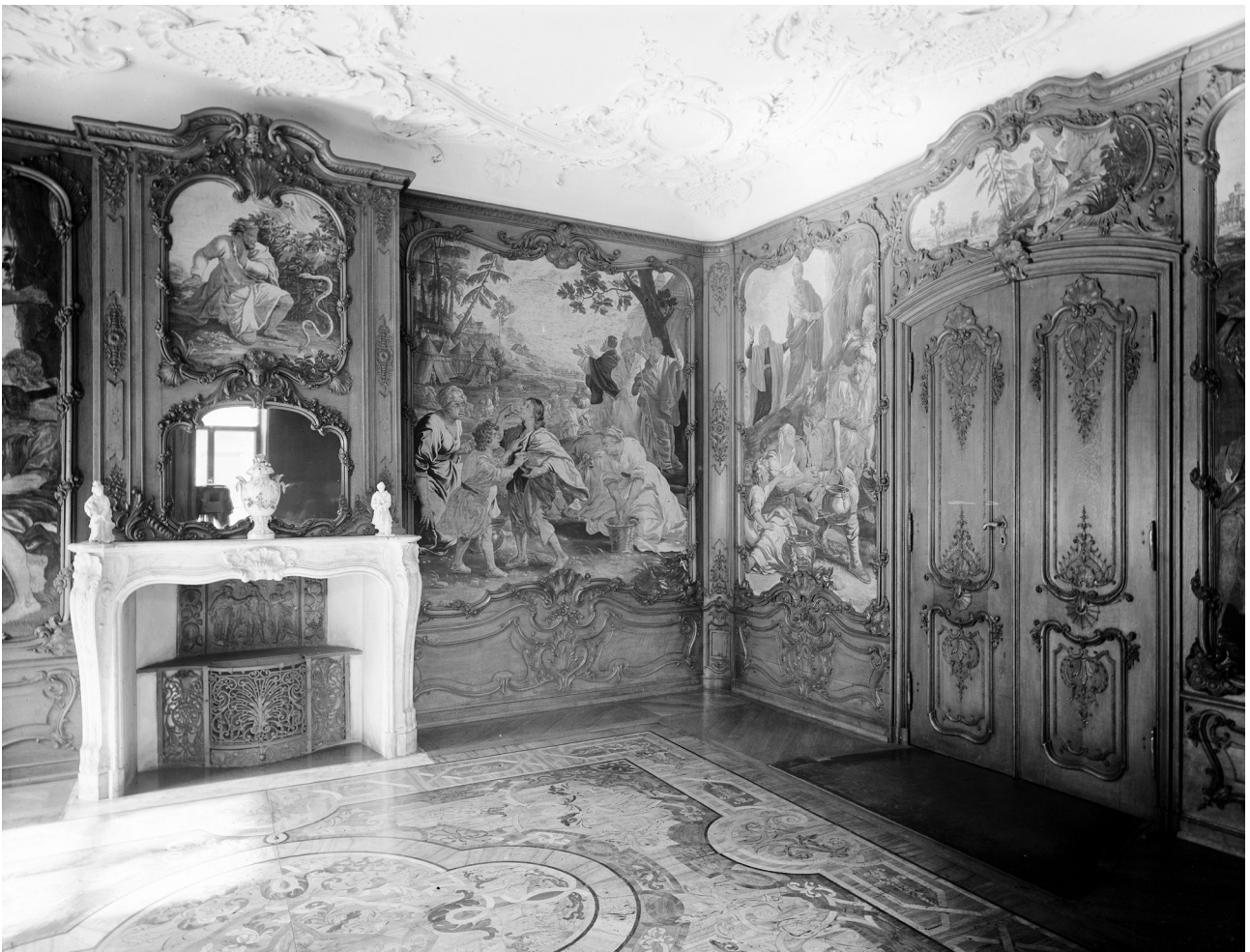
Abb. 5: „Kleiner Gobelinsaal“, Aufstellung im GNM um 1910, Foto: GNM, Sign. A 3417.

Von der Raumvertäfelung tauchten etwa zwei Drittel in den 1950er Jahre noch einmal auf. Ab jener Zeit wurden sie, wenn auch in falscher Gruppierung und mit äußerst umfangreichen, selbst die Tapisserien betreffenden Ergänzungen, in der Kunstgewerbeabteilung der Legion of Honor in San Francisco gezeigt. Dorthin waren sie über einen New Yorker Kunsthändler gelangt, der die Wandverkleidung seinerseits von einem deutschen Flüchtling erworben hatte. Leider sind sie heute nicht mehr in öffentlichem Besitz, denn als das Museum sie 1999 versteigern ließ, bekam