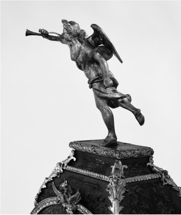
Abb. 8: Figur der Fama als Bekrönung der Kaminuhr HG 13572.

ähnliche Darstellungen von einem tuchumwehten Putto mit Blumenkorb in der Linken und zum Kopf geführter Rosenblüte in der Rechten aus französischer Uhrenproduktion bekannt sind (also so, wie er am unteren Rand des Uhr-glasses appliziert ist), gibt die deckungsgleiche Kombination von mehreren Einzelementen einen Hinweis auf eine Herstellung in Deutschland. Zumindest lässt dies die exakte Übereinstimmung mit einer ebenfalls gut 70 cm großen, im September 2016 im Auktionshaus Königstein verkauften Boulle-Uhr vermuten, die auf der mit „IV“ beschrifteten Emaillekartusche im Zifferblatt mit dem Namen „Conrad Felsing“ signiert ist. Und soweit der reine Bildvergleich es zulässt, scheinen die vergoldeten Applikationen beider Kaminuhren sogar derselben Gussform zu entstammen – die vegetabil ausgeformten Füße, die unteren Eckbeschläge, die kräftigen Schulterstücke, die Rahmung der vorderseitigen Verglasung, der oben erwähnte Putto mit den Blumen, eine Blattkartusche am Fuß des Aufsatzes, vor allem aber auch die mit Trompete und (beim Nürnberger Stück fehlendem) Lorbeerzweig ausgestattete Ruhmesgöttin sowie das reliefierte Zifferblatt. Selbst die markanten, weißen Emaillekartuschen in letzterem unterscheiden sich lediglich in der Farbwahl für die römischen Zahlen, die mal in Schwarz (Auktionshaus), mal in Blau (Nürnberg) ausgeführt sind.