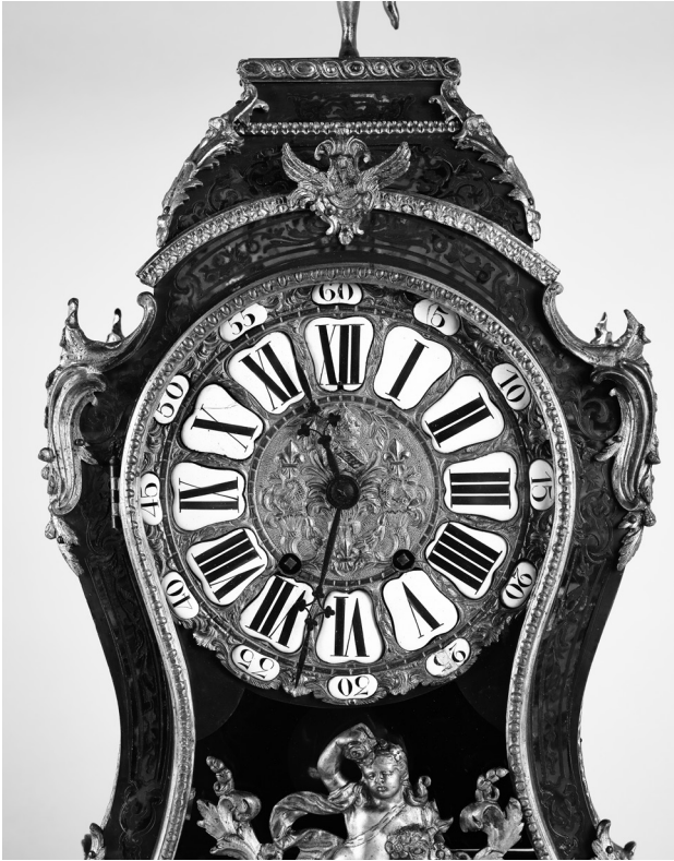
Abb. 7: Kaminuhr mit Boulle-Marketerie, HG 13572, Detail.

Eva Reinstädler selbst hatte die Pendule ihrer Vorfahren bis zuletzt in Ehren gehalten. Dennoch war das Stück in einem fragilen Zustand als es Ende 2021 ins Museum kam. Als erstes musste ein Restaurierungsatelier gefunden werden, das mit derartigen Objekten Erfahrung hatte und zeitnah die notwendigen Reinigungs-, Sicherungs- und Festigungsarbeiten durchführen konnte. Nach der Ausschreibung der Maßnahme ging der Zuschlag an die Restauratorin Maja Friesenecker, eine junge Kollegin in der Nähe von Braunschweig.