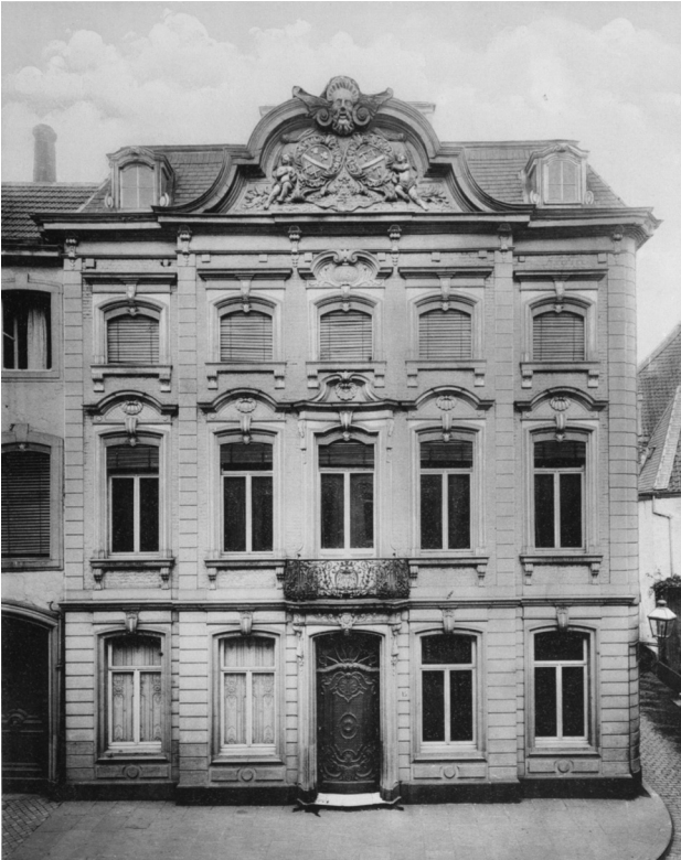
Abb.2: Fassade des von Wespian'schen Hauses, Aachen, 1735–1737. In: Schmid 1900, Taf. 2, Sign. 2° K liegend 563gc.

des Fabrikanten gelangt war. Das bis dato auf dem Grundstück befindliche Gebäude (Cloubert-Haus) wurde zugunsten eines äußerst repräsentativen Bürgerhauses (Abb. 2) abgerissen, bei dem Couven das erste und einzige Mal in seiner Laufbahn einen kompletten Wohnhausneubau nach