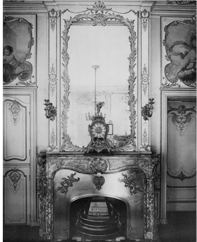
Abb. 6: Kaminwand im Speisezimmer des von Wespian'schen Hauses. In: Schmid 1900, Taf. 41.