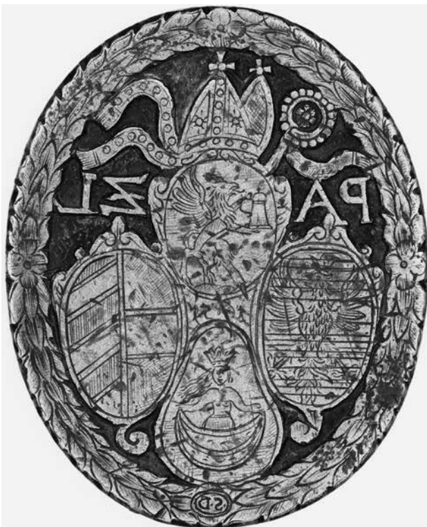
2.) Buchbinderstempel, Österreich (?), 17. Jh.; Messing, geschnitten; Inv.-Nr. Z 2678.

Die durch ein geviertes Wappenfeld charakterisierte – 5,3 cm lange, 4,1 cm breite und 1,3 cm starke – Stempelplatte erscheint im Unterschied zu den drei vorangegangenen