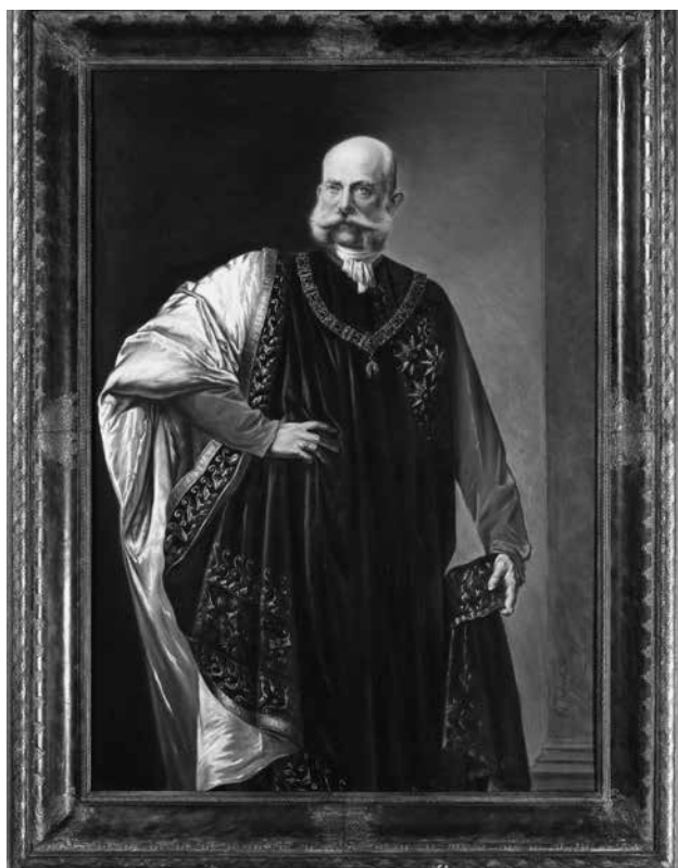
Abb. 1: Friedrich v. Thelen-Rüden (1836–1900), Kaiser Franz Joseph I. als Souverän des Ordens vom Goldenen Vlies, 1896. Signiert und datiert unten rechts „F. v. Thelen-Rüden 1896“. Rückseitig zwischen Rahmen und Leinwand eingesteckter Kartonstreifen mit Beschriftung in brauner Tusche „Kaiser Franz Joseph von Oesterreich, König von Ungarn, im Ornat des ‚Souverainen Ordens vom Goldenen Vliess‘ (sic). 1896 nach dem Leben gemalt von F. von Thelen-Rüden-Wien“; weitere Beschriftungen. Öl auf Leinwand, ohne Rahmen H. 150 cm, B. 100 cm, mit Originalrahmen H. 169,5 cm, B. 128 cm, T. 13 cm; Rahmen profiliert, mit Leder bezogen, braun patiniert und mit geprägtem, vergoldetem Dekor. Inv.-Nr. Gm 2391. Geschenk von Konrad Adenauer, Köln.

Die rückseitige Beschriftung des Porträts vermerkt, Thelen-Rüden habe es „1896 nach dem Leben gemalt“, was sich allerdings nur auf das Antlitz beziehen kann. Angelina Pötschner danke ich für den Hinweis, dass es sich bei dem Bild um eine Teilkopie des ganzfigurigen Kaiserporträts handelt, das Heinrich v. Angeli (1840–1925) 1883 im Auftrag