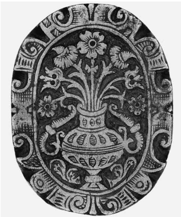
4.) Andere Seite von Inv.-Nr. Z 2680.

Literatur: Thomas Schindler, Werkzeug der Frühneuzeit im Germanischen Nationalmuseum. Bestandskatalog Nürnberg 2013 , S. 99–101. Konrad von Rabenau: Erfurter Buchbinder im 16. Jahrhundert . In: Ulman Weiß (Hrsg.): Erfurt – Geschichte und Gegenwart (= Schriften des Vereins für die Geschichte und Altertumskunde von Erfurt, 2) . Erfurt 1995. – Lexikon der grafischen Technik . Bearbeitet im Institut für grafische Techniken Leipzig. 7. Auflage. Leipzig 1986. – Gustav Moessner: Buchbinder ABC . Bearb. Von Hans Kriechel. Bühl 1981.