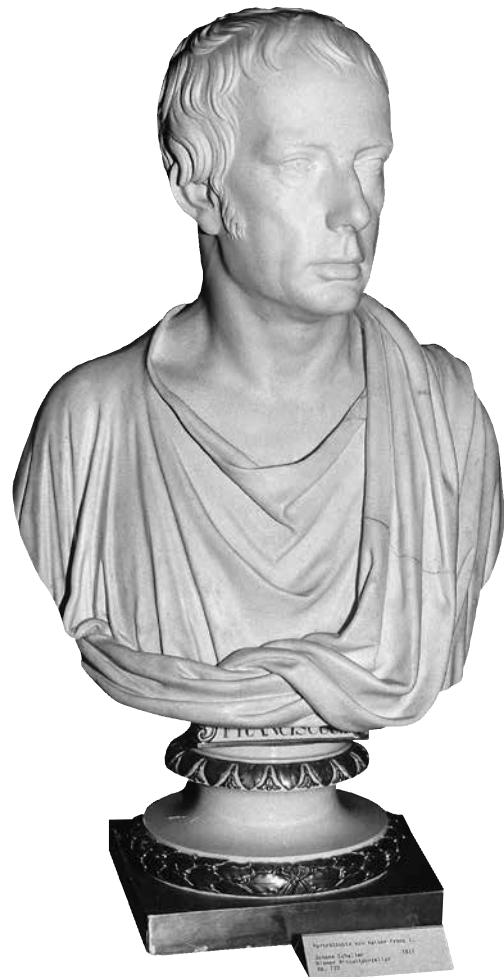
Abb. 3: Johann Nepomuk Schaller (Wien 1777–1842 Wien), Büste Kaisers Franz II./I., 1811. Wiener Porzellanmanufaktur. Bezeichnet „FRANCISCUS I.“, rückseitig „Joh. Schaller, Fecit 1811“, Bisquitporzellan, H. 63 cm (ohne Sockel). Inv.-Nr. Ke 722. Alter Bestand.

Im GNM lenkt das Porträt des Habsburgerkaisers den Blick auf das Heilige Römische Reich, für das im späteren 15. Jahrhundert der Zusatz „deutscher Nation“ aufkam. Die Habsburger hatten seit dem 15. Jahrhundert bis auf das kurze Wittelsbacher-Zwischenspiel 1742 bis 1745 mit Karl VII. (1697–1745) durchgehend die Krone des Alten Reichs innegehabt. Deren letzter Träger, Kaiser Franz II., der Großvater des von Thelen-Rüden porträtierten Franz Joseph I., hatte 1804 als Reaktion auf Napoleons Krönung zum Kaiser