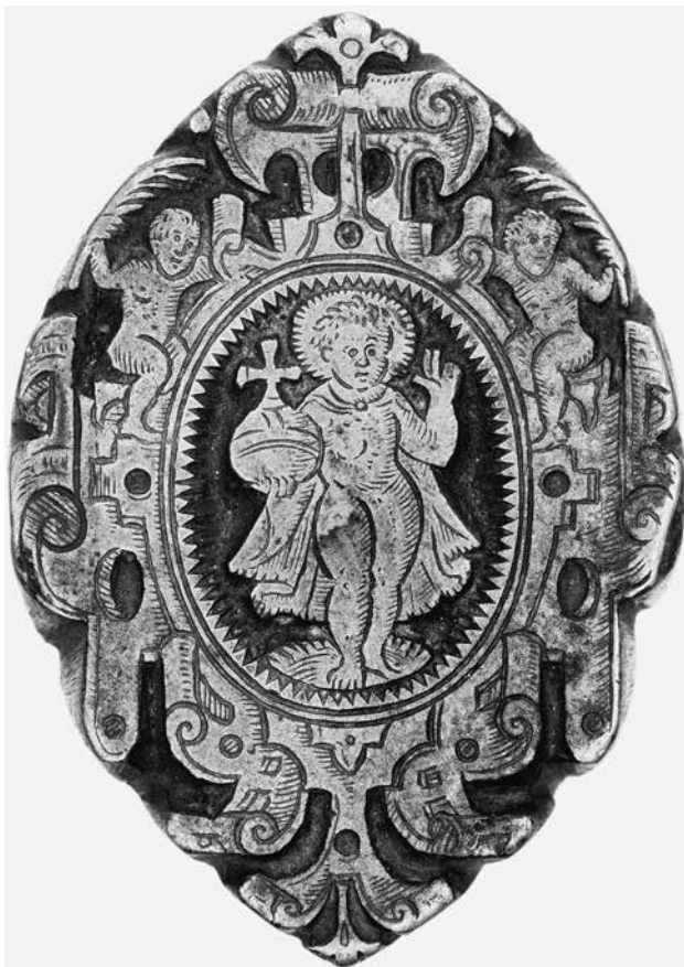
1.) Buchbinderstempel, Süddeutschland (?), 17. Jh. (?); Messing, geschnitten; Inv.-Nr. Z 2679.

Das Germanische Nationalmuseum sammelte bereits im 19. Jahrhundert und frühen 20. Jahrhundert mehr oder weniger systematisch frühneuzeitliche Prägwerkzeuge (Abb. 1). Im Zuge dieser Bemühungen wurden in geringem Umfang auch zwölf Buchbinderstempel erworben. Nachzuvollziehen sind drei Erwerbsakte –, 1879, 1893 und 1901 – die sich eventuell auf die vorliegenden vier Stempel beziehen könnten, da jeweils vier Stempel gleichzeitig in die Sammlung gelangten. 1879 wurden dem Zugangsregister zufolge von Antiquar Probst, Nürnberg, vier Stempel des „18.-19. Jhdt.“ gekauft. Da keine weiteren Informationen vorliegen, so zu Stempelmateriale oder Prägemoativen, kann für die vorliegende Fragestellung lediglich die Datierung einen Anhaltspunkt liefern. Folgt man dieser, können die vier hier besprochenen Stempel nicht gemeint gewesen sein. 1893 erwarb das Museum von Antiquar Klein, Poppenlauer, Teil der Marktgemeinde Maßbach im Landkreis Bad Kissingen, ebenfalls „4 Buchbinderstempel u. 3 Model zum Pressen von Ledertapeten“. Während die hölzernen Model im Bestand der handwerksgeschichtlichen Sammlung eindeutig zu identifizieren sind, gilt für die Buchbinderstempel Gleiches wie 1879 – sie kommen aufgrund