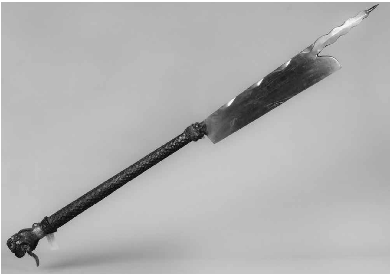
Abb. 1: „Streitaxt“ bzw. „Zunftgerät“ oder „Ceremonialbeil“, 19. Jh. (?); Eisen, geschmiedet, Holz, geschnitzt; Inv.-Nr. Z 2122.

Der ca. 160 cm lange und aus zwei Hälften gefügte Stangenkorpus mit kreisrundem Querschnitt, dergenannte Schaft, ist komplett mit reliefiertem Schuppendekor versehen. Die einzelnen Schuppen überlappen leicht, was dem Schaft eine hautartige Anmutung verleiht. Das untere Ende des Schafts ist als stilisierter Raubtierkopf ausgearbeitet (Abb. 2). Dem Altinventareintrag nach handelt es sich hier-