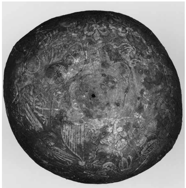
Abb. 4: Innenansicht mit Achsloch, WI 111.