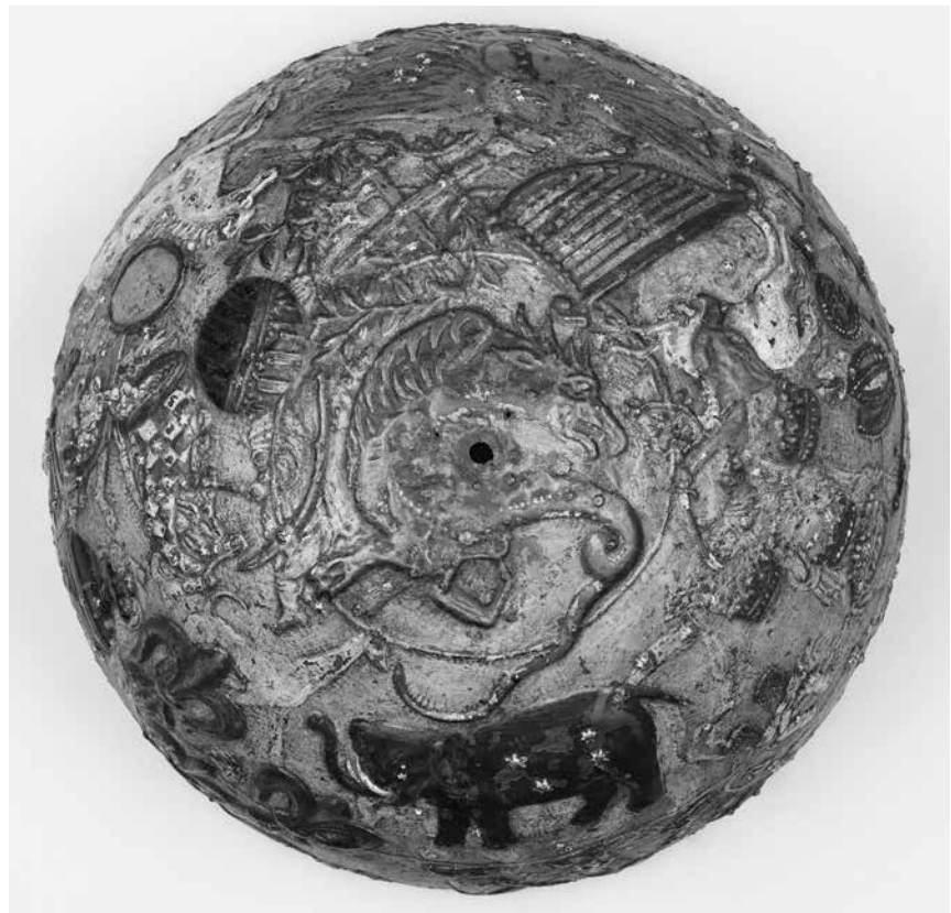
Abb. 2: Aufsicht des Globus mit Sternbild Der Lindwurm (Großfürstentum Moskau) mit Achsloch, umgeben vom nördlichen Parallelkreis zur Ekliptik, WI 111.

Weiter sind zwei zur Schnittebene parallel liegende, getriebene Kleinkreise zu erkennen, die sich leicht über die Kugeloberfläche erheben. Der in einem Winkel von etwa 23^\circ zur Schnittebene gelegene südlichere Kleinkreis entspricht dem Kreis, der den Großkreis des Himmelsäquators auf der Himmelskugel tangiert. Der nördlichere Kleinkreis hingegen wird durch die sich über Jahrtausende vollziehende Wanderung der Erdachse durch den Sternenhimmel beschrieben, die sogenannte Präzession. Die Kugeloberfläche weist die Struktur eines Doppelreliefs auf. Durch Treib- und Ziselierarbeit wurden die klassischen wie die heraldischen Sternbilder herausgearbeitet, wobei sich die weigelschen deutlich über die klassischen erheben und diese dem Augenschein nach überdecken. Dadurch bleiben Teile der klassischen Sternbildardarstellungen noch zu erkennen, wie etwa Kopf und Tatzen des Großen Bären (Abb. 3), stehen aber dennoch hinter der optischen Dominanz der neu eingeführten zurück. Insgesamt 29 heraldische Sternbilder lassen sich ausmachen, teils am Kugeläquator durchschnitten. Als kleine Buckel treten die Sterne gemäß dem Grad ihrer scheinbaren Helligkeit hervor: je heller der Stern am Firmament, desto ausgeprägter die Erhebung auf dem Globus. Die Buckel der lichtstärksten Gestirne sind