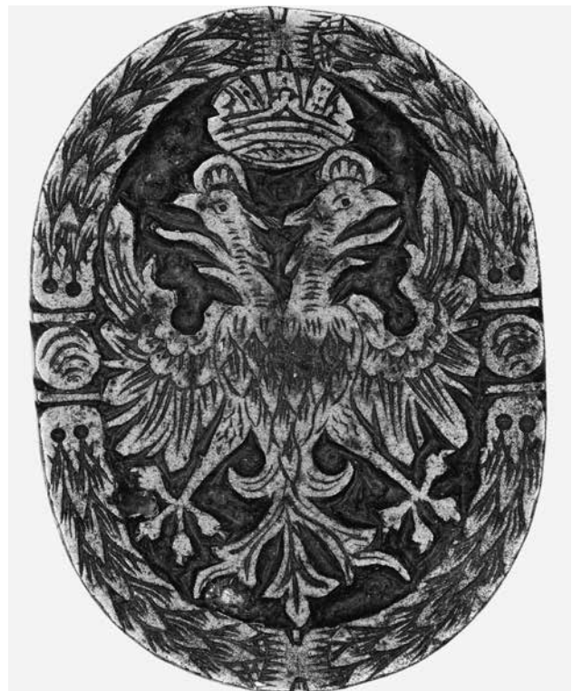
3.) Buchbinderstempel, Süddeutschland (?), 17. Jh. (?); Messing, geschnitten; Inv.-Nr. Z 2680.