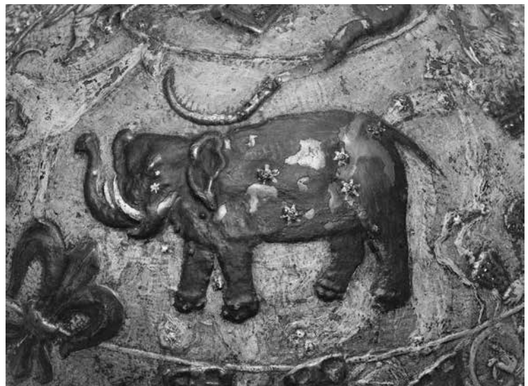
Abb. 3: Detail mit Der Elephant (Königreich Dänemark), WI 111. Deutlich sind die sieben Sterne des Großen Wagens zu erkennen.

bus durch technische Einrichtungen vor Ungenauigkeiten bewahrte, die infolge der Präzession der Erdachse entstehen und einen Himmelsglobus über Jahrhunderte unbrauchbar werden lassen. Der Anspruch weist aber über diese reine Funktion der Präzessionskorrektur hinaus. Im Extract aus der Himmels=Kunst , ein Jahr vor Weigels Tod erschienen, entwirft er das Bild des Menschen als Mathematiker, Astronom und Rechenkünstler, der die von Gott