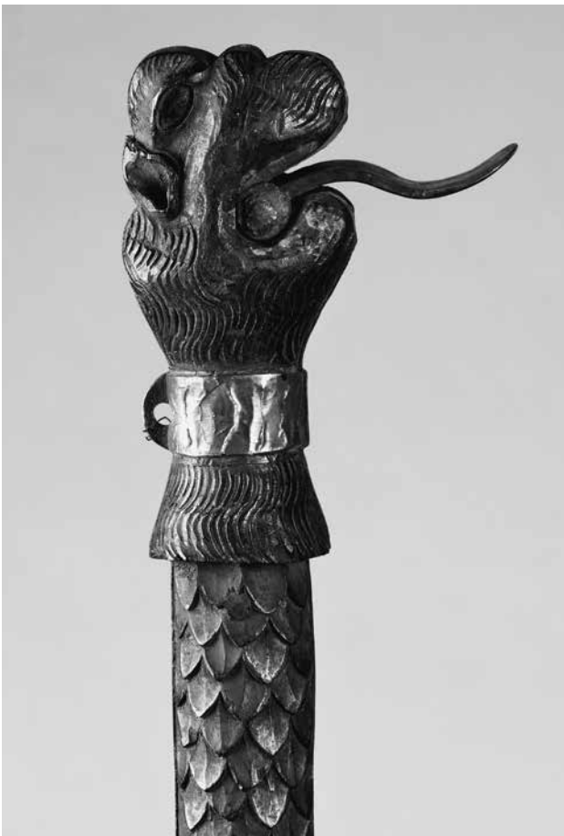
Abb. 2: Schaftende der „Streitaxt“ bzw. des „Zunftgeräts“ oder „Ceremonialbeils“.

bei um das Haupt eines „Löwen“. Die flächig ausgeführte Schnitzarbeit auf dessen Oberfläche deutet zwar auch Fell an, doch ist eine Mähne oder deren Ansatz als zoologisches Indiz auf einen Löwen nicht auszumachen. Zudem wirkt der Kopf nicht unbedingt katzenhaft, eher kompakt-rechteckig. Die Einschätzung im Altinventar beruht wahrscheinlich auf der kursorischen Beobachtung des Löwenkopfs als weit verbreitetes Schmuckelement aller möglichen Geräte und in ebenso vielen thematischen Zusammenhängen: Dieser findet sich seit dem Spätmittelalter selbst bei Taufbeckenfüßen, Waffen oder Arbeitsgeräten wie Ambossen. Verwirrend erscheint demgegenüber allerdings die Kombination eines Löwenhauptes mit dem geschuppten Schaft, soweit diese überhaupt miteinander korrespondieren sollten. Denkbar wäre hier auch eine Deutung des Kopfs als der eines Drachen oder Fisches bzw. Delfins. Weiterhin erscheint durchaus möglich, den Tierkopf als Brackenhaupt zu deuten, also als einen heraldischen Hundskopf. Das markanteste Merkmal des Kopfs ist sicherlich das überdimensionale, mit aufgemalten spitzen Zähnen besetzte Maul, aus dem der „Löwe“ seine ebenso übergroße messingene Zunge streckt. Die Zunge ist mittels eines quer zur Schaftichtung eingesetzten Niets befestigt, der zugleich die beiden Schaf-