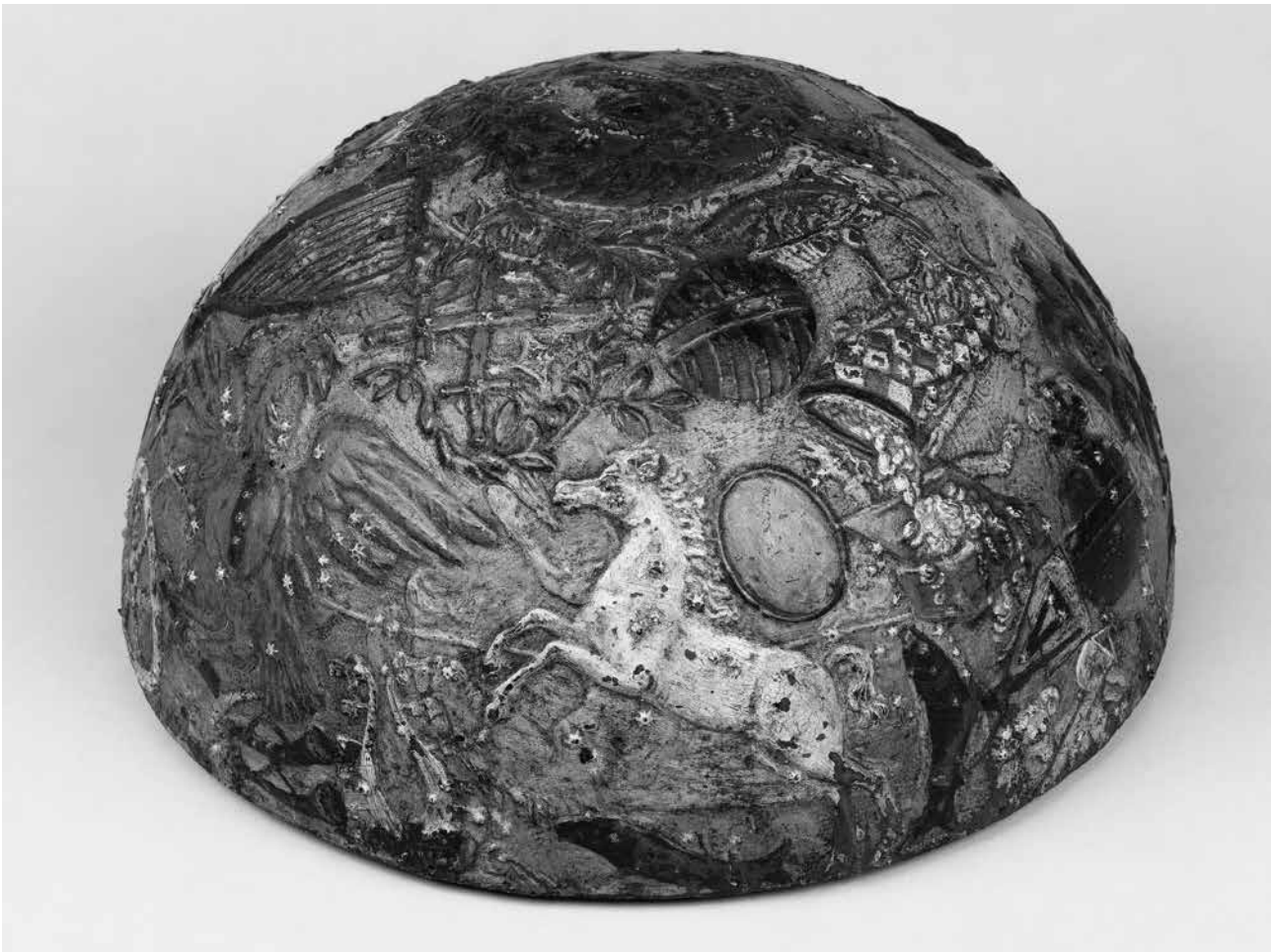
Abb. 1: Fragment eines Himmelsglobus (nördliche Halbkugel), Entwurf: Erhard Weigel, Ausführung: unbekannt, Nürnberg (?), um 1690, Kupfer, getrieben, ziseliert, punziert, bemalt, Durchmesser 36 cm, Stärke 0,5 mm, WI 111. Leere Signaturkartusche. Abgebildete Sternbilder, von links: Die Harffe (Königreich England), Der Scepter=führende Adler (Kurfürstentum Brandenburg), Der Rauten=Crantz und zwey Schwerdt (Kurfürstentum Sachsen), Zweene Fische (Fürstentum Württemberg), Das Fruchthorn (Kurpfalz), Das Schatzkästlein (Kurfürstentum Heidelberg).

Der Mathematikprofessor, Astronom und Pädagoge Erhard Weigel (1625–1699) unternahm bei der Konzeption seiner Globen eine Reihe von Reformversuchen, von denen einer gerade in der Erleichterung dieses Perspektivwechsels bestand. Indem Weigel Globen mit Einblicksöffnungen