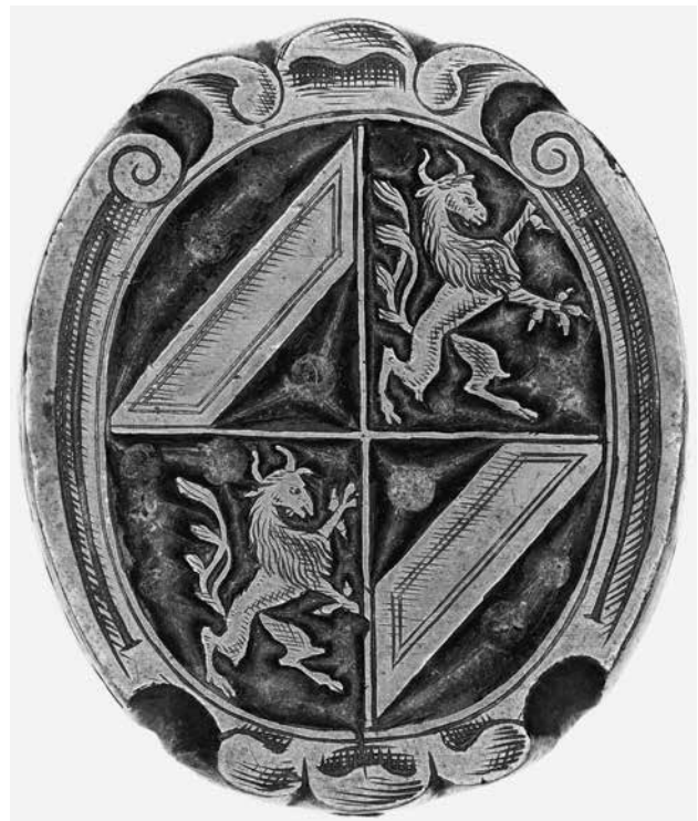
5.) Buchbinderstempel, Nürnberg, 18. Jh. (?); Messing, geschnitten; Inv.-Nr. Z 2675.