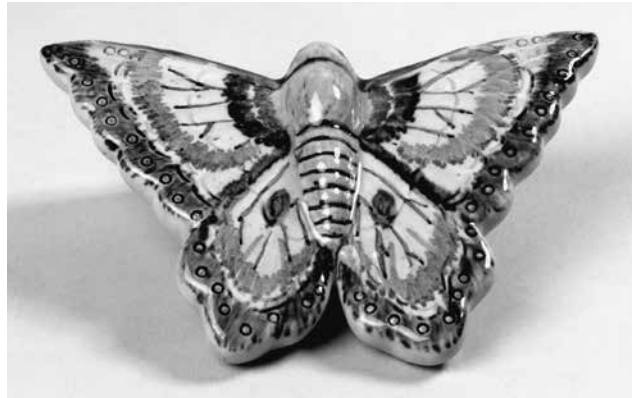
Abb. 1: Schmetterling-Vase, 1. Hälfte 20. Jh., Keramik, Transparentglasur, Maldekor in Hell- und Dunkelbraun, H. 12,3 cm, B. 18 cm, T. 5 cm, GNM, VK688.

BLICKPUNKT AUGUST. Von Frühlingsbeginn an tummeln sich tausende Insekten in Wiesen und Gartenanlagen. Darunter flattert der Schmetterling – wohl eines der anmutigsten Insekten – von Blüte zu Blüte. Nicht nur in der Natur ist er zu beobachten, auch hier im Museum gibt es eine Vielzahl von Abbildungen des Tieres zu entdecken. Oft als Nebencharakter auf Porzellan, Fayence und Möbeln, jedoch aber ebenso als Einzeldarstellung auf Schmuck und als Grafik.