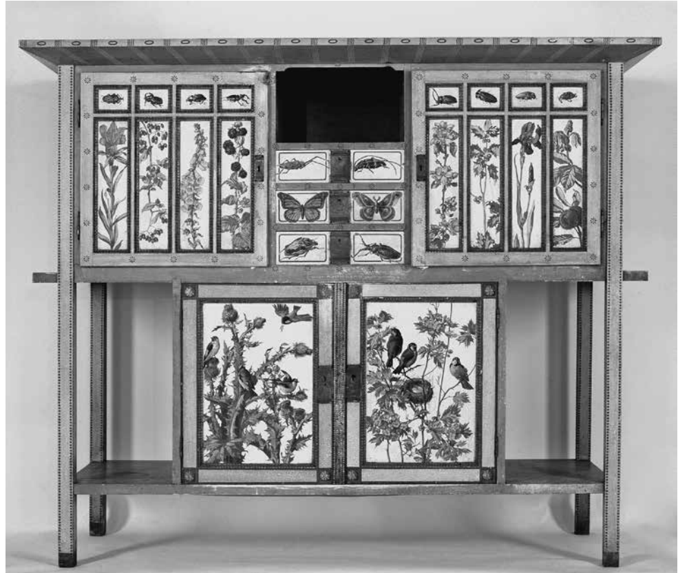
Abb. 7: Wilhelm Rinneberg, Kunstgewerbeschule Nürnberg (Bemalung), Bücherschrank, 1905, Holz und Messing, H. 155,7 cm, B. 183,3 cm, T. 59 cm, GNM, LGA8959.

Ein weiteres Exempel der ästhetischen Wertschätzung des Schmetterlings ist ein Schreibzeug von um 1840 (Abb. 8). Der Tintenlöscher, welcher in der Form eines Tagpfauenauges sehr detailreich und präzise gestickt wurde, ist ein echter Blickfang. Die Gänsefedern wurden schnell abgenutzt, weshalb davon auszugehen ist, dass das Set ein Geschenk war und nicht primär einen praktischen Sinn erfüllen sollte. Der aufwendig gearbeitete Schmetterling unterstreicht diese Annahme. Der Körper des Insekts setzt sich plastisch von den zweilagigen Flügeln ab. Sogar umwickelter Draht am Kopf des Schmetterlings simuliert die Fühler. Die Muster der Vorder- und der hinteren