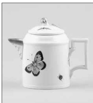
Abb. 5: Milchkännchen, 1. Hälfte 19. Jh. Nürnberg, GNM, Ke769 (Foto: GNM).

te des 19. Jahrhunderts stammt, also lange nachdem die Produktion der Straßburger Keramik mit Schmetterlingsdekor 1754 abrupt abbrach. Die Falter sind hier deutlich naturalistischer in ihrer Farbgebung und Struktur. Die Flügelränder sind naturgetreu konkav und glatt dargestellt, das Muster der Flügel ist symmetrisch, und auch die Farbverläufe wirken natürlicher.