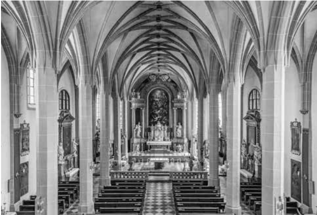
Abb. 2: Altötting, Stiftspfarrkirche St. Philippus und Jakobus.

rischen Lehre und verblieb im alten Glauben. Er starb am 10. März 1527 in Braunau und wurde anschließend in der Kirche des Kollegiatstifts Altötting beigesetzt (Abb. 2).