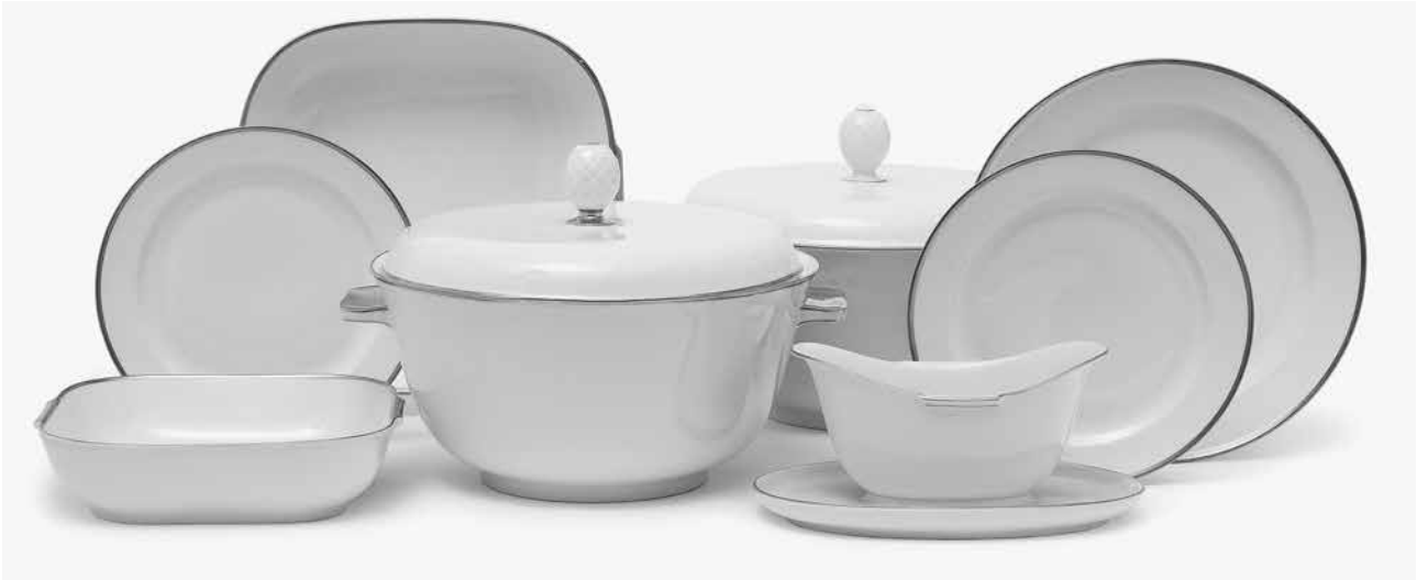
Abb. 2: Speiseservice „Helena“, Entwurf: Wolfgang von Wersin, 1936; Ausführung: Porzellanfabrik Rosenthal, ab 1936. Porzellan, weiß, undekoriert. Selb, Porzellanikon.

ren, die zu niedrigen Preisen angeboten werden konnten. Im Laufe der Jahre ergab sich eine enge Zusammenarbeit mit der Deutschen Werkstätten AG in Hellerau, die Wersins funktional-schlichte Möbel lange Zeit herstellten.