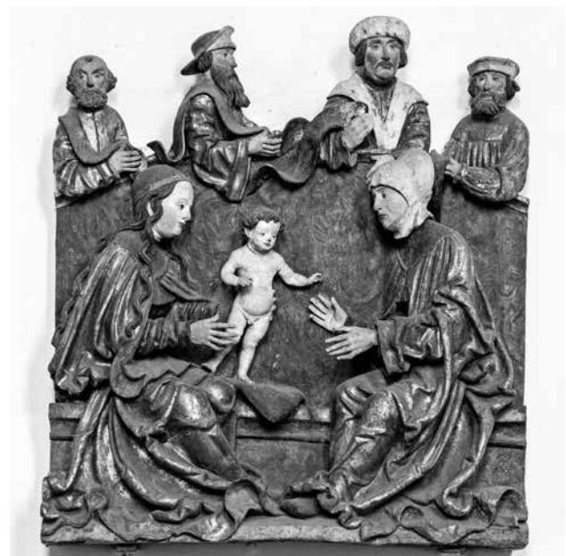
Abb. 7: Werkstatt des Meisters der Altöttinger Türen, hl. Sippe, um 1520/25, Obernberg a. Inn, Pfarrkirche.

Doch ist ein derart früher zeitlicher Ansatz des Altöttinger Retabels kaum vorstellbar: Die in der Zeichnung von 1695 fixierte Figurengruppe in der Mittelnische gehörte offenbar einer Reihe von Sippendarstellungen an, deren Typus in der