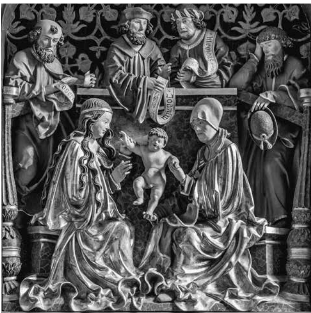
Abb. 6: Meister der Altöttinger Türen, hl. Sippe, nach 1513, Neuötting, St. Anna.

Der dreiteilige Aufbau gleicht im Wesentlichen der Vorderseite, doch erscheint der Mittelteil reicher gestaltet. Die Rundbogennische steigt höher, durchbricht das Gebälk und stößt mit dem Scheitel gegen dessen Abschlussgesims. In die Nische sind Renaissance-Säulchen eingestellt, die eine Archivolte tragen. Auch der Sockel ist in der Mittelachse um ein zusätzliches Postament bereichert, dessen Zweck sich jedoch nicht klar erschließt.