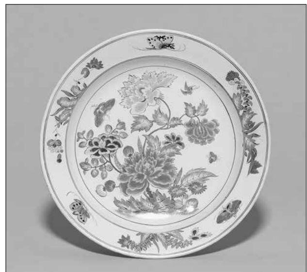
Abb. 4: Adam Friedrich von Löwenfinck, Schüssel aus Fayence, um 1744, Dm 30,5 cm, GNM, Ke304.

kundlichen Anspruch hatten, sondern einen dekorativen Charakter anstrebten und daher die Schmetterlinge meist keinen realen Arten zuzuordnen sind. Nichtsdestotrotz wirkten die Insekten immer lebensnäher, so beispielsweise bei einem Kaffeeservice (Abb. 5), das aus der ersten Häl-