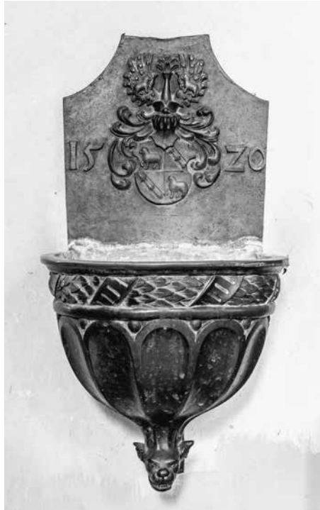
Abb. 9: Altötting, Stiftspfarrkirche St. Philippus und Jakobus, Weihwasserkessel vom Wandmonument für Thomas Löffelholz von Kolberg, bez. 1520.

Bayerische Staatsbibliothek, München, Cgm 2986 (Anton Maria Kobolt: Historisch-Chronologische Beschreibung der Herren Pröbste des uralten churfürstlichen Kollegiatstifts zu Altenötting von dessen Errichtung an bis auf unsere Zeiten, 1784). – Archiv des Bistums Passau, Administrationsarchiv Altötting, Anton Maria Kobolt: Collectanea Diplomatico-genealogico-historica Vetero-Oettingana ex authenticis, domesticisque monumentis & Scriptoribus congesta & conscripta . – Historisches Archiv des Germanischen Natio-