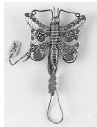
Abb. 9: Garnknäuelhalter, 1. Hälfte 19. Jh. (?), Silber, Silberfiligran, Steine, GNM, KI7349.

Der Schmetterling diente auch bei der Herstellung von Silberfiligran als motivisches Vorbild (Abb. 9). Ein Garnknäuelhalter aus der ersten Hälfte des 19. Jahrhunderts, ein kleiner Begleiter des Alltags beim Stricken, ist aus Silber mit blauen Steinen gearbeitet. Die zweilagigen Flügel sind klein im Verhältnis zur Körpergröße des Tieres. Das Silberfiligran kräuselt sich gleichmäßig in Spiralen entlang der Flügelstruktur und umrahmt vier blaue Steine, die die Flügel symmetrisch schmücken. Am unteren Ende des Abdomens hängt