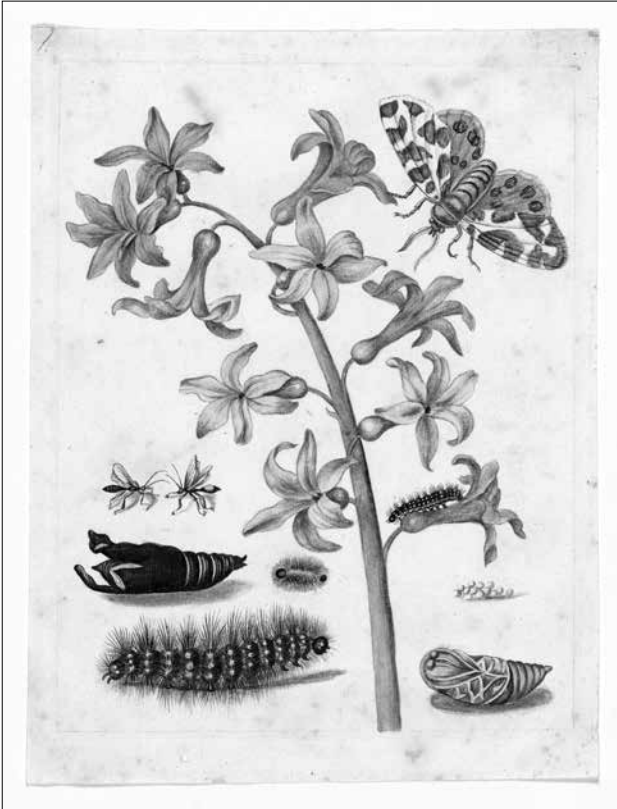
Abb. 2: Maria Sibylla Merian: Blaue Hyazinthe mit Schmetterling und Insekten, 1685/91, Aquarell und Papier, H. 16,3 cm, B. 12,3 cm, GNM, HZ588.

Merians Schmetterlingsbilder sind nicht zuletzt hier im Museumsshop zu erwerben.