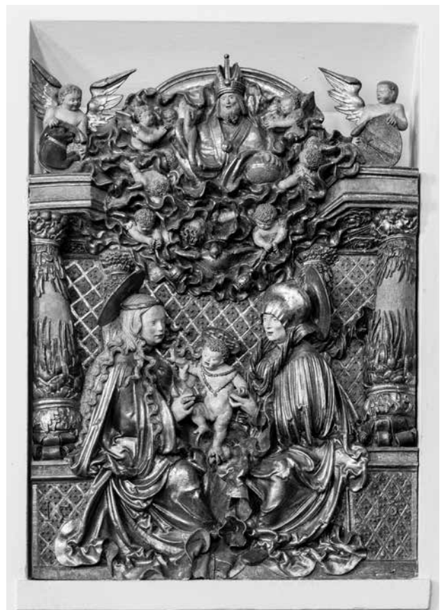
Abb. 5: Hans Leinberger, hl. Anna Selbdritt, bez. 1513, Ingolstadt, St. Johann im Gnadenthal.