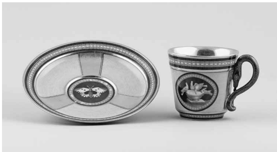
Abb. 6: Königliche Porzellanmanufaktur Berlin, Tasse mit Untertasse, 1810/15, Porzellan, H. Tasse 7,2 cm, Dm. Untertasse 14,8 cm, GNM, Ke2859.

Nicht nur auf Fayence und Keramik wird der Schmetterling rezipiert. Auch in Alltagsgegenständen findet das Tier seinen Platz. In der im GNM beheimateten Sammlung der Landesgewerbeanstalt befindet sich ein atemberaubend detailreicher Schrank von 1905, welcher mit diversen Pflanzen und Insektendarstellungen geschmückt ist (Abb. 7). An zentraler Position auf einer Schublade erkennbar sind naturalistisch wiedergegebene, große Schmetterlinge, umgeben von Grashüpfern und Käfern. Dieser Naturalismus lässt die Insekten lebendig wirken, so, als ob diese auf dem Objekt verweilen. Interessant sind hier auch die Käfer, die seitlich oberhalb auf schmalen Bildfeldern dargestellten Pflanze angeordnet sind. Möglicherweise handelt es sich hier um Kombinationen von Insektenabbildungen mit den zugehörigen Futterpflanzen, eine Einschätzung, die der Naturkunde entspringt.