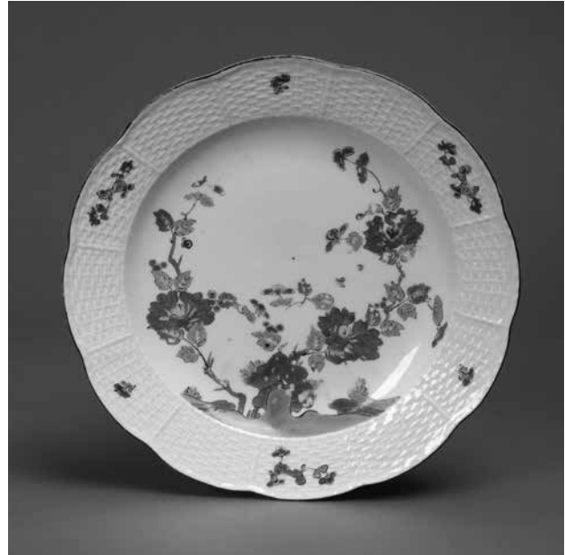
Abb. 4: Teller, Modell: Johann Friedrich Eberlein, April/August 1736; Ausführung: Porzellanmanufaktur Meißen, um 1740/50. München, Stiftung Ernst Schneider, Schloss Lustheim, ES1642.

Beim Streublumendekor verteilen sich auf den Geschirrflächen kleine bunte Blümchen. Auch Moosrosen und Gräser und blaue Meißener Blumen wurden aufgemalt. Einen eher auffälligen Dekor stellte u. a. „Tropicana“ dar, ein ostasia-