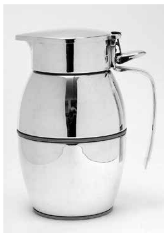
Abb. 7: Thermoskanne, sog. Thermolord. Entwurf: Wolfgang von Wersin, 1956/58. Ausführung: Firma Erhard & Söhne, Schwäbisch Gmünd.