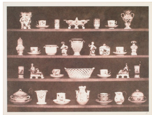
Abb. 3: William Henry Fox Talbot, Gegenstände aus Porzellan (Tafel III), 1845, Kalotypie, o.M., Bradford, National Science and Media Museum. Aus: William Henry Fox Talbot, The Pencil of Nature , London 1844, Nachdr. Chicago / London 2011, S. 19.

Hockney hingegen setzt einen anderen Akzent, indem für ihn gerade die fotografische „Überempfindlichkeit in ihrem Kontakt zur Realität“ 89 dazu führt, dass das Foto „nicht real genug“ 90 und nicht „wahrhaft“ ist. Stattdessen wird die Frage nach der Realität der Fotografie vom Bild auf den Fotografierenden und die Betrachtenden verlagert. Hockney verfolgt ein Interesse am „realen Sehen“ 91 beziehungsweise einer „wahren‘ Dokumentation des Sehens“ 92 . Inwiefern dies eingelöst ist, wurde durch Hockney permanent reflektiert. Schließlich erkannte er, dass es „beim realen Sehen [...] keine Kanten und schon gar keine rechten Winkel [gibt]“ 93 . Zu dieser Erkenntnis gelangte er womöglich insbesondere in der Auseinandersetzung mit dem hier besprochenen joiner , der einer der letzten ist, bevor Hockney das Format mit einer handelsüblichen Kleinbildkamera weiterentwickelte.