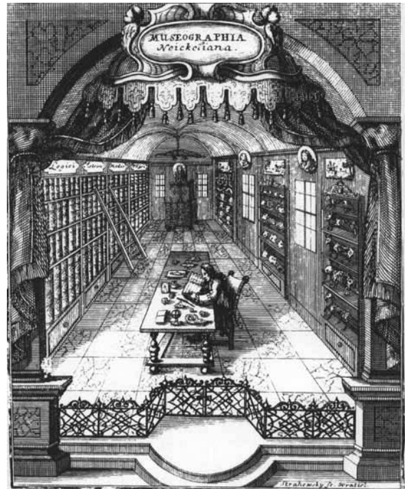
Abb. 3: Aus: Christoph Friederich Neickel, Museographia oder Anleitung zum rechten Begriff und nützlicher Anlegung der Museorum oder Raritäten-Kammern... , Leipzig/ Breslau 1727

Demnach entsteht die Ordnung der Sammlung nicht als festes Arrangement vor Ort, sondern wird über den Prozeß der Forschung laufend erweitert und revidiert. Die unmittelbare visuelle Erfahrung der Sammlungsobjekte durch den Besucher erweist sich bei näherer Betrachtung als ein komplizierter Vorgang, bei dem Erwartungshaltungen, vorhergehende und neue Erfahrungen eine Verbindung eingehen. Die Erziehung des Auges und die Vermittlung des Wissens ist das Ergebnis einer öffentlich agierenden Forschung. 35 Das bekannte Titelbild aus Neickels Museographia , das den Sammler mitten zwischen seinen Objekten und Büchern zeigt, thematisiert diesen wichtigen Aspekt der Wissensvermittlung. (Abb. 3). Der Besitzer der Sammlung erscheint hier als Forscher, der die Objekte seiner Sammlung nicht nur mit dem aktuell verfügbaren Buchwissen abgleicht, sondern zugleich auch wiederum die Objekte in ein über den Sammlungsraum hinaus verfügbares Buchwissen transformiert. Das Bild zeigt somit weniger eine reale