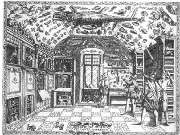
Abb. 1: Aus: Ferrante Imperato, Dell' historia naturale , Venedig 1672.

Es lohnt sich daher, dieses Verhältnis von Schauraum und Forschungsraum aus historischer Perspektive und aus der Vorgeschichte heraus näher zu betrachten.