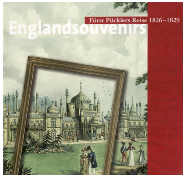
Abb.6: Englandsouvenirs. Fürst Pücklers Reise 1826-1829, hg. v. der Stiftung Fürst-Pückler-Park Bad Muskau, Zittau 2005, Bucheinband.

Um es gleich vorweg zu sagen: Mit dem 2005 von der Stiftung Fürst-Pückler-Park Bad Muskau herausgegebenen und im Verlag Graphische Werkstätten Zittau erschienenen Prachtband Englandsouvenirs. Fürst Pücklers Reise 1826-1829 76 wurde ein neues Kapitel der Pückler-Publizistik aufgeschlagen. In einer selten gelungenen Übereinstimmung von Inhalt und Form ist diese Aufbereitung einer Schlüsselerpisode der Pückler-