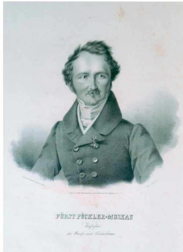
Abb.1: Porträt Hermann Fürst von Pückler-Muskau, Lithographie von Wilhelm Devrient, um 1838.