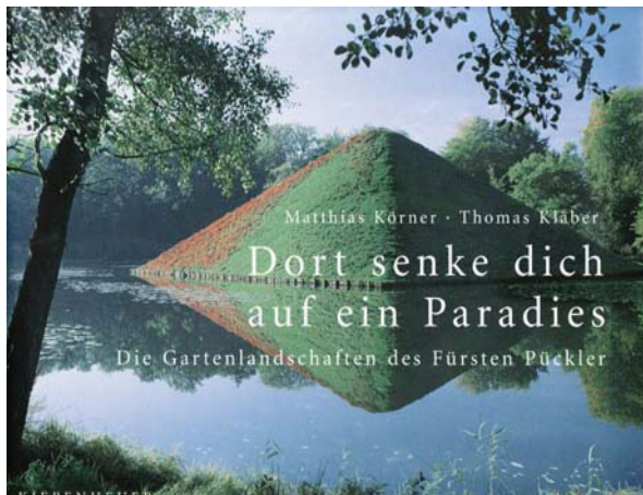
Abb.7: Matthias Körner und Thomas Kläber: Dort senke dich auf ein Paradies. Die Gartenlandschaften des Fürsten Pückler , Berlin 2006, Bucheinband.

Ließ sich bei Eisold eine gewisse Unentschiedenheit zwischen Sachbuchcharakter und essayistischer Nonchalance konstatieren, überzeugen Körner und Kläber durch eine entschiedene Konsequenz der Mittel. Schon das Querformat des Buches legt eher ein sich hingebendes, denn ein kritisch rasonierendes Rezeptionsverhalten nahe: Blättern, Schmökern, Schwelgen. Dabei bleiben im Unterschied zu vielen attraktiv aufgemachten, aber inhaltlich belanglosen Coffee table books Einsicht und Erkenntnis nicht ausgeklammert.