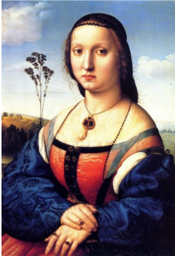
Abb. 3: Raffael, Porträt der Maddalena Doni, Florenz, Palazzo Pitti, 1504-1505

Doni), die formal eng an Leonardos Mona Lisa anschließen (Abb. 3).