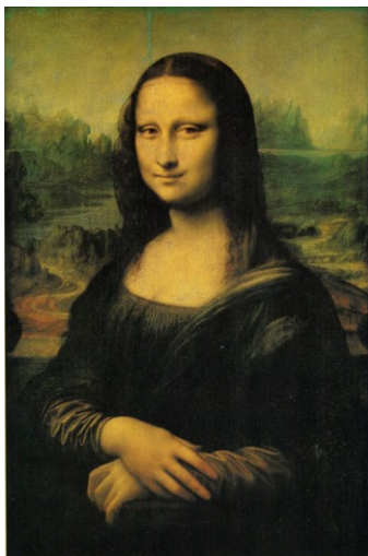
Abb. 1: Leonardo da Vinci, Mona Lisa , Paris, Louvre, ca. 1503-1504

Nach gegenwärtigem Kenntnisstand besteht also kein Anlass, die traditionelle Identifizierung von Leonardos Gemälde mit Lisa del Giocondo anzuzweifeln (Abb. 1).