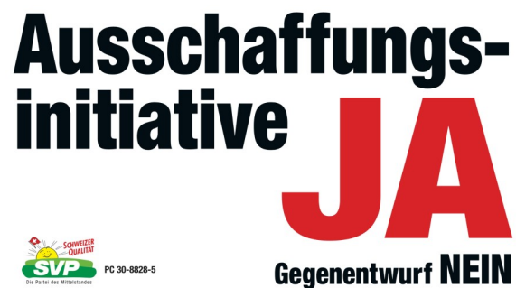
Abb. 2: Ausschnitt von Abb. 01.

die Buchstaben „SVP“ gesetzt sind. In schmalen, schwarzen Buchstaben prangt darunter „Die Partei des Mittelstands“. Den Sonnenstrahlen ist eine rote Fahne mit wiederum einem weissen Kreuz hinzugefügt, neben dem Strahlenkranz befindet sich in rot und schräg gedruckt der Text „SCHWEIZER QUALITÄT“. Das zentrale Element des Plakates ist unweigerlich ein schwarzes Schaf, das von einem weissen Artgenossen getreten wird. Passend zum grafischen Stil des Plakats sind beide Schöfflis im cartoonesken Stil gehalten, während das schwarze Schaf jedoch in