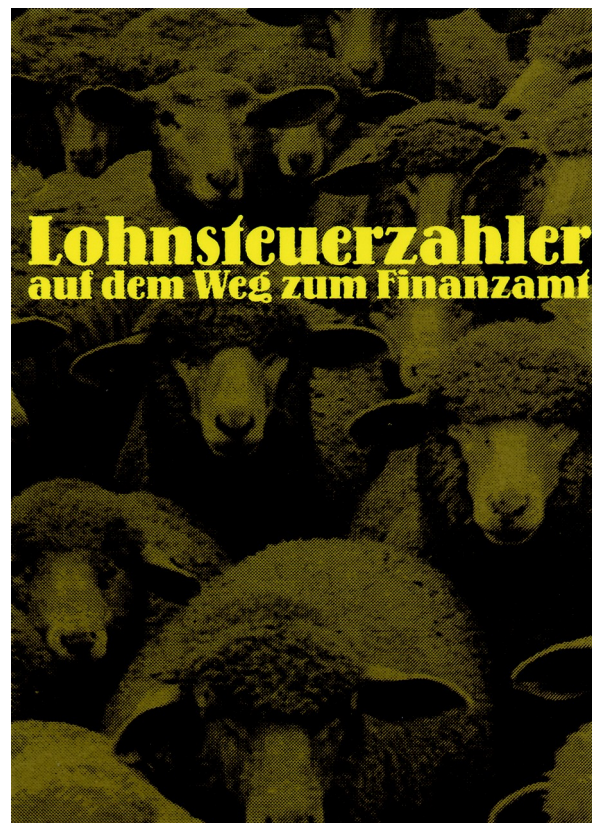
Abb. 11: Lohnsteuerzahler auf dem Weg zum Finanzamt , 1996, Offset, 84 x 59 cm.

Schenkt man dem Sorgenbarometer der Credit Suisse von 2014 Glauben, so sind 90 Prozent der Befragten stolz darauf, Schweizer zu sein 73 . Aufgabe des Schweizerkreuzes auf rotem Grund ist es, beim Rezipienten vorhandene kognitive Muster aktivieren - wie die Liebe zum Vaterland, Genauigkeit und Verlässlichkeit - urschweizerische Werte. Sascha Demarmels weist nach, dass das Schweizerkreuz in seinem politischen Gebrauch einem permanenten Wandel unterliegt und heute von links wie rechts nahezu unverkrampt genutzt wird 74 . Auch müssen wir festhalten, dass seit der Jahrtausendwende das Schweizerkreuz vermehrt alltäglichen Gebrauchsartikel zierte. Aus dem ursprünglich politisch konnotierten Symbol wurde ein