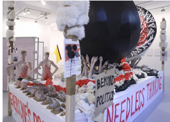
Abb. 9: Thomas Hirschhorn, Black & White Hemisphere , Installation, 2008, 330 x 250 x 505 cm.

Anfangs des Jahres zierte das Schöffli wieder den öffentlichen Raum. Die SVP nutzte das Sujet für die „Volksinitiative zur Durchsetzung der Ausschaffung krimineller Ausländer“. Die Initiative beabsichtigte eine wort- und sinngetreue Umsetzung der angenommenen Ausschaffungsinitiative von 2010 und wollte in die Verfassung festschreiben, dass in der Schweiz lebende Ausländer auch bei geringfügigen Vergehen automatisch abgeschoben werden müssen - ohne Einzelanfrageprüfung und ohne Ermessensspielraum eines Richters (Abb. 10). Kleine Änderungen zum Schöffli-Plakat von 2010 stechen sofort ins Auge. Beide Schafe sind nun in ihrer vollen Größe dargestellt, sie nehmen nun aber weniger Platz des Plakates ein. Mit den Textebenen „Endlich Sicherheit schaffen“ und „JA zur Ausschaffung krimineller Ausländer“ möchte die Partei verdeutlichen, dass der Wille des Volkes von 2010 vom Parlament nicht umgesetzt wurde und die Ausländerkriminalität immer noch ein großes Problem wäre - perception is reality wie man in der Berliner Politik derzeit zu sagen pflegt. Im Gegensatz zur Ausschaffungsinitiative lehnte das Volk die Initiative ab 71 .