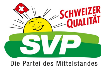
Abb. 5: Ausschnitt von Abb. 01.

Volkspartei zu einer Partei der „populistischen radikalen Rechten“ wandelte und ihren Wähleranteil verdoppeln konnte 39 . Die SVP setzt das direktdemokratische