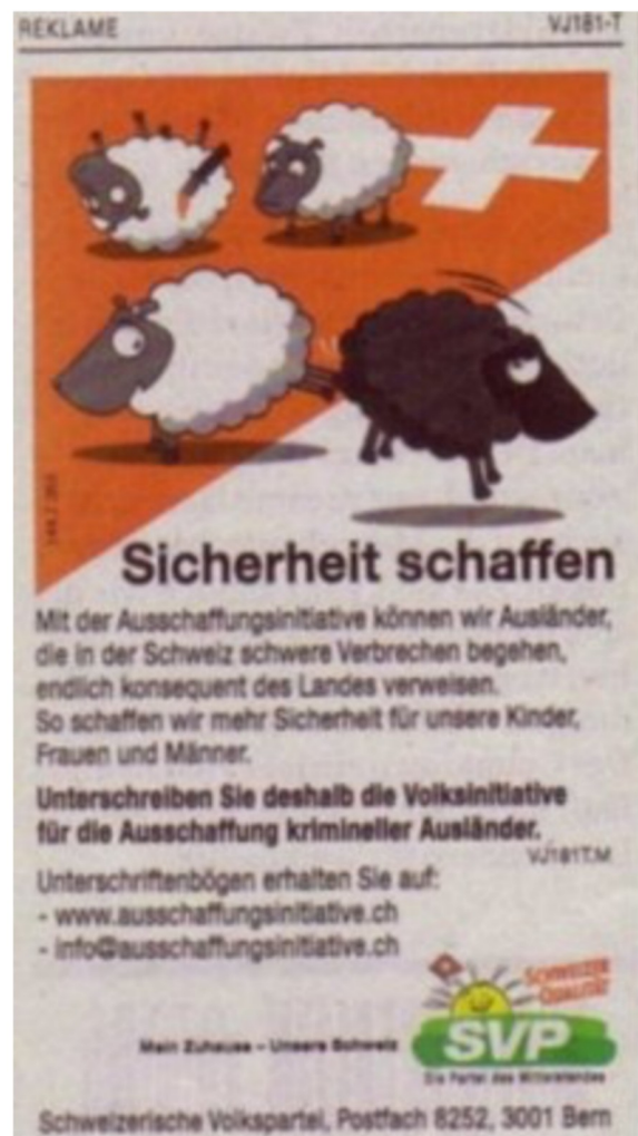
Abb. 8: SVP - Sicherheit schaffen, Zeitungsinserat, 2007.

Gegen die Werbung der SVP gab es mehrere Petitionen mit tausenden von Unterschriften, die Partei der Arbeit (PdA) reichte im Kanton Zürich Klage wegen Verstosses gegen das Antirassismusgesetz ein, da das Plakat gesellschaftliche Ausgrenzung propagiere und diskriminierend sei 63 . Der UNO-Berichtersteller Doudou Diène meinte, „das Plakat provoziere Rassen- und Religionshass“ und forderte vor dem UNO-Menschenrat den Rückzug des Plakatmotivs, um dem internationalen Ansehen der Schweiz nicht zu schaden 64 . Auch die damalige Bundesrätin und Vorsteherin des Eidgenössischen Departements für auswärtige Angelegenheiten (EDA) Micheline Calmy-Rey kritisierte das Motiv scharf, da der damit geschürte Rassismus und die damit propagierte Fremdenfeindlichkeit nicht der Schweizerischen Tradition entspräche 65 . Das Plakat wurde also seitens den Medien, wie auch der politischen Elite als rassistisch und fremdenfeindlich konnotiert. Zur Überraschung aller wurde aber