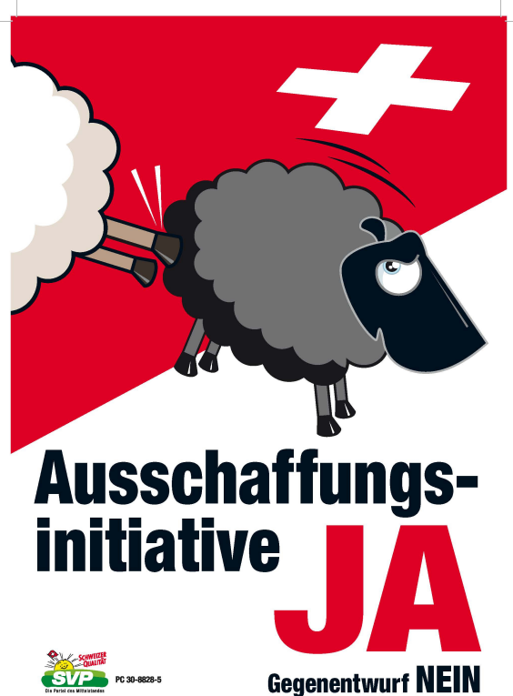
Abb. 1: Ausschaffungsinitiative JA- Gegenentwurf nein, 2010, Offset, 128 x 89,5 cm.

Das hochformatige Plakat (Abb. 01) wird durch eine Diagonale als dynamisches Element in zwei Bereiche geteilt; eine weisse Fläche in der unteren Hälfte und eine etwas kleinere rote Fläche im oberen Bereich, auf der ein weisses Kreuz angebracht ist. Das untere Drittel des Plakats wird von einer Textebene dominiert. In schwarzen, serifenlosen Lettern nimmt der Textbaustein „Ausschaffungsinitiative“ den meisten Raum ein, der Baustein „Gegenentwurf NEIN“ ist deutlich kleiner, abgesetzt davon sticht ein rotes „Ja“ dem Betrachter sofort ins Auge. Im linken unteren Eck schaut geradezu verschwindend klein eine lachende, cartooneske Sonne hinter einem hell- und dunkelgrünen Hintergrund hervor, auf dem in weissen Lettern