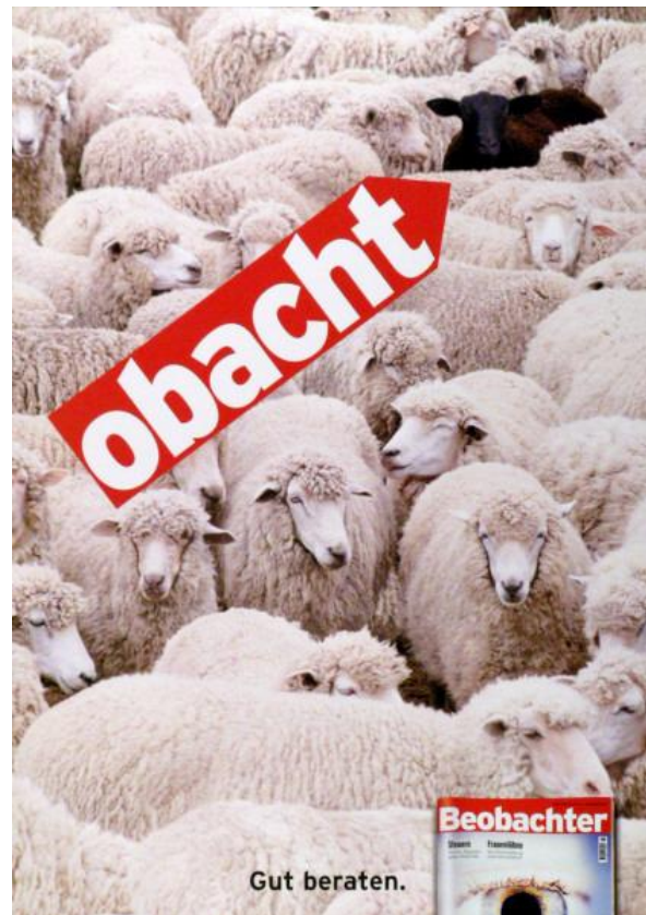
Abb. 12: Obacht - Gut beraten. - Beobachter , 2006, Siebdruck, 170 x 116,5 cm.

Bei Matthäus 18,12-13 heisst es: „Was meint ihr? Wenn jemand hundert Schafe hat und eines von ihnen sich verirrt, lässt er dann nicht die neunundneunzig auf den Bergen zurück und sucht das verirrte? Und wenn er es findet - amen, ich sage euch: er freut sich über dieses eine mehr als über die neunundneunzig, die sich nicht verirrt haben.“ Zu den ältesten Motiven der christlichen Bild- und Ideengeschichte zählt die Gestalt des guten Hirten. So heisst es bei Jesaja 40,11: „Wie ein Hirte führt er seine Herde zur Weide, er sammelt sie mit starker Hand. Die Lämmer trägt er auf dem Arm, die Mutterschafe führt er behutsam.“ Der biblische Diskurs möchte aber nicht nur als theologische, sondern auch als politische Parabel gelesen werden. Platon empfiehlt in seiner Politeia „edle Hunde“ als Wächter des Staates, da sie über eine entscheidende politische Fähigkeit verfügen: sie unterscheiden zwischen Bekannte und Unbekannte. Als Hunde müssten die Wächter des Volkes Sicherheit garantieren, „dass kein Feind wie ein Wolf die Herde anfallen“ könne 75 . Das Bild von der Herde und dem Hirten begegnet uns auch wieder in der Nomoi . Als Hirte sei der Führer des Staates wie jeder „Schaf-