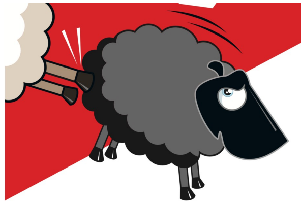
Abb. 3: Ausschnitt von Abb. 01.

Die Schweiz hat in ihrer Historie eine lange Erfahrung mit Zuwanderung größerem Umfangs gemacht 37 . Im Jahr der Abstimmung waren knapp 6.5 Millionen Menschen in der Schweiz leb- und sesshaft, fast jeder Vierte davon war ausländischer Staatsangehöriger und über ein Drittel der Bevölkerung hatte einen Migrationshintergrund 38 . Seit den 1960er Jahren mobilisierten rechtskonservative politische Kräfte wie die Nationale Aktion für Volk und Heimat immer wieder mit dem Schlagwort der Überfremdung und versuchten mit dem politischen Mittel der Volksinitiative, die Zahl der in der Schweiz lebenden Ausländer zu begrenzen. Seit den 1990er Jahren wurde das populistische Spannungskreuz „Volks vs. Elite“ und „Zugehörigkeit vs. Fremdes“ hauptsächlich von der SVP bewirtschaftet, die sich von einer mittelständischen