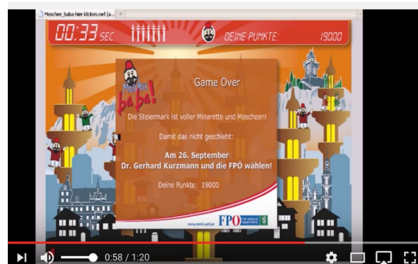
Abb. 6: Screenshot Moschee baba , Browserspiel, 2010.

ren Entstehungsprozess. Den Grundstein einer Kampagne würde stets ein kleiner Kern der Partei legen der auslote, welche Themen die Öffentlichkeit bewegen. Sobald die Kernbotschaft der Kampagne klar sei, werde die Werbeagentur mit einbezogen 50 . Man könnte also die SVP als allmächtige Instanz der Kampagne bezeichnen, die dem Plakatgestalter ihre Absichten und Ansichten einzugeben versucht, wobei ich davon ausgehe, dass Herr Segert in der Gestaltung des Plakates freie Hand besitzt.