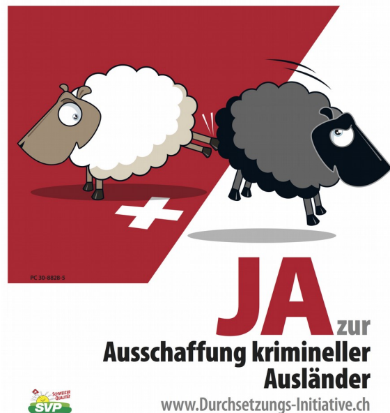
Abb. 10: JA zur Ausschaffungsinitiative krimineller Ausländer - www.Durchsetzungs-Initiative.ch , 2016 Offset, 128 x 89,5 cm.

Aber tun wir dem Plakat recht wenn wir es von vornherein als rassistisch oder fremdenfeindlich diffamieren oder sind dies bloße Reflexe, um sich nicht auf inhaltlicher Ebene mit der Plakataussage, bzw. den Inhalten der SVP auseinanderzusetzen? Die Ereignis-, Strategie- und Produktionskontexte haben uns vor Augen geführt, dass in der Schweiz rassistische und fremdenfeindliche Ressentiments auf jeden Fall latent vorhanden sind - in welchem Land sind sie es nicht? -