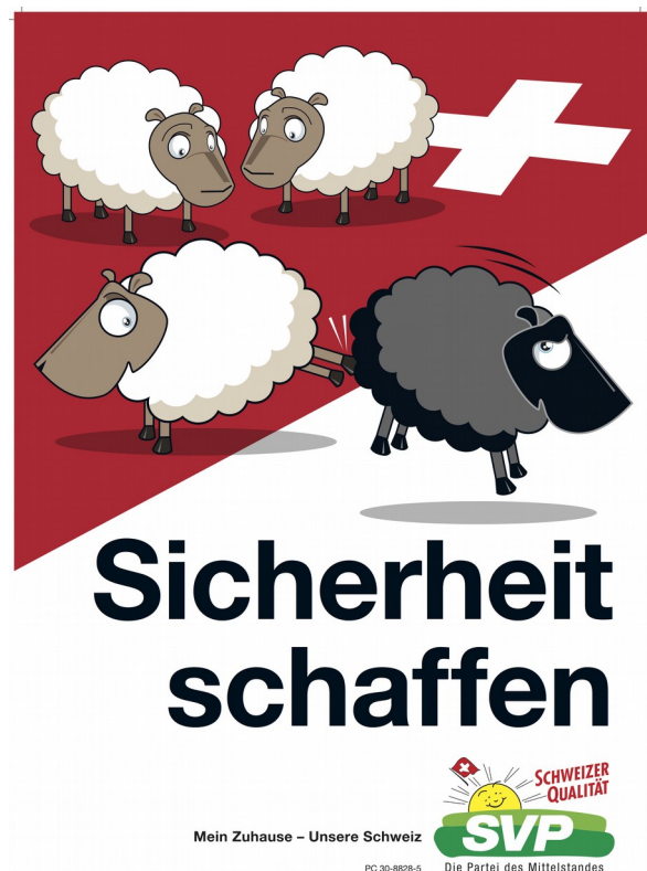
Abb. 7: Sicherheit schaffen - SVP, 2007, Offset, 128 x 89,5 cm.

Die Sichtung der Zeitungsberichterstattung veranschaulicht, dass die SVP in Form der provokanten Kampagnenführung die Medienagenda immens beeinflusste und belegt die These der Multiplikation politischer Inhalte durch die mediale Berichterstattung 58 . In der Schweizerischen Presselandschaft waren die Sympathien für die Initiative bzw. dem Schöfli-Plakat klar verteilt. Während bspw. die NZZ oder der Tagesanzeiger durchgehend negativ darüber berich-