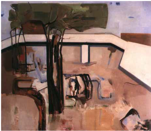
Abb.1: Donald Judd, Ohne Titel , 1956, Öl auf Leinwand, 109,2 x 124,5 cm, Sammlung John J. Jerome.