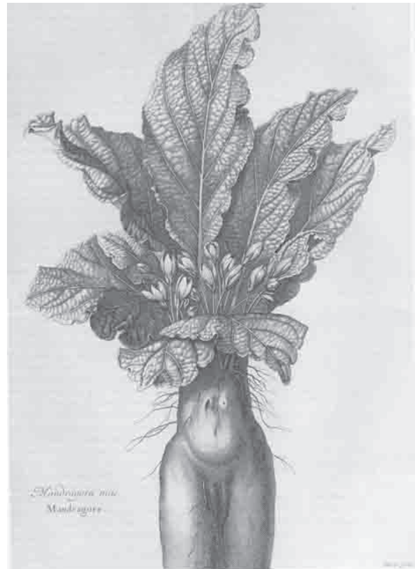
(Abb. 1) Abraham Bosse, Mandragora mas / Mandragore , Radierung, in: Abraham Bosse, Louis Chastillon und Nicolas Robert, Estampes pour servir à l'histoire des plantes , Paris: Imprimerie royale, 1701, aus: Join-Lambert/Préaud 2004, Bosse , Nr. 327.

Im selben Jahr wie die Histoire des plantes wurde von der Académie royale des sciences der zweite Teil der Histoire naturelle des animaux publiziert. 13 Mit diesem Werk warf die zoologische Buchillustration zum einen das bis dahin mitgeführte, umfangreiche emble-