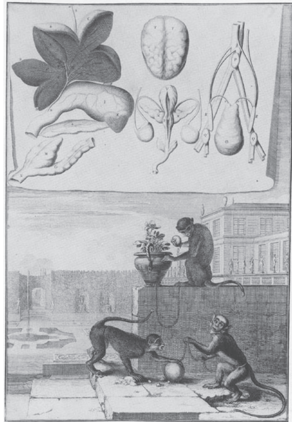
(Abb. 3) Sébastien Leclerc, Affen (zwei Guenons, ein Sapajou), Radierung und Grabstichel, in: Perrault 1676, Animaux , S. 120 (Inv. Préaud 1980, Leclerc , Bd. 2, Inv.Nr. 2935), aus: Picon 1988, Perrault , Abb. 44.

Der zweite Sapajou hat seine Hand so auf die Kugel aus Stein gelegt, als spiele er gerade mit ihr. Im Symboluniversum des emblematischen Zeitalters, an dessen Ausläufern diese Illustration entstanden ist, verweist der Affe, der den spielenden Menschen imitiert, auf die die Natur nachahmende menschliche Kunstfertigkeit. 28 Mit einer Bewegung, die selbst in Bezug auf einen Menschen als graziös zu bezeichnen wäre, hebt der Sapajou die Kette empor, mit der er an die Steinkugel gebunden ist, und blickt dabei versonnen zum Betrachter. Bildmetaphorisch untermauert wird die Menschenähnlichkeit des Affen durch den hier entworfenen Lebensraum des Schloßgartens, den das Tier mit dem Menschen teilt. In der deutschen Übersetzung aus der Mitte des 18. Jahrhunderts, einer Zeit, in der sich die menschliche Fauna so stark im Imaginären auszubreiten beginnt wie seit dem Mittelalter nicht mehr, 29 ist der Anthropomorphismus des Affenbildes auf die Spitze getrieben. Dort haben die beiden rechten Tiere menschliche Gesichter. 30