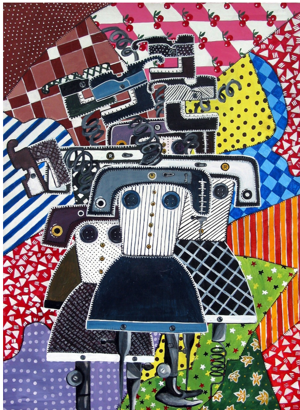
2. Chamika Munasinghe, Mechanisierte Weiblichkeit II , 2006, Acryl auf Leinwand, 73 x 53 cm, Fotograf: Thushantha Rathnayake. (Copyright der Abbildungen Presseabteilung Museum der Weltkulturen, Frankfurt.)

nicht einfach ablegen ließ und deren Substrat sich untrennbar mit dem Wasser vermischt hat. Auswirkungen der Kolonialzeit sind in den Wellen zu spüren, die noch heute das Land überfluten. Chamika Munasinghe macht mit ihrer Arbeit Mechanisierte Weiblichkeit (2006) auf zwei weitere Problematiken in der zeitgenössischen Gesellschaft aufmerksam: