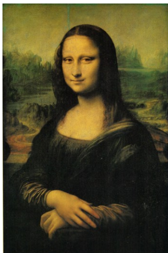
Abb. 1: Leonardo da Vinci, Mona Lisa, Paris, Louvre, ca. 1503-1504