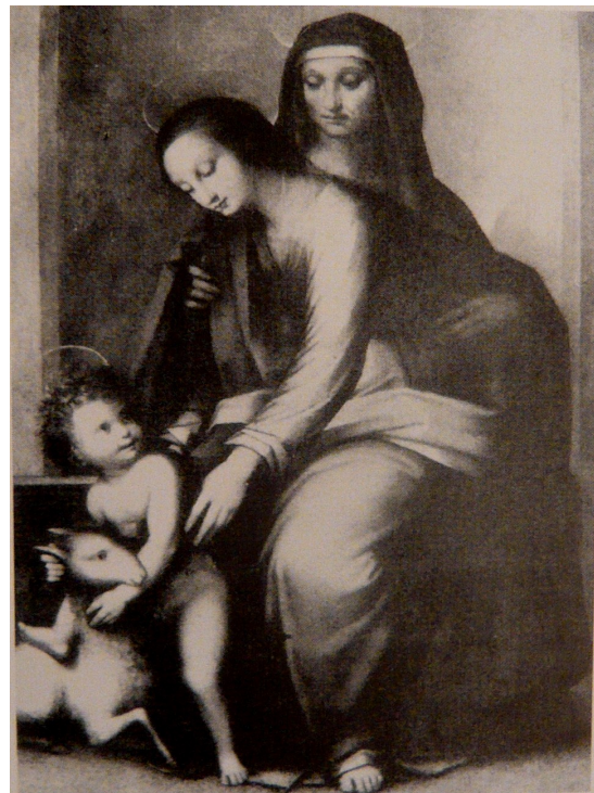
Abb. 3: Brescianino, Entwurf nach Leonardos Anna Selbdritt, 1501, verloren, ehemals Berlin, Kaiser-Friedrich-Museum