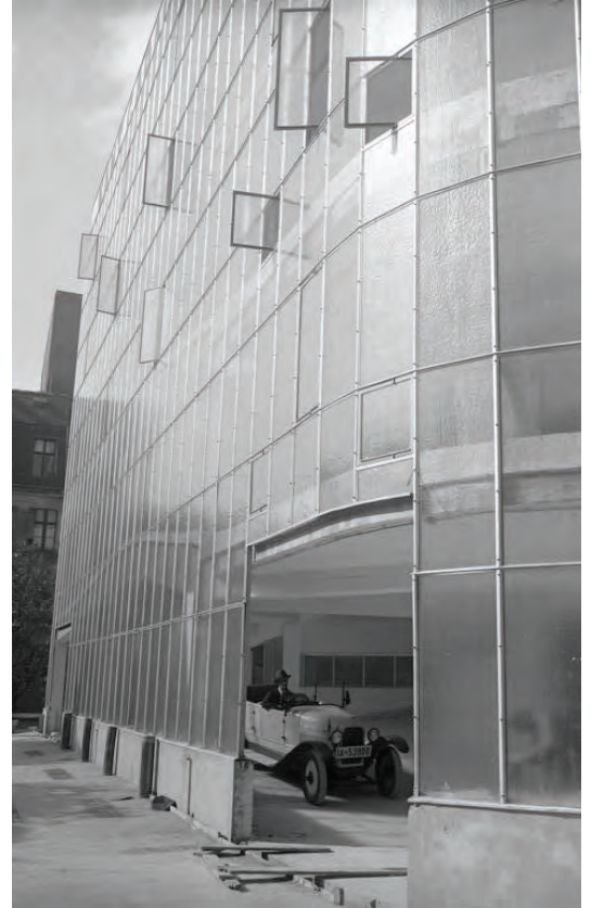
Rückseite Kant-Garagen-Palast 1930