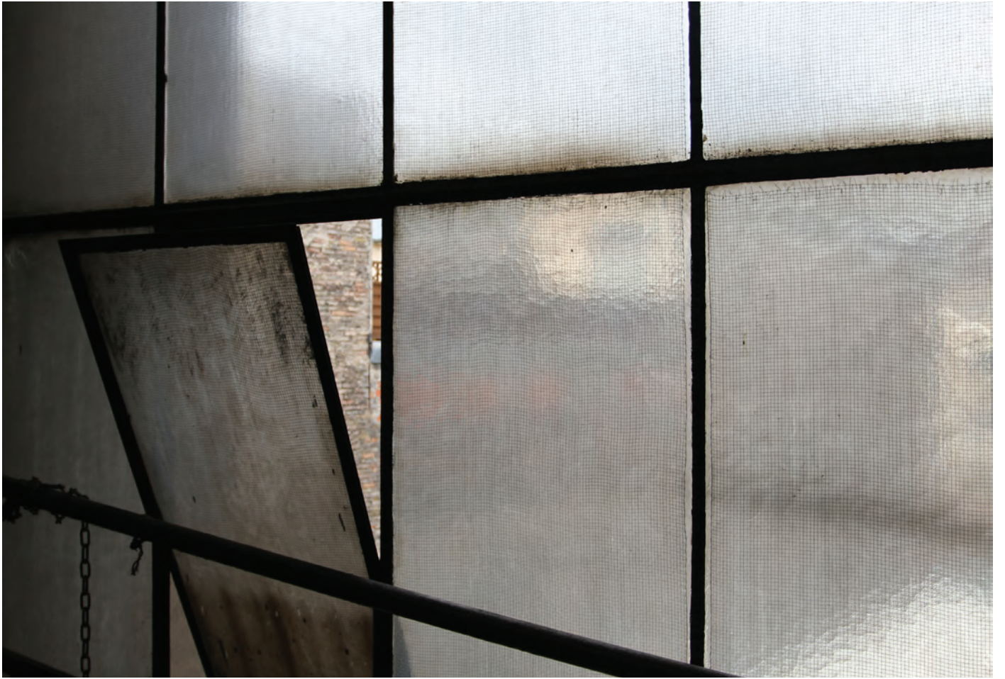
Kant-Garagen-Palast 2013