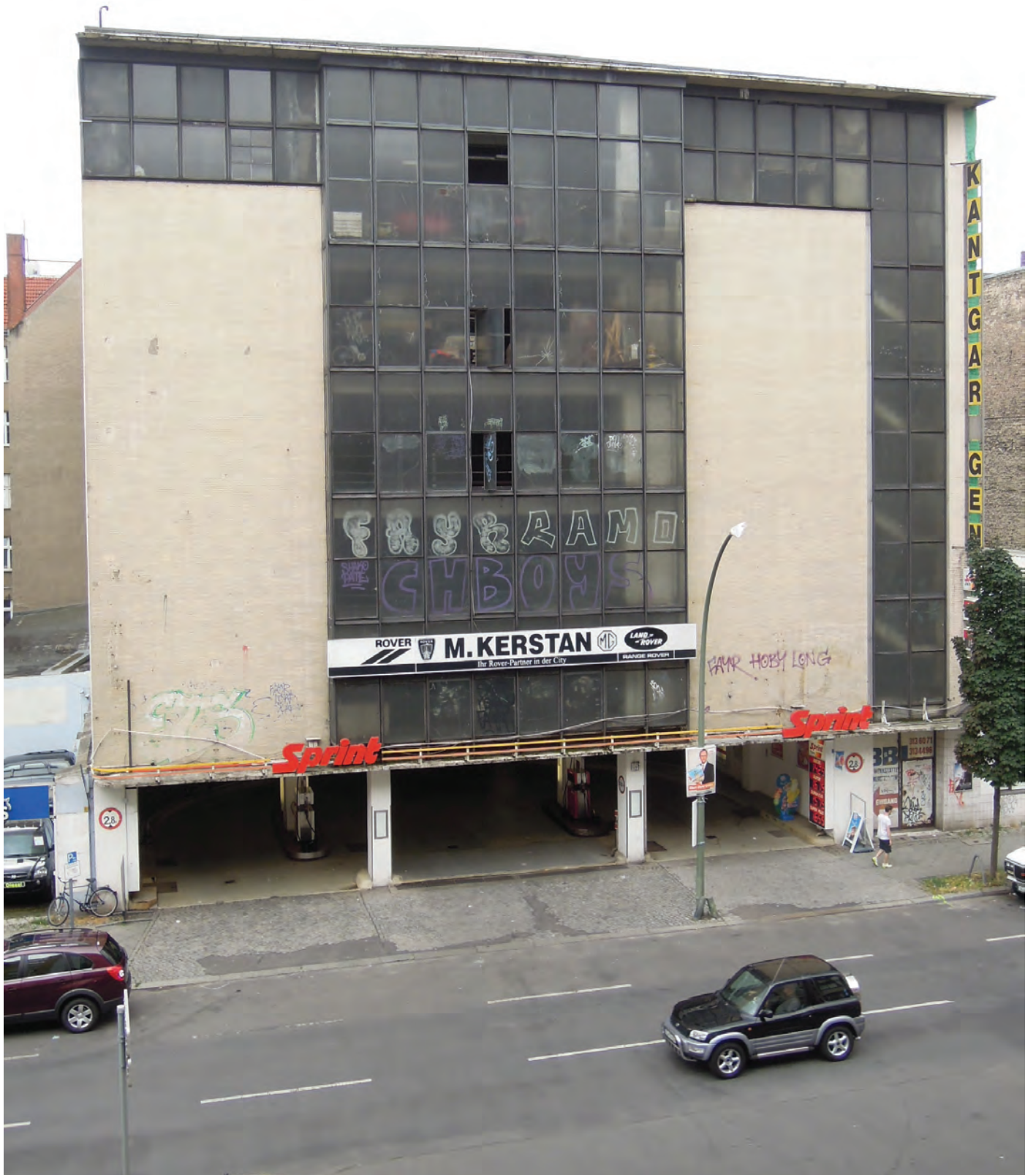
Kant-Garagen-Palast 2013