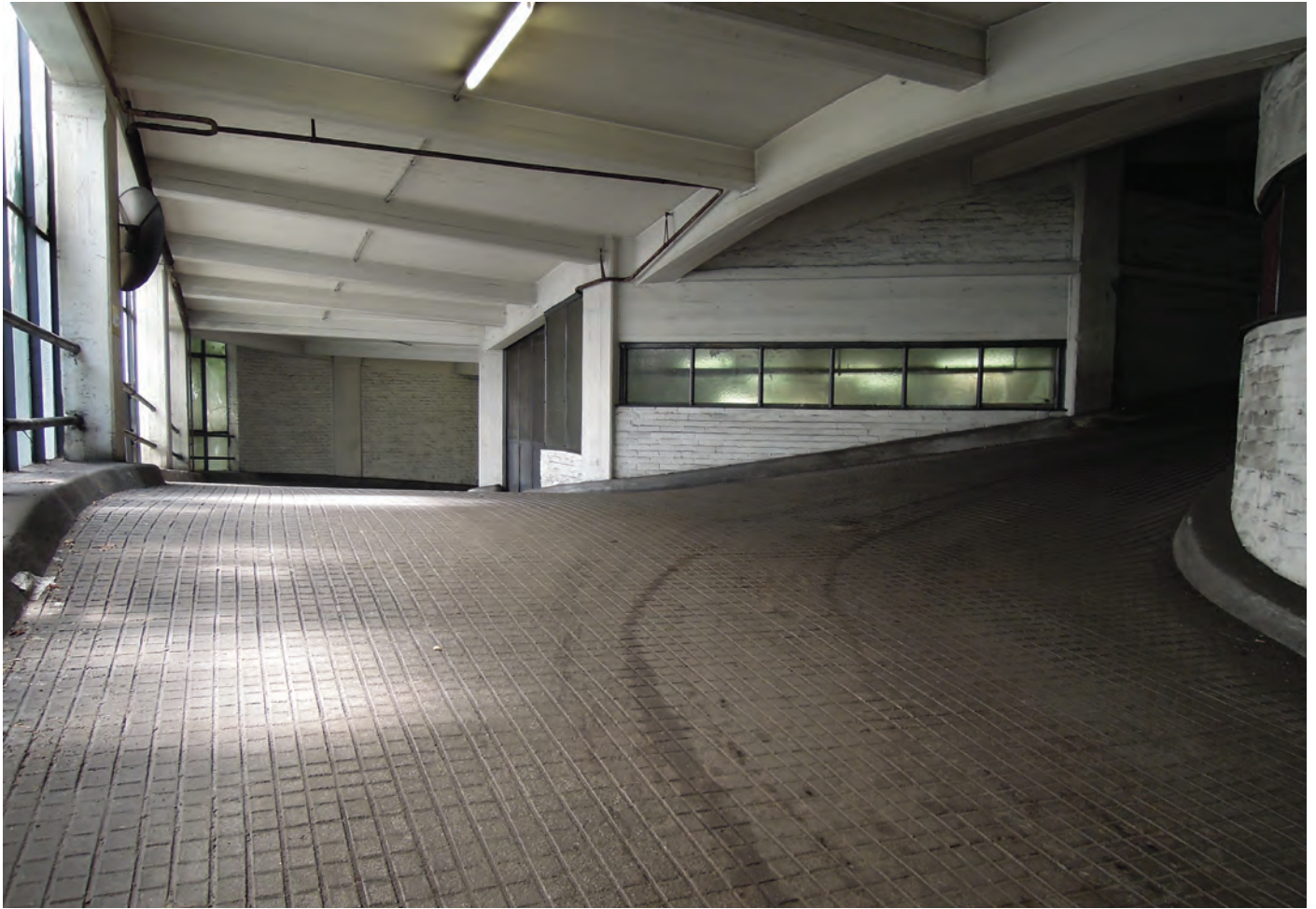
Kant-Garagen-Palast 2013