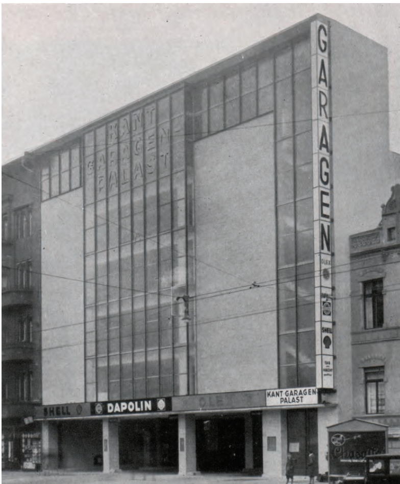
Kant-Garagen-Palast 1932