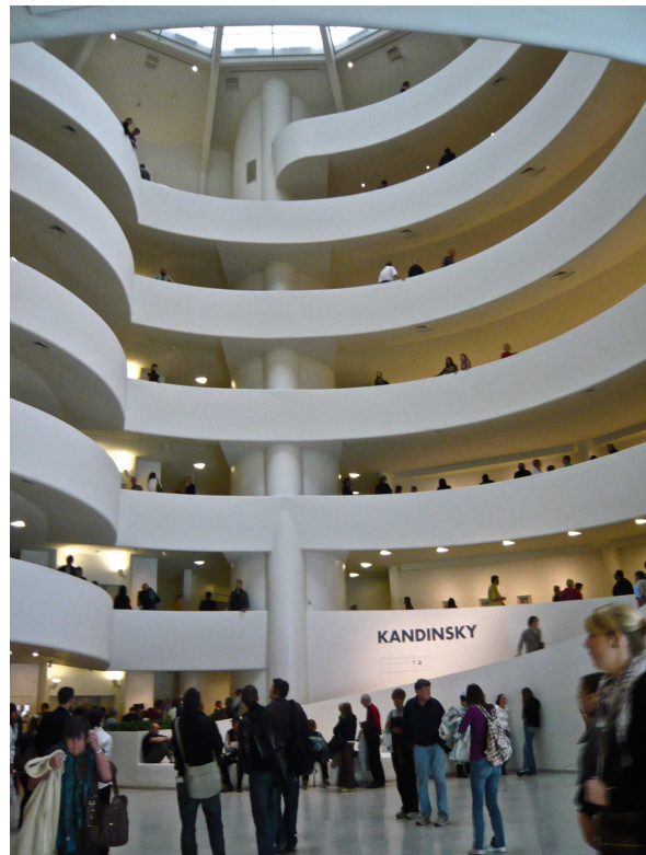
Abb. 1: Eingangshalle des Guggenheim Museums

Die zahlreichen geometrischen Grundformen verleiten dazu, diese körperliche Architektur aus ihren Positivformen heraus zu lesen. 9 Auf der Ebene der materiellen Bausubstanz gelingt es jedoch kaum, vollständig in die Welt der Bilder einzutauchen. Erst die Konzen-