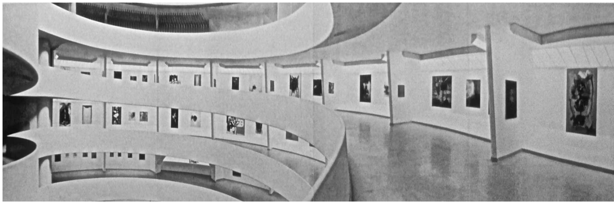
Abb. 3: Ausstellungsparcours in der Aufwärtsbewegung

Jede Linie verkörpert daher die Bewegung, die während ihrer Entstehung ausgeführt wurde. Theodor Lipps schreibt in seiner Einfühlungstheorie bereits Ende des 19. Jahrhunderts, dass eine gerade, ungebogene Linie von a nach b einem einfachen „Bewegungsimpuls“ in eine Richtung folge. Dadurch verwandele sich das Dasein der Linie in ein „Werden“. 17 Diese Bewegung lebt auf der Leinwand weiter und ist als Dynamik im Bild spürbar. Sofern sie sich optisch über den Bildrand hinaus erweitert, macht sie ihre raumgreifende Wirkung geltend, die sich mit der Umgebung des Bildes, also mit dem Museumsraum, verbindet.