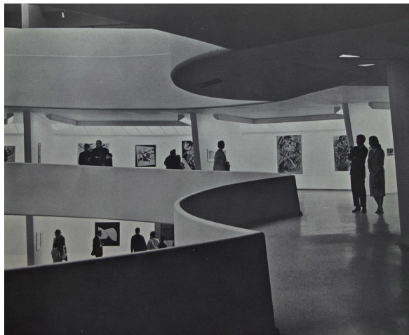
Abb. 4: Konkave ‚Aussichtsplattform‘ auf der Spiralrampe

Jede Linie verkörpert daher die Bewegung, die während ihrer Entstehung ausgeführt wurde. Theodor Lipps schreibt in seiner Einfühlungstheorie bereits Ende des 19. Jahrhunderts, dass eine gerade, ungebogene Linie von a nach b einem einfachen „Bewegungsimpuls“ in eine Richtung folge. Dadurch verwandele sich das Dasein der Linie in ein „Werden“. 17 Diese Bewegung lebt auf der Leinwand weiter und ist als Dynamik im Bild spürbar. Sofern sie sich optisch über den Bildrand hinaus erweitert, macht sie ihre raumgreifende Wirkung geltend, die sich mit der Umgebung des Bildes, also mit dem Museumsraum, verbindet.