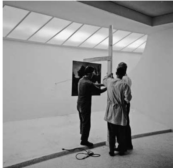
Abb. 6: Unter Direktor James Sweeney eingeführtes Hängesystem an Metallstangen

Das einflussreiche Museum of Modern Art in New York dogmatisierte ab 1939 die Konventionen der Kunstbetrachtung und schuf einen ‚neutralen‘ Behälterraum als angemessene Hintergrundfolie für die Kunstrezeption. Die zeitgenössischen Künstler, die 1957 eine Petition gegen das Guggenheim Museum unterschrieben, forderten jenen orthogonalen Referenzrahmen für die Kunst ein, als sie Frank Lloyd