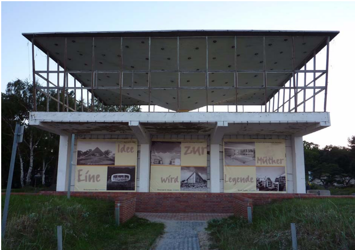
Abb.2: Das Inselparadies in Baabe auf Rügen vor der Sanierung, 2010, Foto: Tanja Seeböck.

schaftliche Untersuchung von Müthers Werk vor. Diesen beiden Ansprüchen wird Schwünge in Beton mehr als gerecht. Das Werkverzeichnis nimmt 85 Seiten der insgesamt 454 Seiten des Bandes ein, weitere 275 Seiten fallen der eingehenden wissenschaftlichen Betrachtung zu. Es handelt sich jedoch keineswegs um trockene Kost – ganz im Gegenteil: Mit 776 Abbildungen ist das Buch hervorragend illustriert. So wird Müthers Werk nicht nur veranschaulicht, sondern auch dank einer Fülle von Vergleichsabbildungen nachvollziehbar kontextualisiert. Der für die Publikation verantwortliche Verlag – Thomas Helms, Schwerin – ist thematisch auf Mecklenburg-Vorpommern und den angrenzenden Ostseeraum ausgerichtet. Hier erschienen bereits zahlreiche Bände aus den Themenbereichen Landes-, Kultur- und Zeitgeschichte, einschließlich Baugeschichte und Denkmalpflege.