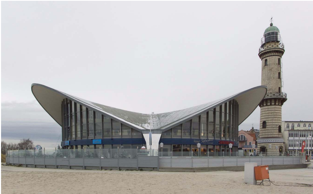
Abb.1: Der Teepott, Rostock-Warnemünde, 2009