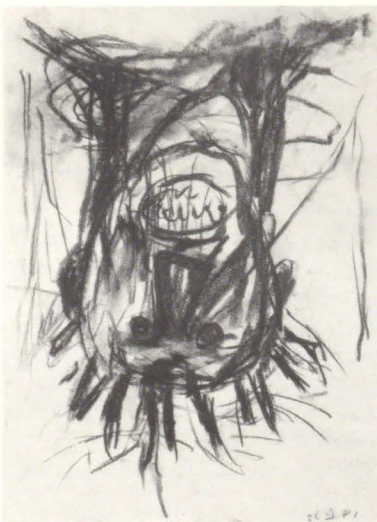
Georg Baselitz Kopf (Sänger), 1981. Kohle

Diese Ausstellung veranschaulicht, in welcher Weise Baselitz aus der Ablehnung des Tachismus und der abstrakten Malerei heraus, ein überaus eigenständiges Oeuvre zu entwickeln vermochte. Eigenständig insofern, als er spätestens 1966 beginnt, den Stellenwert des Bildmotivs, des klassischen Bedeutungsträgers in der gegenständlichen Kunst, zu verändern. Das Bildmotiv wird hinfort den Gesetzen der Malerei unterworfen, denn Malerei bedeutet für Baselitz in erster Linie Stofflichkeit, Materie, Sinnlichkeit. Baselitz' Streben nach der Verwirklichung der Malerei als Malerei führte schließlich 1969 zur Umkehrung seiner Motive im Bild. Diese Umkehrung schuf ihm die Freiheit, sich bedingungslos mit malerischen Problemen auseinanderzusetzen. So ist ein Kopf z.B.