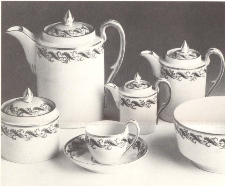
Kaffee- bzw. Teeservice, Fürstenberg, um 1820. (Inv.-Nr. Ke 4462 a-s)