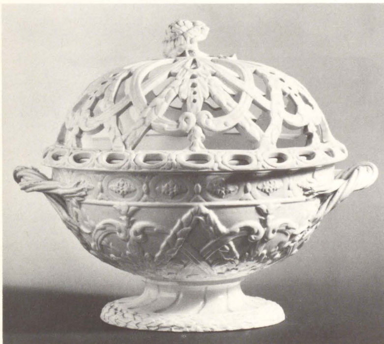
Terrine, Steingut, Wedgwood, um 1780. (Inv.-Nr. Ke 4461)

Durch zwei bemerkenswerte Leihgaben aus Privatbesitz konnte das Germanische Nationalmuseum in diesem Jahr seine Porzellan- und Steingutsammlung erweitern.