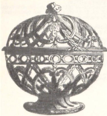
Aus: Wolf Mankowitz: Wedgwood. London 1966, S. 78.

zen sich somit in ihrer Schlichtheit und Unkompliziertheit, die dem Empirestil eigen ist. Für die in ein paar Jahren geplante Ausstellung „Kulturgeschichte der Tasse“ ist dieses Service eine noble Bereicherung.