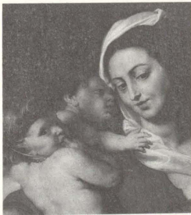
Peter Paul Rubens, Caritas (Detail)

Ausstellung im Germanischen Nationalmuseum vom 18. 2. bis 23. 4. 1989