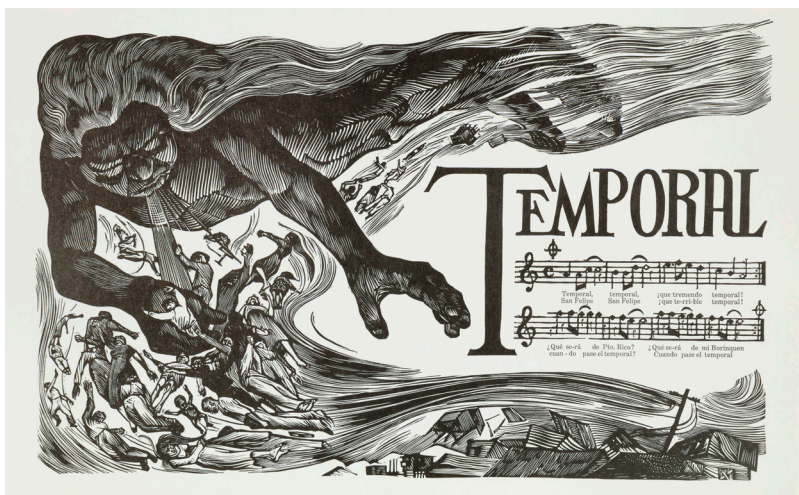
Fig. 1: Rafael Tufiño Figueroa: El Temporal , linogravado, 1954. Instituto de Cultura Puertorriqueña Collection, San Juan, Puerto Rico.