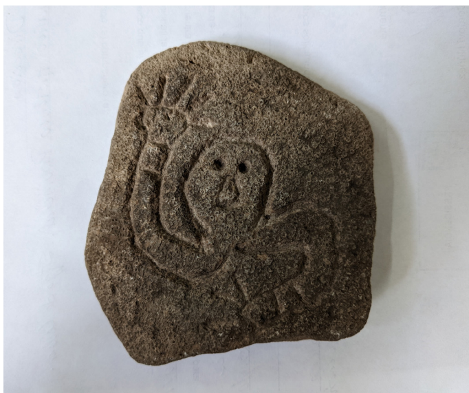
Fig. 4: Ídolo de piedra (figura antropomorfa con brazos que rodean una cabeza central en sentido contrario a las agujas del reloj) , piedra incisa, fecha desconocida.