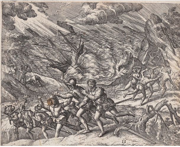
Fig. 6: Theodor de Bry: Ein schrecklich und unerhörtes Ungewitter , grabado, circa 1594, de Benzoni y De Bry: America (Band 4).