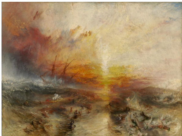
Fig. 11: J.M.W. Turner: Slave Ship (Slavers Throwing overboard the Dead and Dying—Typhon coming on), óleo sobre lienzo, 1840.