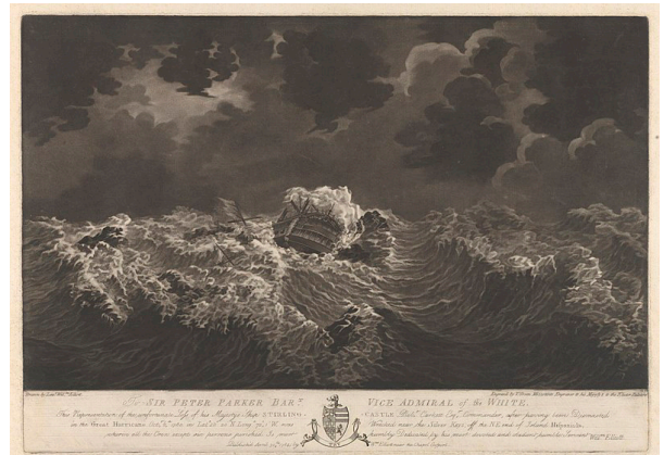
Fig. 10: Valentine Green según William Elliot: To Sir Peter Parker.... Egmont Robt Fanshawe Esqr, Commander, when dismasted in the Great Hurricane October 11th, 1780 near the Island St Lucia , grabado, 1784.