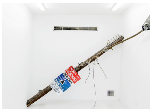
Fig. 15: Gabriela Torres-Ferrer: Untitled (Valora tu mentira Americana) , 2018. Poste eléctrico de madera devastado por huracanes con propaganda de la estadidad. 116" x 118" x 122". Colección de César y Mima Reyes. Cortesía de la artista y Embajada, San Juan, Foto: Raquel Pérez-Puig.