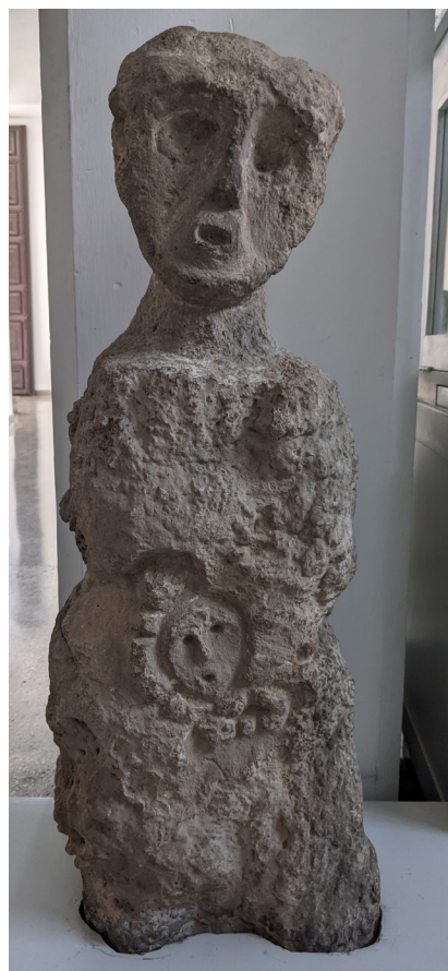
Fig. 3: Ídolo de piedra (con figura antropomorfa en el abdomen) , piedra incisa, fecha desconocida.