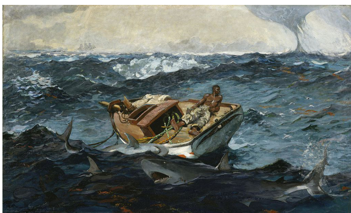
Fig. 12: Winslow Homer: The Gulf Stream , óleo sobre lienzo, 1899.