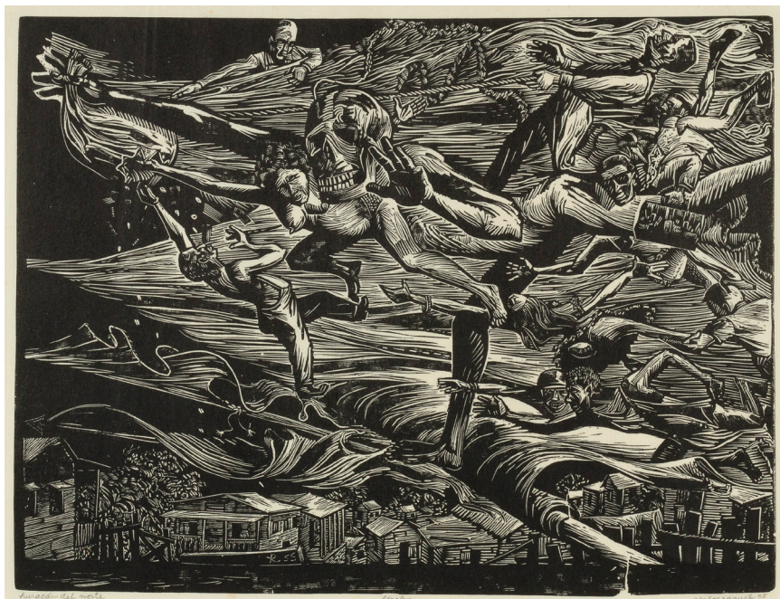
Fig. 13: Carlos Raquel Rivera: Huracán del Norte , linograbado, 1955.