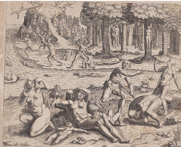
Fig. 7: Theodor de Bry: Indianer können der Spanier Tyrannen nicht länger leiden , grabado, circa 1594, de Benzoni y De Bry: America (Band 4). Cortesía University of Heidelberg Digital Library. https://doi.org/10.11588/diglit.8296