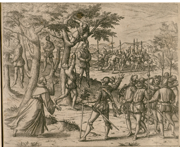
Fig. 8: Theodor de Bry: Columbus straffet die aufrührische Spanier , grabado, circa 1594, de Benzoni y De Bry: America (Band 4). Cortesía University of Heidelberg Digital Library. Available at https://doi.org/10.11588/diglit.8296