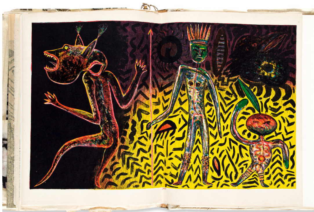
Abb./Fig. 2: Frieder Heinze und/y Olaf Wegewitz: Ausgeweitet, Irisdruck von Zinkplatte/Impresión en iris a partir de plancha de zinc, 1984 (ünäulütü: 38).