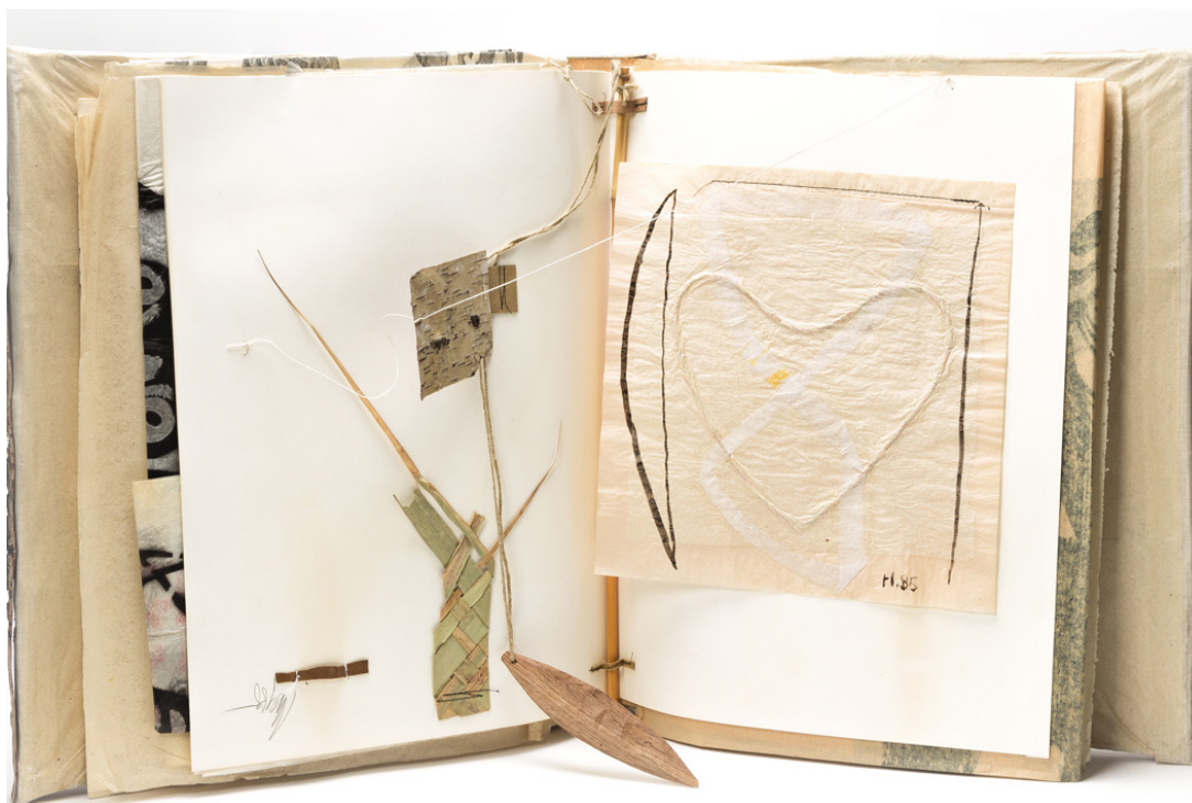
Abb./Fig. 3: Frieder Heinze und/y Olaf Wegewitz: Kulturvergleich I, Palmblattflechtarbeit, Schwirrholz, Birkenrinde, Papiercollage/Tejido de hojas de palmera, bramadera, corteza de abedul, collage de papel, 1984 (ünäulütü: 60).