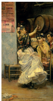
Fig. 1. José García Ramos, Bulerías , 1884, Óleo sobre lino, 52 x 28 cm, Museo de Bellas Artes, Sevilla (detalle). Formanek, Verena y Peter Pakesch (Eds.). Blicke auf Carmen. Goya – Courbet – Manet – Nadar – Picasso. Catálogo de exposición Landesmuseum Joanneum Graz 2005. Colonia: Walther König, 2005, 267.