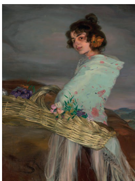
Fig. 5. Ignacio Zuloaga, Gitana florista , 1902, Óleo sobre lino, 116.8 x 90.1 cm, Privatbesitz. Formanek, Verena y Peter Pakesch (Eds.). Blicke auf Carmen. Goya – Courbet – Manet – Nadar – Picasso. Catálogo de exposición Landesmuseum Joanneum Graz 2005. Colonia: Walther König, 2005, 264.