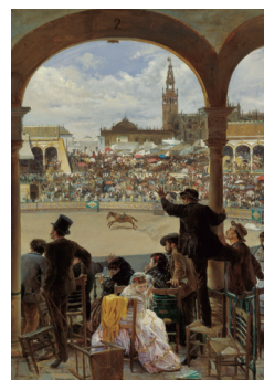
Fig. 4. José Jiménez Aranda, Un lance en la plaza de toros , 1870, Óleo sobre lino, 51 x 46 cm, Málaga, Museo Carmen Thyssen. Botois, Ozvan. Tauromachie. De l'arène à la toile . Vanves: Hazan, 2017, 35.