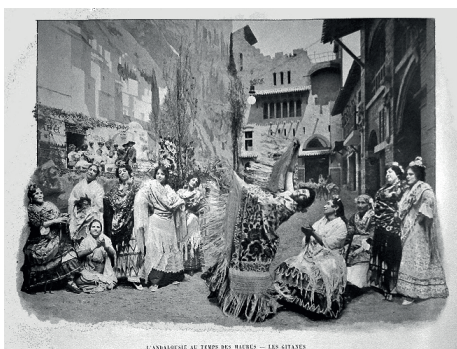
Fig. 3. L'Andalousie au temps des Maures. Les Gitanes , Postal: El Sacromonte , Weltausstellung in Paris, 1900. http://journals.openedition.org/mcv/docannexe/image/2245/img-5.jpg (26.08.2020).