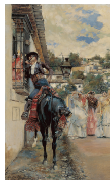
Fig. 6. Cortejo español , 1885, Óleo sobre lino 54.3 x 33.5 cm, Museo Thyssen-Bornemisza, Madrid. Formanek, Verena y Peter Pakesch (Eds.). Blicke auf Carmen. Goya – Courbet – Manet – Nadar – Picasso. Catálogo de exposición Landesmuseum Joanneum Graz 2005. Köln: Walther König, 2005, 264.