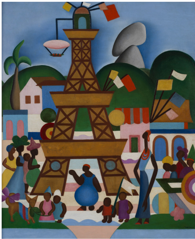
Fig. 2. Tarsila do Amaral. Carnaval em Madureira , 1924, óleo sobre tela, 29 15/16 x 25 pol. (76 x 63 cm). Collection of the José e Paulina Nemirovsky Foundation, Pinacoteca do Estado de São Paulo. Catálogo Tarsila do Amaral: Projeto Cultural Artistas do Mercosul , Fundação Finambrás, 1998, 78.