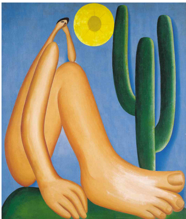
Fig. 4. Tarsila do Amaral. Abaporu , 1928, óleo sobre tela, 33 7/16 x 28 3/4 pol. (85 x 73 cm). Coleção MALBA, Museo de Arte Latinoamericano de Buenos Aires. Catálogo Tarsila do Amaral: Projeto Cultural Artistas do Mercosul , Fundação Finambrás, 1998, 111.