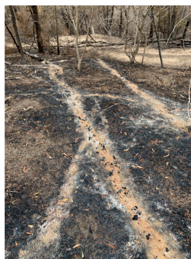
Fig. 7. Fotografia de "fantasmas de árvores" no sul de New South Wales. Fotografia de Gavin Butler, Austrália, janeiro de 2020. Direitos autorais da Vice Magazine. https://www.vice.com/en/article/pkepdn/tree-ghosts-remain-burnt-out-australia-bushfires