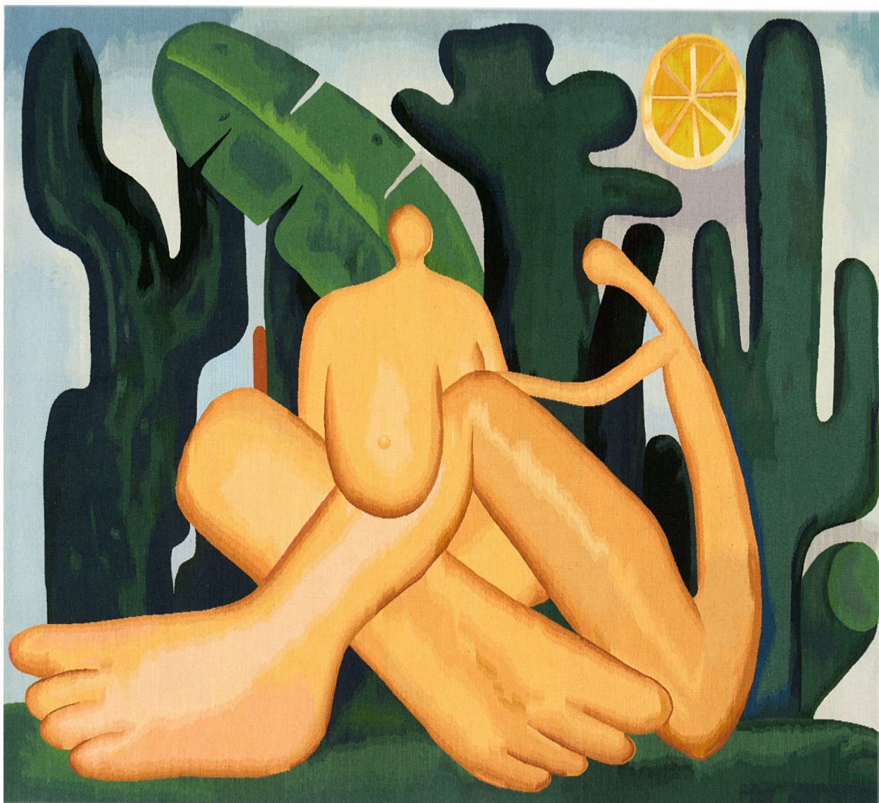
Fig. 5. Tarsila do Amaral. Antropófagia, 1929, óleo sobre tela, 49 5/8 x 55 15/16 pol. (126 x 142 cm). Collection of the José e Paulina Nemirovsky Foundation, emprestado para Pinacoteca do Estado de São Paulo. Catálogo Tarsila do Amaral: Projeto Cultural Artistas do Mercosul , Fundação Finambrás, 1998, 133.