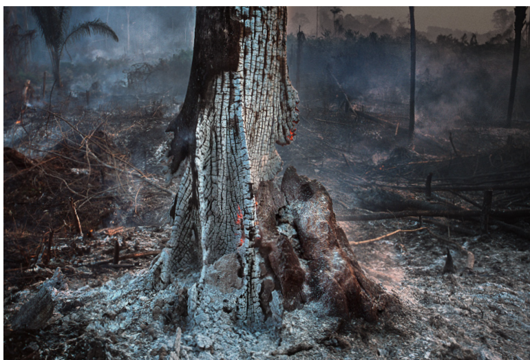
Fig. 6. Fotografia das consequências dos incêndios na Amazônia. Fotografia de Araquém Alcantara, parte do ensaio "A ferro e fogo", Brasil, agosto de 2019. Direitos autorais de Araquém Alcantara. https://midianinja.org/araquem-alcantara/a-ferro-e-fogo/ .