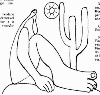
Desenho de Tarsila 1928 - De um modelo que figurará na sua proxima expozição de junho na galeria Perceir, em Paris.

Já tinhamos communismo. Jí nhamos a lin surrealista. A e de de outro. Catiti Catiti Imara Notia Notia Imara Ipejú A magia e a vida. Tinhamos a lição e a distribuição dos bens p sicos, dos bens moraes, dos bens gnarios. E sabiamos transpor o r terio e a morte com o auxilio de gumas formas grammaticaes. Perguntei a um homem o que o Direito. Elle me respondeu era a garantia do exercicio da i sibilidade. Esse homem chamav: Galli Mathias. Comi-o Só não ha determinismo - ond misterio. Mas que temos nós, isso?