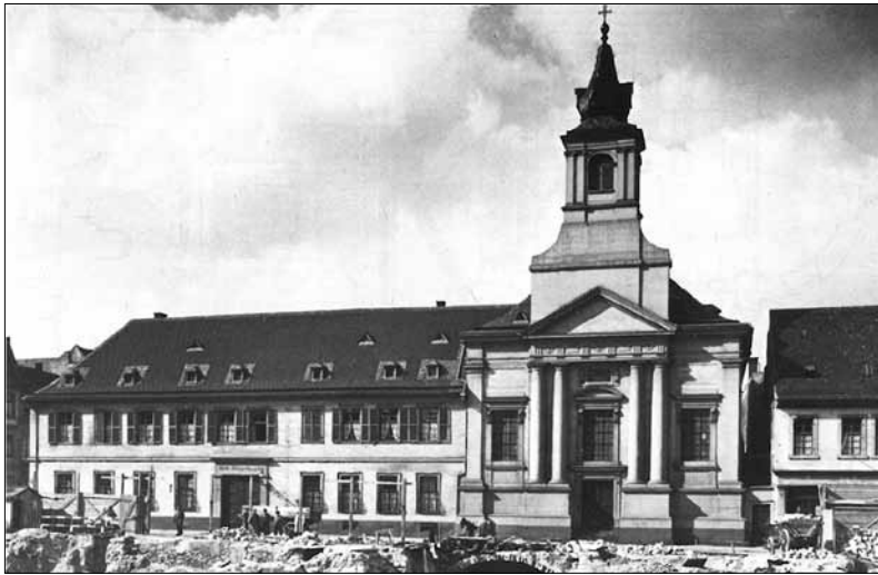
Abb. 6: Mannheim, E6,1, Anwesen des Freiherrn Ulner von Dieburg. Für den Bau der 1788 geweihten Spitalkirche wurde die ältere Bebauung auf dem Grundstück abgebrochen. Foto von 1935.