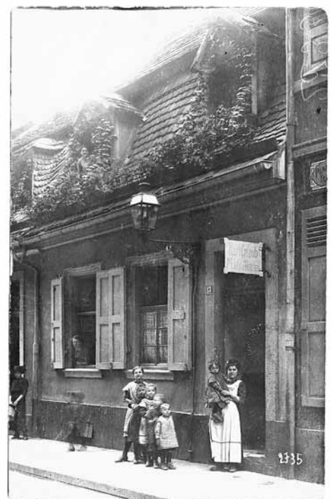
Abb. 2: Mannheim, B4,13. Frieda Eichhorn, Garderobenfrau im Nationaltheater, vor dem eingeschossigen Wohnhaus von 1725. Foto von 1913.

13 Abfallgrube: Befundnummern BW2007-10-278, 279, 296, 337 und 339. Primärverfüllung der Latrine: Befundnummern BW2007-10-268, 269, 270, 292