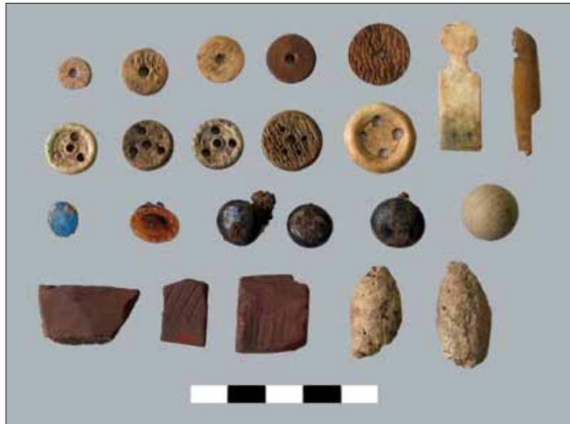
Abb. 5: Mannheim, C4,8. Auswahl von Funden.

spiegel). Von einer Schneiderei blieben diverse Knöpfe aus Knochen und Glas, zahlreiche Fragmente von Schneiderkreide, Stecknadeln, eine Gürtelschnalle mit Textilresten, Fingerhüte sowie eine breite, gemarkte (Woll-)Nadel erhalten. Wetzsteine aus Schiefer und Sandstein dienten allgemein als Schleifgeräte für Klingen. Holzverarbeitenden Tätigkeiten dienten Eisennägel, die in großer Zahl und in verschiedenen Längen angetroffen wurden.