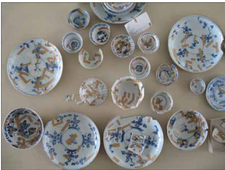
Abb. 7: Mannheim, E6,1. Arbeitsaufnahme von Tellern und Koppchen aus Porzellan (China, Meißen).

töpfe Westerwälder Art, 17,5 kg Flachglas, ca. 35 kg Hohlglas und drei Münzen, davon ein Max d'or von 1720 (Maximilian II. Emanuel). Ergänzt wird das außergewöhnliche Fundensemble durch 267 vollständig oder fragmentarisch erhaltene Briefsiegel aus rotem Siegelack. Wände und Decken der abgebrochenen Wohnhäuser waren laut Ausweis der Funde mit Stuck, Kalkstein- und Marmorplatten dekoriert.