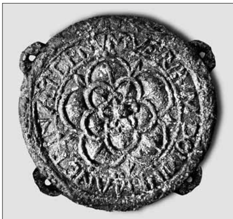
Abb. 2: Rekonstruktion des ursprünglichen Gussmodells des Abzeichens aus Hamm mit vier Randösen.

Vom 10. bis zum frühen 16. Jahrhundert war dies nicht notwendig gewesen, denn bis auf Juden 7 waren alle Menschen bereits als Kinder getauft worden. Dies für alle sichtbar zu zeigen war daher nicht erforderlich, solange es keine religiösen Veränderungen gab. War deshalb das bisher unikat, in Hamm gefundene Abzeichen „nur“ ein protestantisches – religiöses – Gesinnungsabzeichen der „Neugläubigen“ aus der Frühphase der Reformation, also aus den Jahren zwischen 1517 und etwa 1530/1540? Damit wären die anfänglich von archäologischer Seite gestellten Fragen nach Funktion und Datierung eigentlich zufriedenstellend beantwortet und weiterführende Forschungen nicht erforderlich. Man mag sich mit diesen Aussagen begnügen, aber vielleicht verbergen sich hinter dem unscheinbaren Fund weitere historische – und somit vielleicht auch politische – Aspekte, denn es dürfte ehemals sicherlich zahlreiche weitere