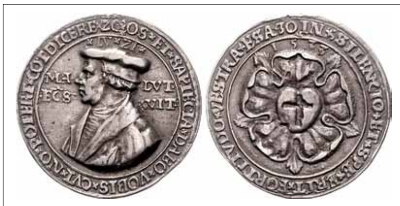
▷ Abb. 7: Medaille auf Martin Luther mit der Darstellung der Lutherrose. Stempel Hieronymus Magdeburger (?), Silber gegossen, datiert 1533. Dm. 41 mm, 13,75 g.

Daher erscheint das Motto bis in diese Zeit – in unterschiedlicher Form – beispielsweise auch auf Münzen, Medaillen, Waffen 14 , Rüstungen, Fahnen 15 oder Kanonen der beteiligten Fürstenhäuser sowie auf protestantischen Schriften und Flugblättern der Reformatoren, Holzschnitten oder Kupferstichen mit dem Portrait Martin Luthers oder der protestantischen Fürsten sowie auf der protestantisch geprägten Zuchtordnung der Stadt Münster 16 (Abb. 5). Das Auftreten auf einem an der Kleidung getragenen Abzeichen, das offenbar die Sache der Protestanten beziehungsweise Martin Luthers „anpreisen“ sollte, passt daher gut in das Bild einer umfassenden „Werbestrategie“: Allein die Heilige Schrift ist die Grundlage und Autorität des christliche Glaubens.