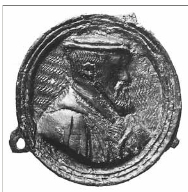
Abb. 12: Hutagraffe (Abzeichen) mit dem Bildnis Kaiser Karls V. (1500–1558). Undatiert, ca. 1548/1555. Bronzeguss, Dm. 39 mm.