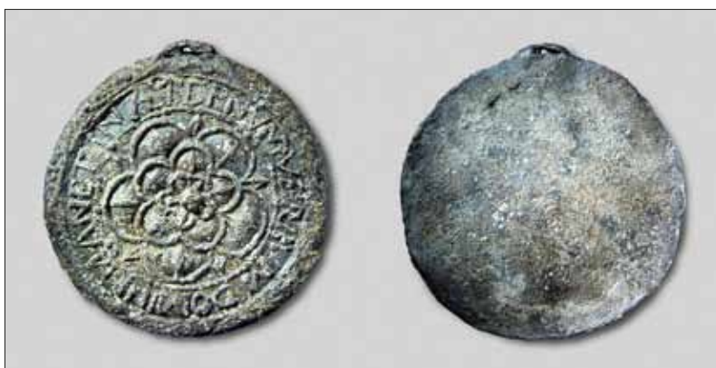
Abb. 1: Abzeichen mit der Darstellung einer Rose und der Devise „VERBUM DOMINE MANET IN ÆTERNVM“, undatiert. Blei-Zinn-Legierung, einseitig gegossen, Dm. ca. 56 mm, 40,08 g. Fundort Hamm (Westfalen), Privatbesitz.