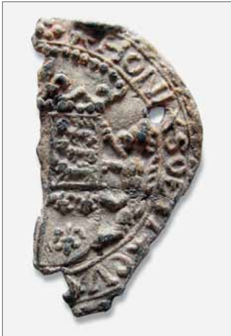
△ Abb. 18: Fragment eines Abzeichens mit der Darstellung des Wappens und der Devise des englischen Königshauses nach dem Motto des englischen Hosenbandordens „HONI SOEIT QVI MAL V PENSE“. Mitgegossene Ösen entfernt, nachträglich mindestens dreimal gelocht. Undatiert, um 1570/1600. Blei-Zinn-Legierung, einseitig gegossen, Dm. ca. 3,2 mm, 4,04 g, genauer Fundort unbekannt, vermutlich Ungarn (Privatbesitz).