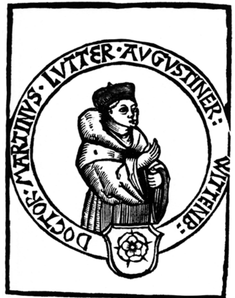
Abb. 8: Die Rose als Familienwappen Martin Luthers. Holzschnitt mit dem ältesten Bildnis des Reformators, Titelvignette der Flugschrift Ein Sermon geprediget tzu Leipßgk , Leipzig 1519.

Der Kaiser hatte bereits 1547 die Reichsacht gegen Magdeburg verhängt, die Stadt wurde von Kurfürst Moritz von Sachsen (1521–1553) – auf Kosten des Reichs – vom 16. September 1550 bis zum 9. November 1551 ohne Erfolg belagert (Abb. 9). 29 Ziel war die Unterwerfung der Stadt und damit die Schwächung der Sache der Protestanten. Während dieser Zeit wurden in der Stadt, vor allem zur Finanzierung der Verteidigung und Bezahlung der Landsknechte, silberne Notmünzen mit den Jahreszahlen 1550 und 1551 geprägt (Abb. 10). 30 Da sich der Belagerer Moritz von Sachsen jedoch