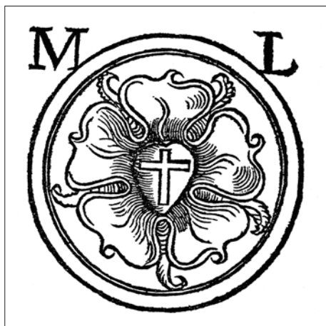
△ Abb. 6: „Schutzmarke“ Lutherrose auf Schriften des Reformators Martin Luther seit 1524. Holzschnitt.