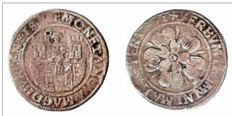
Abb. 10: Notgulden der Stadt Magdeburg mit der Darstellung der Magdeburger Rose und der Devise „VERBVM MA[NET] IN AETER[NUM]“. Geprägt während der Belagerung Magdeburgs, datiert 1551. Silber, Dm. 36 mm, 15,29 g.

Die Bürger brachten mit der Inschrift ihre protestantische Gesinnung zum Ausdruck, die Wahl der Rose als sichtbares Sinnbild könnte demnach als Anspielung auf die Lutherrose verstanden werden. Bild und Text wurden erstmals zusammen zu einem Statement für die protestantische Sache und folglich ein Protest gegen das vom Kaiser verhängte Augsburger Interim. Die Devise „VERBVM DOMINI MANET IN ETERNVM“ wurde in der Folgezeit auch zum allgemeinen Wahlspruch der Stadt Magdeburg