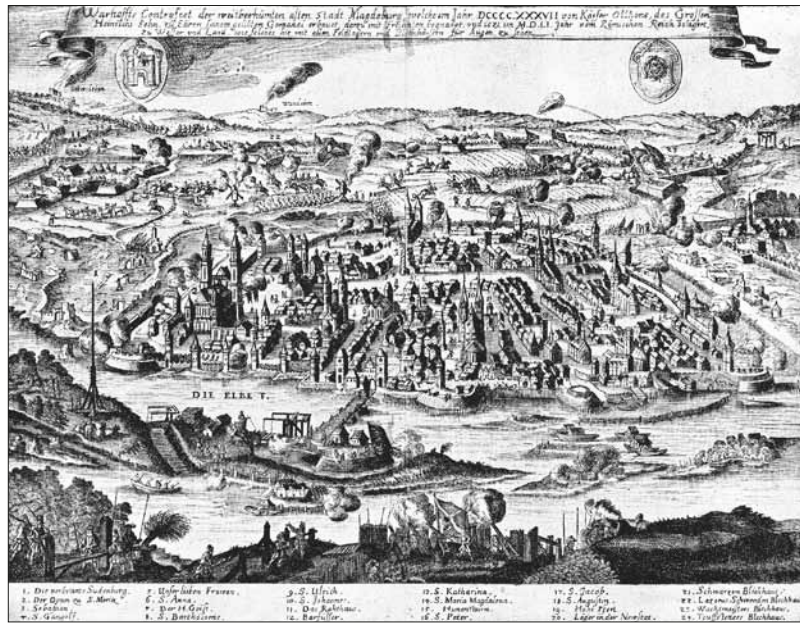
Abb. 9: Ansicht der Stadt Magdeburg während der Belagerung 1551 mit den beiden Stadtwappen (Jungfrau/Magd über einer Burg beziehungsweise Rose). Anonymer Kupferstich, um 1555/1560.

den kaiserfeindlichen Reichsfürsten anschloss, wechselte er die Partei und die Bürger Magdeburgs öffneten ihre Stadtpforten und huldigten ihm feierlich. Da die zuvor verausgabten Notmünzen folglich ungültig wurden, münzte man die meisten bereits nach kurzer Zeit um, so dass sie heute relativ selten sind.