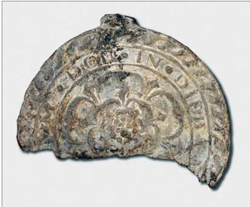
▷ Abb. 19: Fragment eines Abzeichens mit der Darstellung einer Rose und der Devise „[DA PAC]EM DOM[INE] IN DIEB[VS NOSTRIS]“. Undatiert, um 1540/1570. Blei-Zinn-Legierung, einseitig gegossen, Dm. ca. 54 mm, 20,22 g, Fundort Emden, Archäologischer Dienst der Ostfriesischen Landschaft.

für diese Abzeichen auch eine spätere Datierung in die Zeit zwischen 1570 und 1600 in Betracht. Wiederum handelt es sich gewissermaßen um politische „Parteiabzeichen“ jener Söldner, die – möglicherweise als eigene Einheit – an kriegerischen Auseinandersetzungen teilnahmen und es im Kampf verloren oder denen sie nach ihrem gewaltsamen Tod mit der Kleidung entwendet wurden. Die Nähe Emdens zu den damals beteiligten Territorien würde historisch gut zu den Ereignissen und zum Fund des Abzeichens dort passen. Man zeigte seine Herkunft und Zugehörigkeit zu einem bestimmten Territorium sowie damit verbunden auch seine politische Einstellung, hier die Anhängerschaft zu König Jakob VI. von Schottland aus dem Haus Stuart (1566–1625), der ab 1603 bis zu seinem Tod zusätzlich als Jakob I. König von England und König von Irland war.