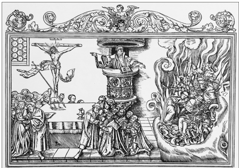
Abb. 14: Holzschnitt „Abendmahl der Evangelischen und Höllensturz der Katholiken“ von Lucas Cranach dem Jüngeren (1515–1586), um 1540.

Wie die Durchlauchtigen Damen waren auch die Sieghaften Helden ein sehr beliebtes Thema auf Ofenkacheln, wie ihre weite Verbreitung etwa bis zum Elsass und nach Skandinavien sowie Osteuropa anzeigt. Und wie