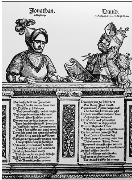
△ Abb. 11: Holzschnitt „Die Erenport der zwelff Sieghafften Helden des alten Testaments“ aus den beginnenden 1530er-Jahren von Georg Pencz mit Dichtung von Hans Sachs. Detail mit Jonathan und König David.