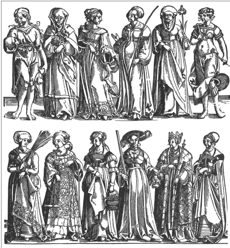
Abb. 4: Holzschnitt, „Der ehrenspiegel der zwölf durchleuchtigen frauen des alten testaments“ aus dem Jahr 1530 von Erhard Schoen mit Dichtung von Hans Sachs.