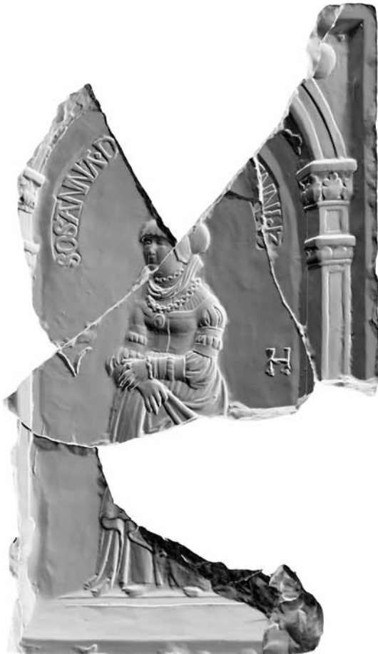
Abb. 1: Modelrest mit Sarah vom Wilhelm-Leuschner-Platz in Leipzig (L-124; Ident.-Nr. 00262366, Archäologisches Archiv Sachsen). Rekonstruierte Höhe 30,6 cm, Breite 22,7 cm. Scan des Modells für den Druck digital bearbeitet (Positiv und gespiegelt).