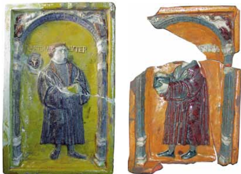
Abb. 7 und 8: Polychrom glasierte Kacheln mit Martin Luther und Jan Hus aus dem Stralsund Museum (Inv.-Nrn. A1996:0139 und A1996:0083). Höhe 29 cm, Breite 18,6 cm beziehungsweise Höhe 28,7 cm, Breite 19 cm.