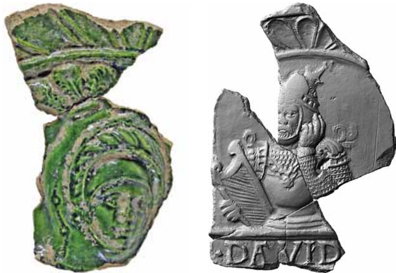
▷ Abb. 13: Unglasierter Kachelrest mit König David vom Wilhelm-Leuschner-Platz in Leipzig (L-113; Ident.-Nr. 00325257, Archäologisches Archiv Sachsen). Erhaltene Höhe 16 cm, erhaltene Breite 11,1 cm.

Öfen in den Festsälen der 1637 zerstörten Moritzburg zu Halle 13 sowie mit Abigail vom Schlossberg von Lebus, Lkr. Märkisch-Oderland, 14 bekannt. Die Stücke dürften die vorliegende Serie ergänzen, wengleich sie sich in der Architekturrahmung unterscheiden.