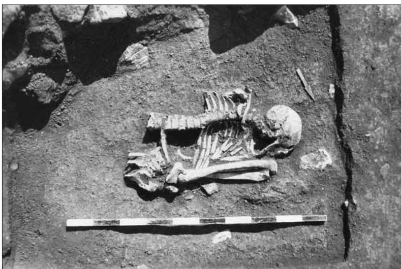
Abb. 5: Galgenberg Alkersleben, Grab 58. Fixierung im Grab.