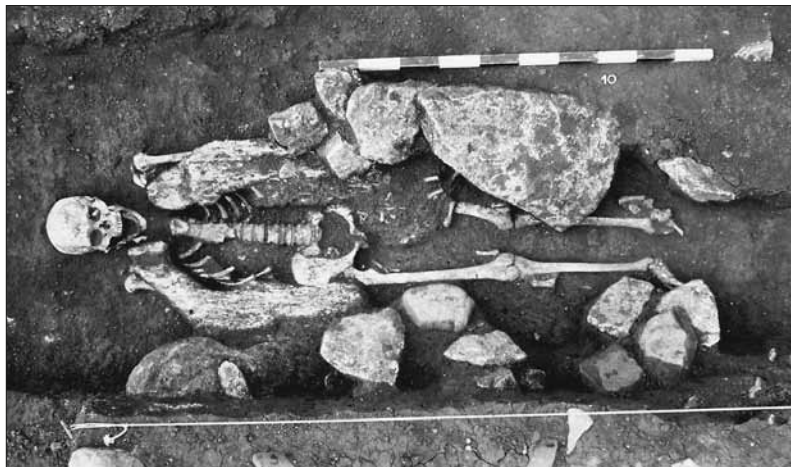
Abb. 7: Galgenberg Alkersleben, Grab 10. Mann, adult, Beschweren mit Steinen.

seinem Grab nicht entkommen können (Abb. 7). 41 Grab 19 fiel archäologisch bereits durch die nach rechts abgewinkelten Beine als Hockergrab auf. Das Individuum war möglicherweise erhängt worden. Die Grablege zeigt einen Stein im Brustbereich an. Als Einzelfall käme hier eine zufällige Grabverfüllung mit Stein in Betracht, die gleiche Situation findet sich hier jedoch bei insgesamt fünf Toten. Ein Umstand, der ein absichtliches Deponieren infolge magischer Abwehrhandlungen möglich erscheinen lässt. Eine weitere, dritte, auffällige Art der Steinsetzung ist dem Individuum aus Grab 5* beigegeben worden. Eine massive Steinpackung aus Grenzdolomiten und Muschelkalkstein im Brustbereich führte dazu, dass der Oberkörper des Mannes um etwa 0,3 m absank. Der aufrechtstehende rechte Unterarm dokumentiert diesen Prozess deutlich. Auch hier wurden die Steine gezielt auf dem Oberkörper abgelegt, lediglich die Anzahl der Steine ist hier wesentlich höher. Insgesamt ließen sich bei zwölf Skeletten sicher Steindeponierungen feststellen. Allein das Begräbnis in ungeweihter Erde vermochte den Lebenden keinen Schutz zu vermitteln, der christlichen Gemeinschaft in Alkersleben war es wichtig, die Toten darüber hinaus zu bannen.