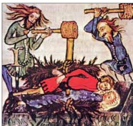
Abb. 1: Lebendigbegraben und Pfählen (Miniatur, Codex Statutorum Zvicciensium, 1348).