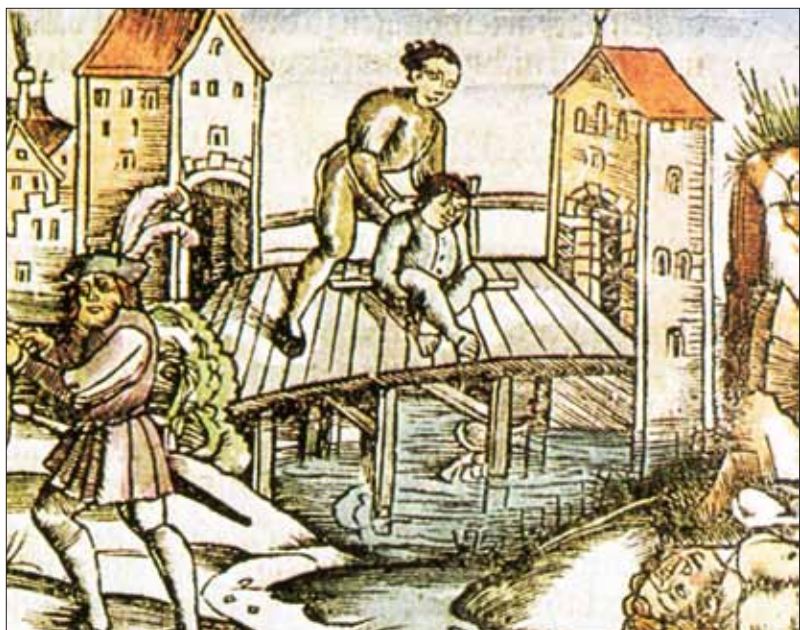
Abb. 3: Ertränken (Miniatur „Neu Layenspiegel“ von Ulrich Tengler, 1509).