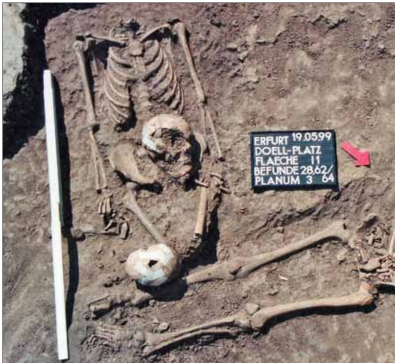
Abb. 6: Richtstätte Erfurt, Grab 28. Enthaupten.

die morphologische Spur bei der Benutzung eines Spatens, der zudem von vorn auf die Halswirbelsäule einwirkt. An den betroffenen Wirbeln können sich Bruchmuster mit Abspaltung von Knochenteilen zeigen, die das Einwirken halbscharfer Gewalt von vorn dokumentieren.