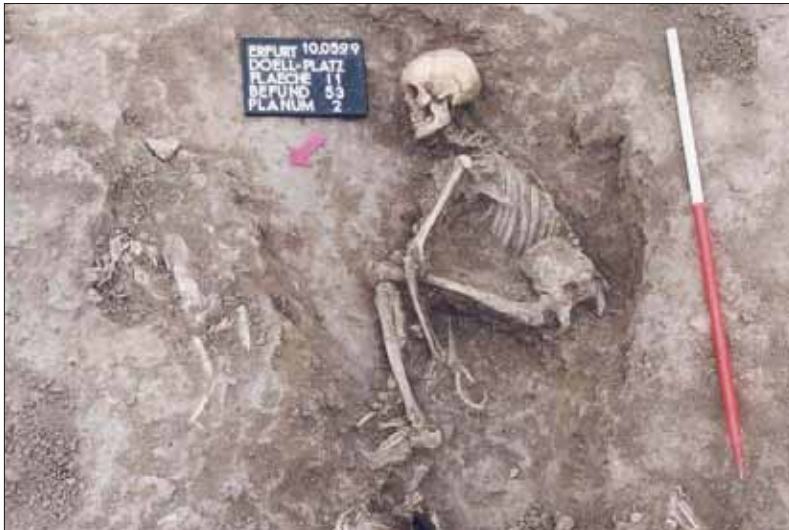
Abb. 4: Richtstätte Erfurt, Grab 53. Weiblich, adult, Ertränken.

Grund kann nicht zweifelsfrei ausgeschlossen werden, dass die übrigen fehlenden Knochen und nicht dokumentierten Befundlagen zweckdienliche Hinweise auf eine anderweitige Behandlung im Zusammenhang mit einer Todesstrafe (zum Beispiel Ertränken) liefern könnten. Die apotropäische Handlung am Skelett kann hier nur als möglich angesehen werden.