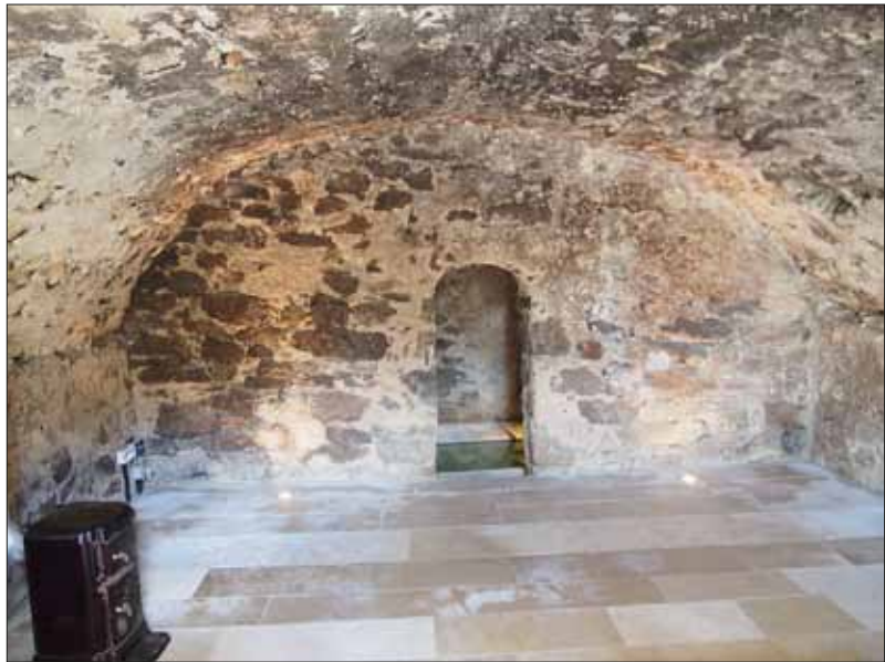
Abb. 5: Kellerraum 1 mit sekundärer Wölbung und Trennwand zu Kellerraum 2.