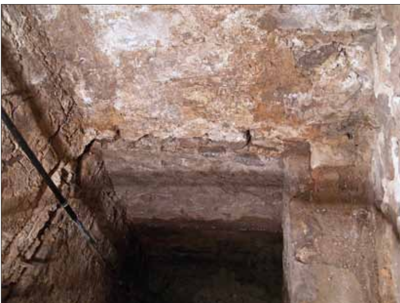
Abb. 4: Blick in das Tauchbecken der Schachtmikwa mit Grundwasser.