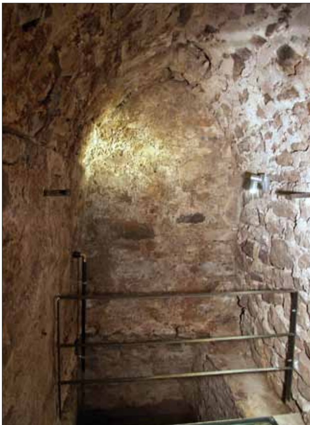
▽ Abb. 9: Westliche Schmalseite Kellerraum 2 mit zugemauertem ehemaligem Zugang zum Tauchbad.