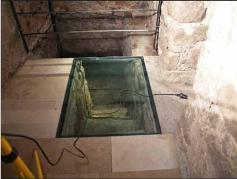
Abb. 3: Zugang zur Mikwa mit Glasabdeckung

tonne überwölbt, die dem Raum einen bescheidenen sakralen Charakter verleiht. Spätestens im 17. Jahrhundert, diente die Mikwe als Brunnen für die Gastwirtschaft. Dafür wurde über dem Wasserbecken eine größere, unregelmäßige Öffnung in die Spitztonne eingebrochen. Es ist zu vermuten, dass damals keine jüdische Gemeinde in Rauenzell mehr bestand.