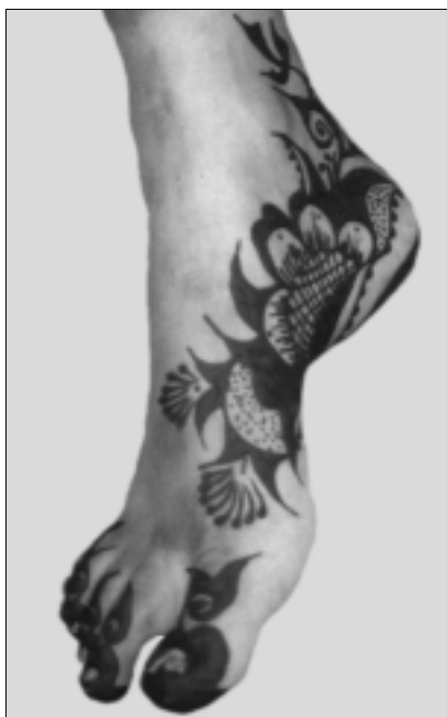
Abb. 1: Aufgetragene Henna-Paste auf dem Fuß einer Braut

Es gibt verschiedene Methoden, Hennamalerei haltbar zu machen: Die einfachste, jedoch langwierigste ist, die Farbe mehrmals übereinander aufzutragen und sie dazwischen jedesmal lange (beim ersten Mal fünf Stunden, danach eine) einwirken zu lassen. Die gebräuchlichste Art, Henna zu fixieren, ist das „Räuchern“: Nach dem Trocknen der aufgetragenen Farbe wird diese mit Wasser heruntergewaschen und die blaßbraune Färbung, die dann auf der Haut sichtbar ist, mit Zitronensaft beträufelt. Danach geht die Braut zu dem Feuerloch, das sich in