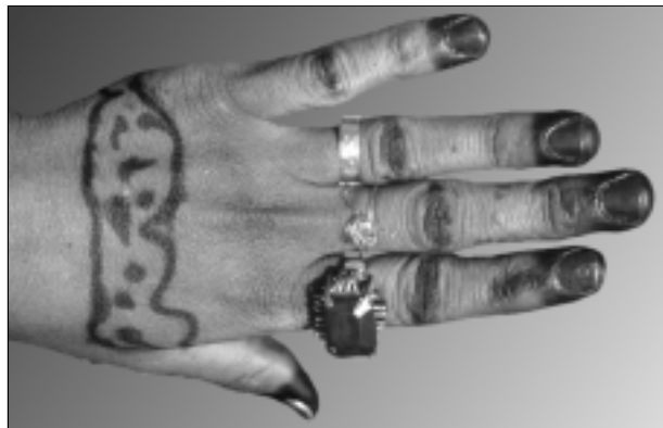
Abb. 2: Hand einer Jungver- mählten in der Butana

stammt aus eigener Erfahrung und aus Gesprächen mit Sudanesischen, denen ich für die Bereitwilligkeit zu erzählen und die phantasievolle Gestaltung meiner Hände an dieser Stelle danken möchte. •