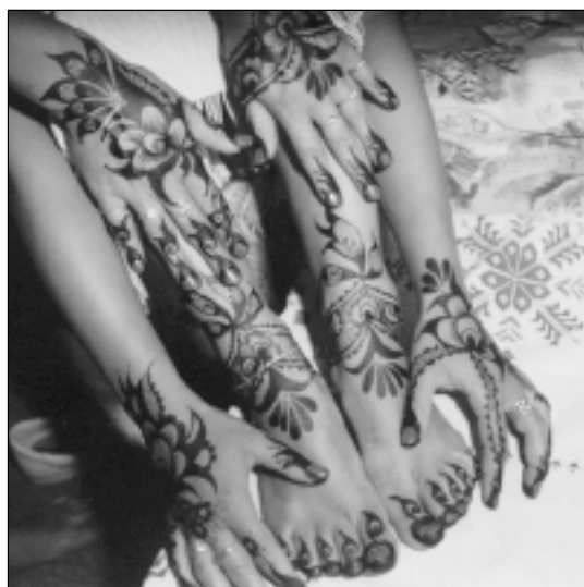
Abb. 3: Gefärbte Handrücken einer Braut in Khartoum

Kennedy, J.: NUBIAN CEREMONIAL LIFE; Kairo 1978