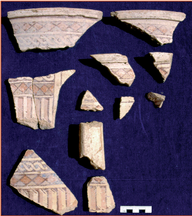
Farbabb. 1: Scherben polychrom bemalter Keramik aus K 14, FNR I.8/9-14-2.

Blick vom Gebel Musa über das Gebiet des 4. Nilkataraktes im Dar al-Manasir mit der typischen räumlichen Verteilung von Wohngebäuden, Feldern und Dattelpalmen entlang des Nils.