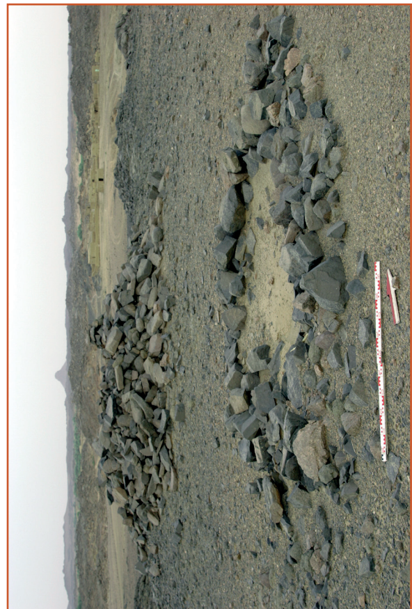
Farbabb. 4: KIR 273: Ausschnitt des Friedhofs, Tumulus 1 und 2.