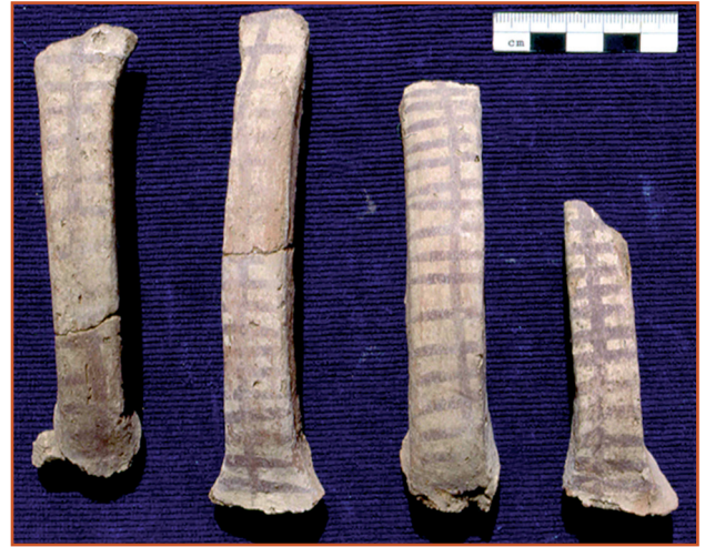
Farbabb. 2: Henkelfragmente polychrom bemalter Keramik aus K 14, FNR I.8/9-14-2, (Foto: Mucha).