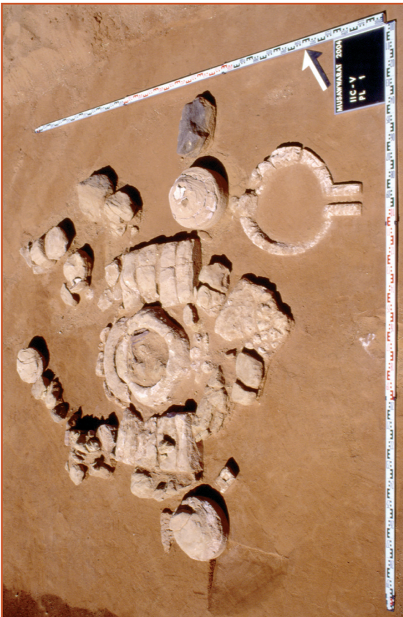
Farbabb. 3: Objekt IIC-V.