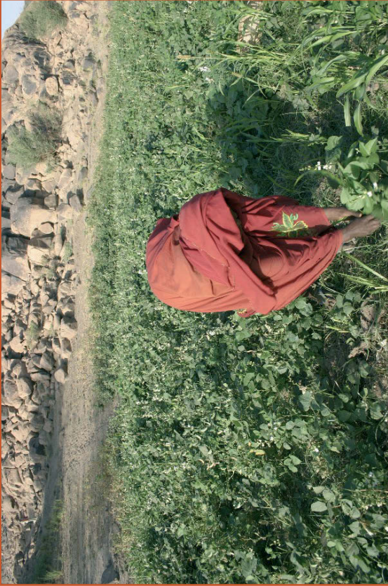
Farbabb. 2: Frau aus Kərbekān beim Schneiden von Gras im Wadi.