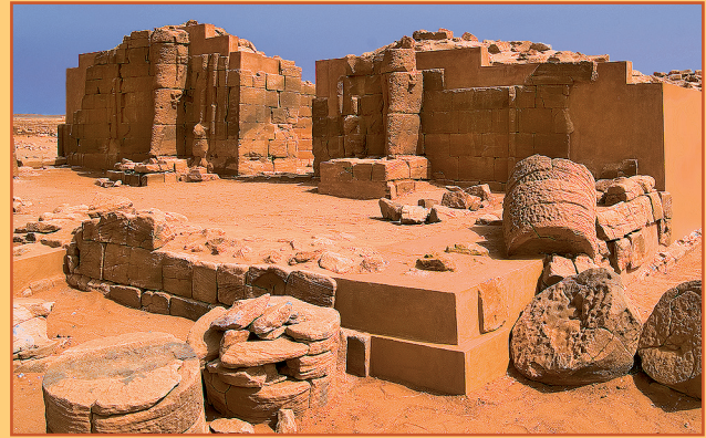
Farbabb. 8: Ansicht der SE-Ecke nach der Sanierung 2008.