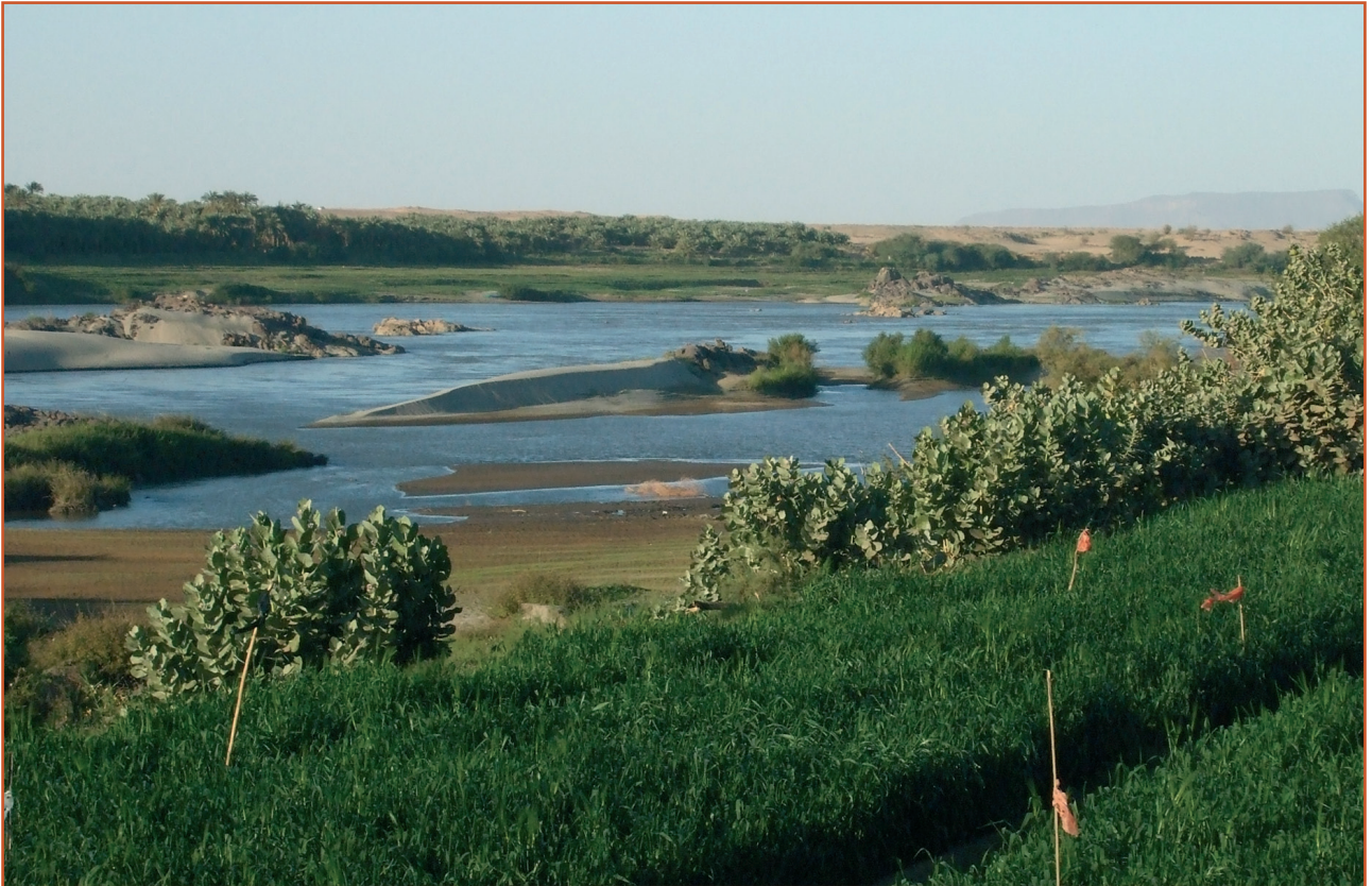
Farbabb. 5: Der nördliche Arm des Nils nahe der Westspitze der Insel bei Ras al Jazira.