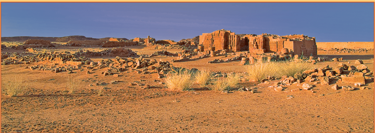
Farbabb. 11: Die Mauer 304/305 und der Bereich des Durchgangs 304-305 vor ihrer Wiedererrichtung.