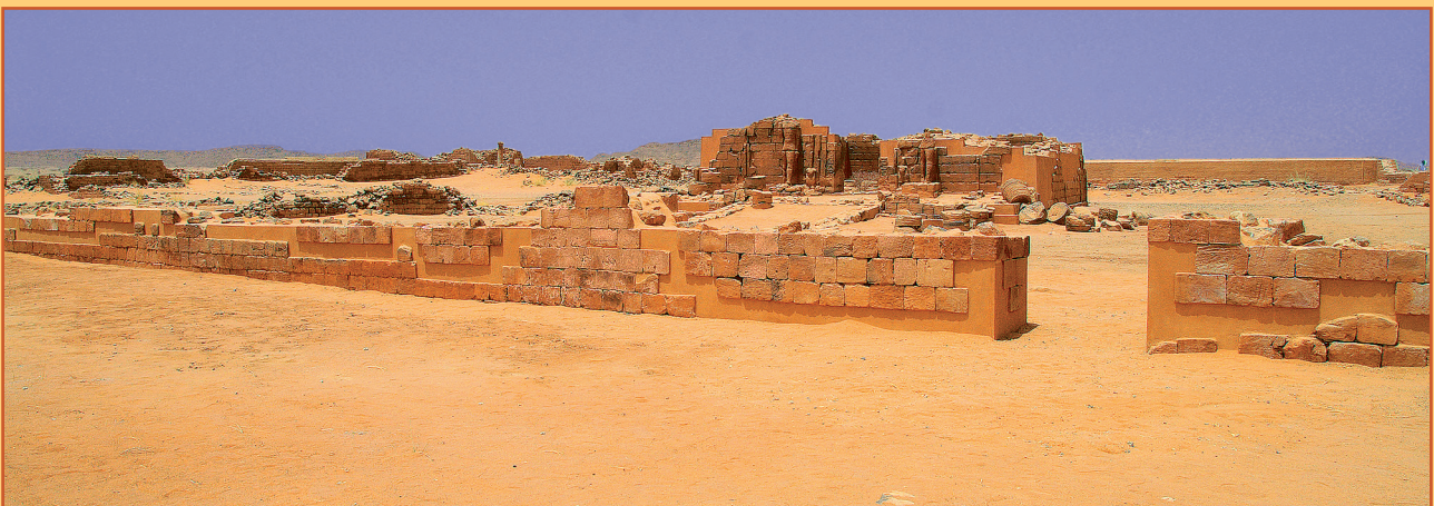
Farbabb. 12: Die restaurierte Mauer 304/305 mit dem wieder hergestellten Durchgang und dem sanierten Tempel 300.