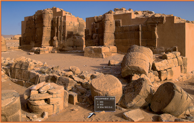
Farbabb. 7: Ausgangszustand der SE-Ecke des Tempels 300.