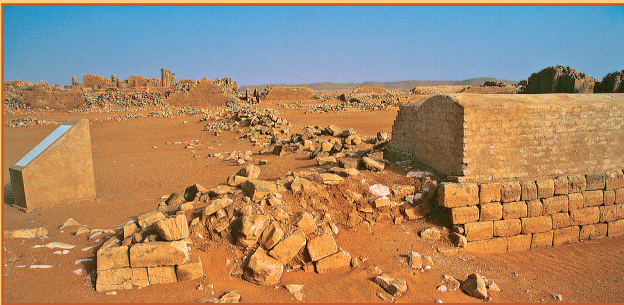
Farbabb. 9: Rückblick: Die Situation im Norden des Hofes 305 und im Südteil von Hof 304 mit der Umfassungsmauer und dem Tempel 300 zu Beginn der Kampagne 2006.