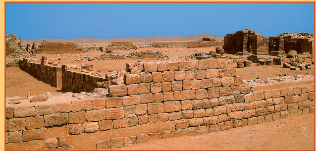
Farbabb. 10: Ansicht dieses Areals nach Abschluss der Sanierungs-, restauratorischen Wiederherstellungs- und Neugestaltungsarbeiten der Kampagnen 2006-2008.