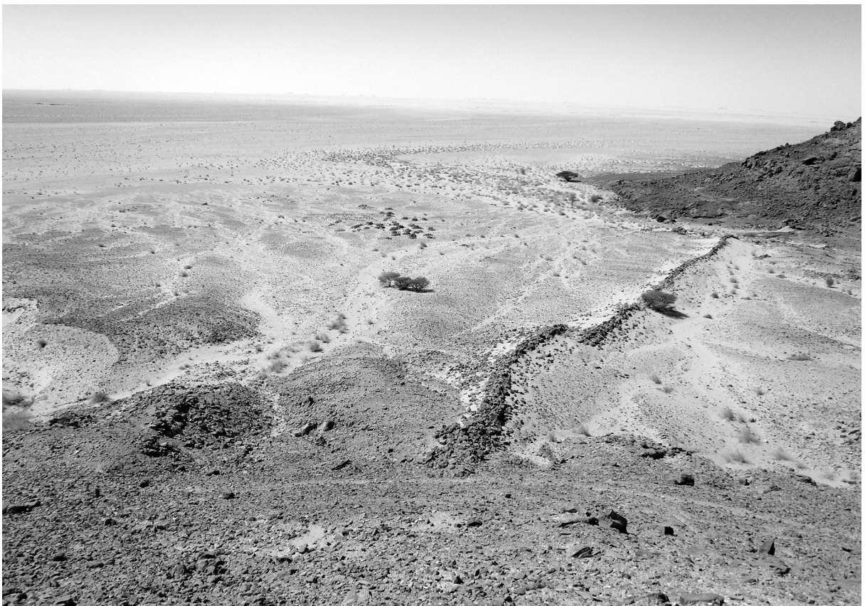
Abb. 5: Blick von Nord-Osten, Mauer mit einfachem Tor und außerhalb der Mauer liegende Friedhöfe.