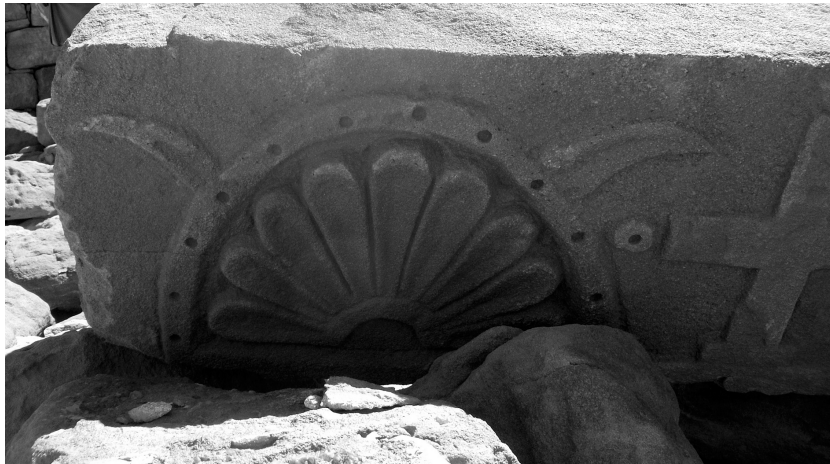
Abb. 6: Florale Muster auf Versturzquader, vermutlich Türsturz.

Nördlich der Kirche ist an der Oberfläche eine runde, eimerähnlich mit Lehm ausgekleidete Grube zu sehen, wie sie ähnlich auch in der Kirche Sur 22a dokumentiert wurde. 11