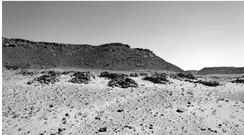
Abb. 7: Blick von Westen, außerhalb der Mauer befindlicher box grave -Friedhof (Foto: Mathyschok).

befindet und identifiziert eine der Anlagen mit dem Kloster von al-Ghazali. 22 Die Formulierung „zwischen den Nuba und dem Sudan“ könnte sich meiner Meinung nach jedoch auch auf eine Gegend zwischen dem Niltal und Kordofan beziehen, was eine Identifizierung der im Hudud el-Alam beschriebenen Anlagen mit dem Gebäudekomplex vom Gebel al-Ain ermöglichen würde. Die Schilderung, dass es sich um eine unzugängliche Gegend handelt, die von Kairo 80 Tage mit dem