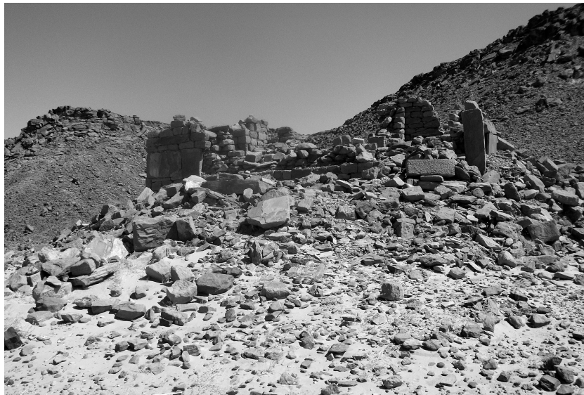
Abb. 3: Kirche, Blick von Westen (Foto: Eger).

Bei der Kirche handelt es sich um eine Basilika mit dreischiffiger Grundform, nach außen ragender Apsis und dem Haupteingang in der Längsachse. Die Apsis ist nicht umbaut. Die Außenmaße betragen circa 11 m x 7 m. 7 Innerhalb der Kirche fand sich ein reliefierter Türsturz mit Kreuz- und floralen Motiven (Abb. 6) sowie einer stilisierten Abbildung eines Menschen und geometrischen Motiven.