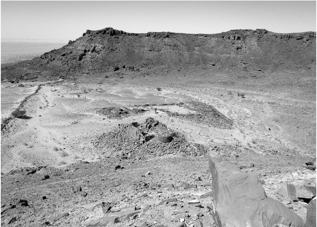
Abb. 4: Blick von Süd-Osten, Übersicht über den Fundplatz FJE2010-1 innerhalb der Mauer.